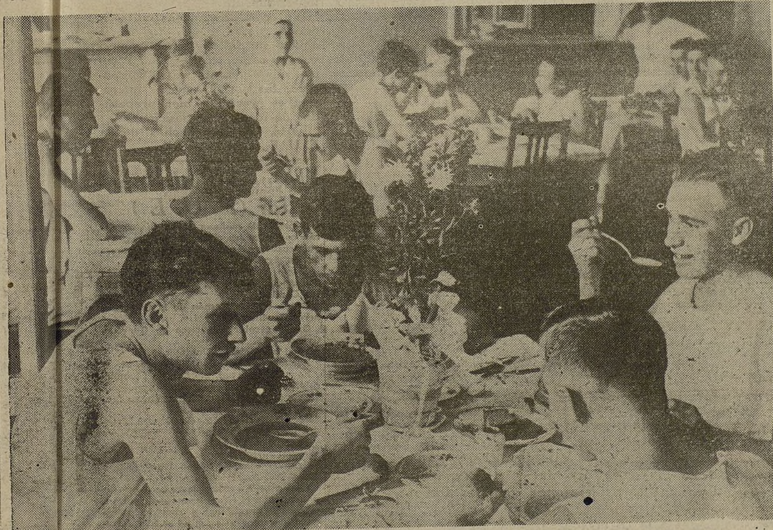
Un grupo de soldados rojos, que acaba de ingresar en filas, cenando en un sanatorio del Ejército rojo en Leningrado

Se convoca a los militantes de las antiguas Células 11 y 24 y a los del Grupo 22 del Sector Sur para la reunión del Grupo que se celebrará el día 20 del corriente, a las siete de la tarde, en el Sector sito en la calle de Santa Isabel, 44.