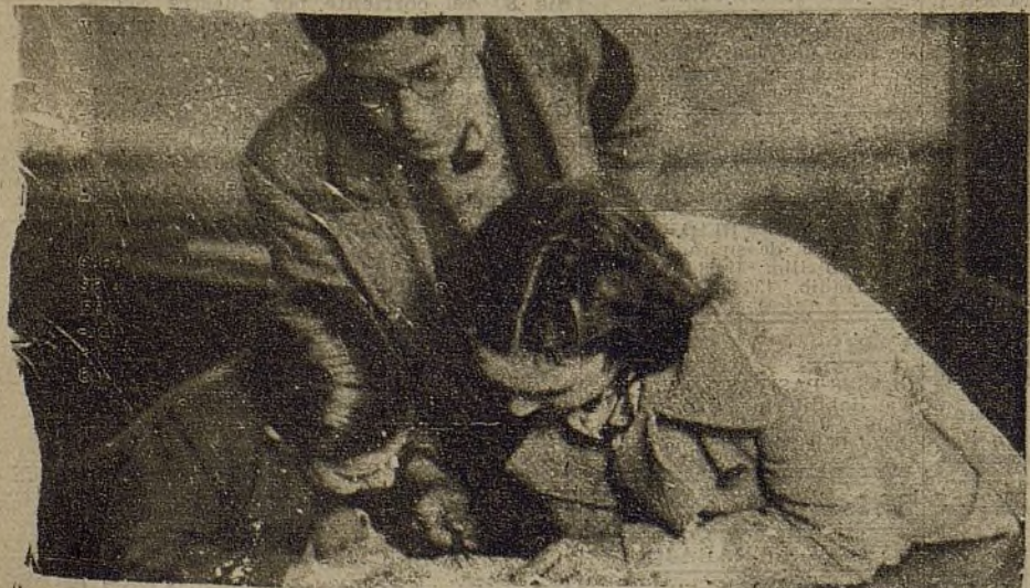
Se forja una generación para la que la ciencia no tendrá ningún secreto. El estudio se ha hecho un deber para la juventud.