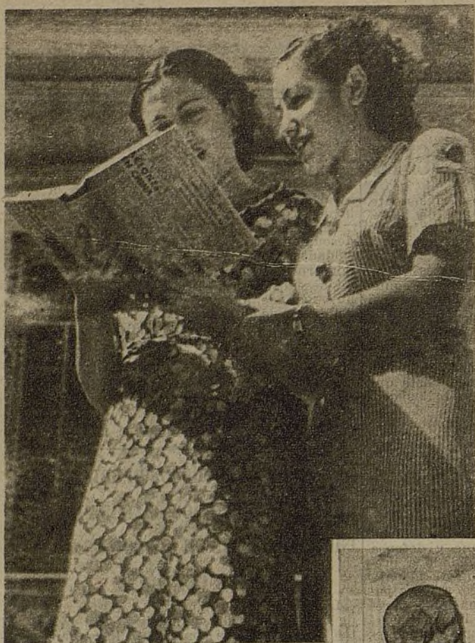
Pertenece a un tipo de mujer que ha puesto de relieve la guerra y la revolución: sencilla, natural, práctica.

La revolución, al conquistar la libertad y el bienestar para la nueva generación, ha provocado en toda la juventud el deseo de saber, de poseer una cultura, de desarrollar su inteligencia y su capacidad creadora.—(De las bases de Alianza.)