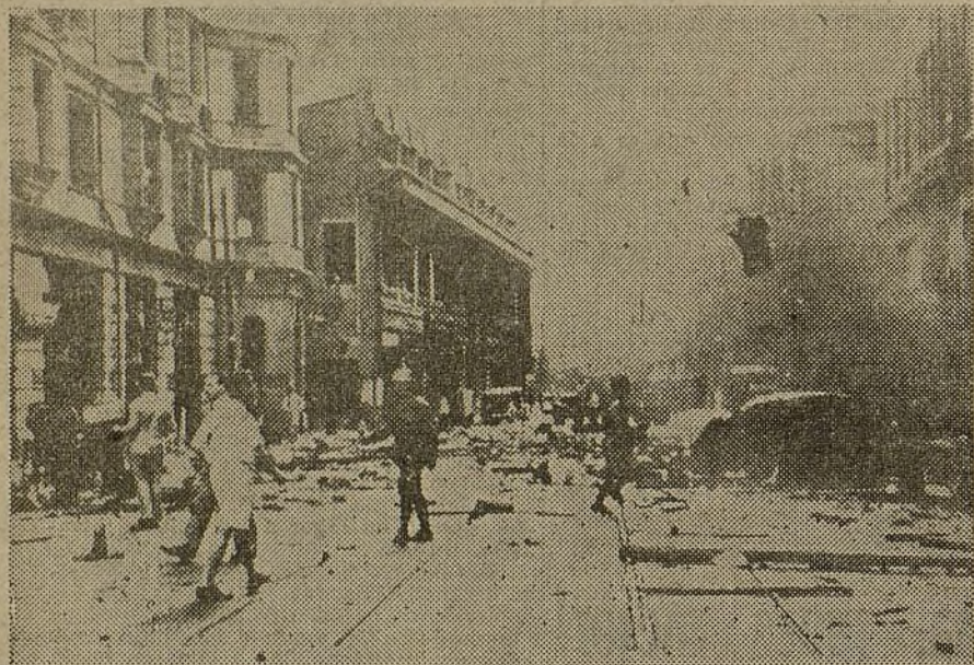
Impresionante aspecto que ofrece una de las calles de Shanghai, después del reciente bombardeo aéreo

PARIS, 18.—El "Populaire" señala que con arreglo a un Acuerdo entre Francia y la Gran Bretaña y con objeto de facilitar la colaboración de sus flotas en el ejercicio de la vigilancia en el Mediterráneo, las bases navales francobritánicas están a disposición, recíprocamente, de los navíos de ambas potencias.—Fabra.