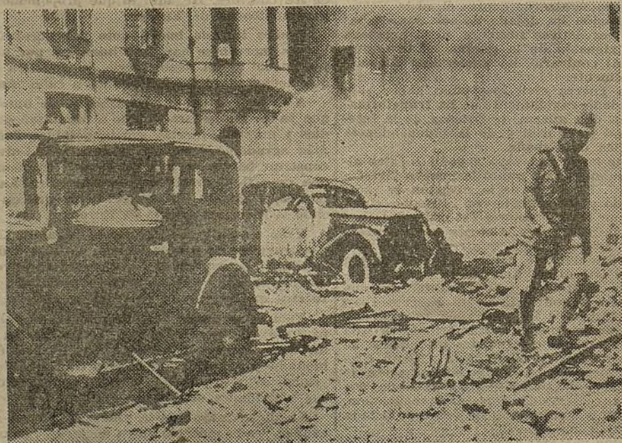
Un oficial de la Policía china recorre una calle de Shanghai, sembrada de despojos, en el distrito que ha sido el centro del ataque aéreo

SHANGHAI, 18.—En la noche del 14 de septiembre los japoneses consiguieron atravesar, a costa de pérdidas enormes, el río Yungting. En la vanguardia de las tropas japonesas atacantes marchaban tanques y automóviles blindados en gran cantidad. Durante ocho horas de combates durísimos las tropas chinas lograron rechazar a los asaltantes, pero más tarde, a consecuencia de un violentísimo ataque de las fuerzas motoriza-