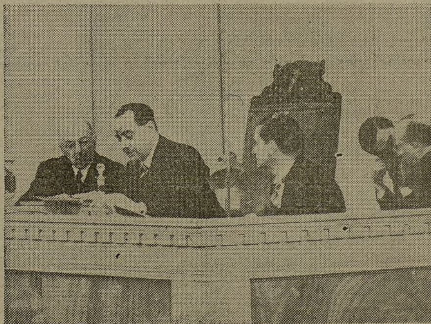
El presidente del Consejo de España y jefe de la Delegación en la Sociedad de Naciones, camarada Negrín, pronuncia su discurso en el acto de la apertura