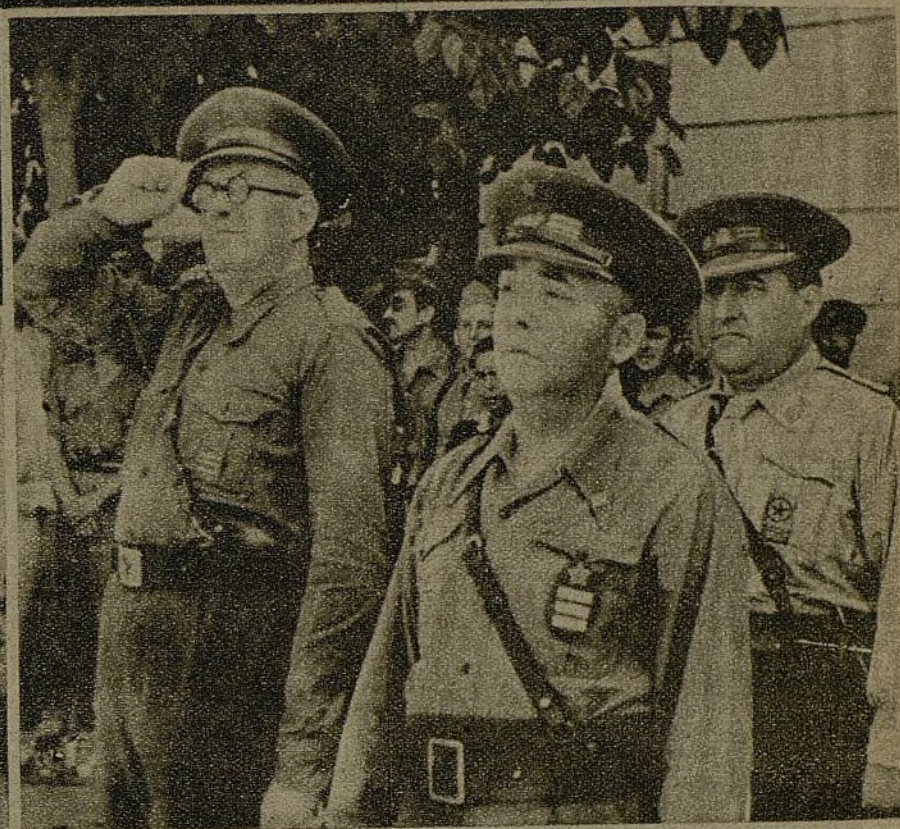
LOS CAMARADAS ALVAREZ DEL VAYO Y PRETEL ASISTEN A LA INAUGURACION DE UN HOGAR EN EL CUARTEL DEL REGIMIENTO NUMERO 9, EN VALENCIA

LA CONSIGNA LANZADA POR NUESTRA ORGANIZACION EN LA CONFERENCIA DE VALENCIA ES YA UNA REALIDAD EN CASI TODAS LAS UNIDADES DEL EJERCITO