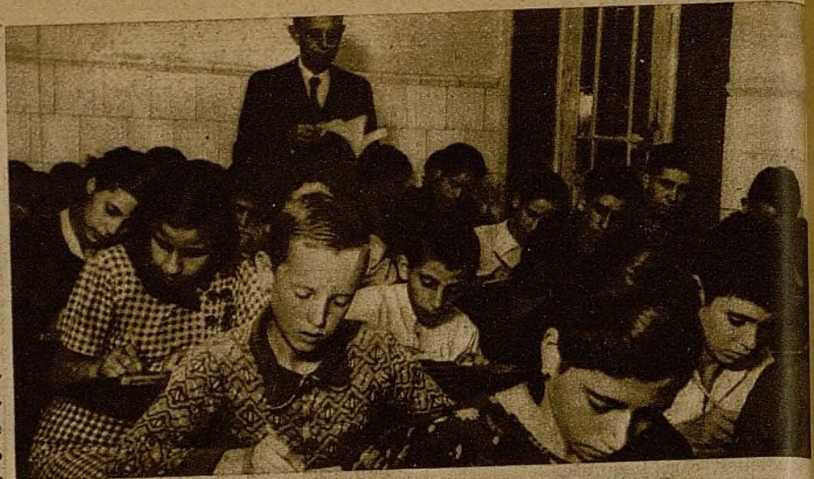
“... Víctimas que hemos arrancado a la guerra y al analfabetismo.” El profesor lo dice con cierta alegría.