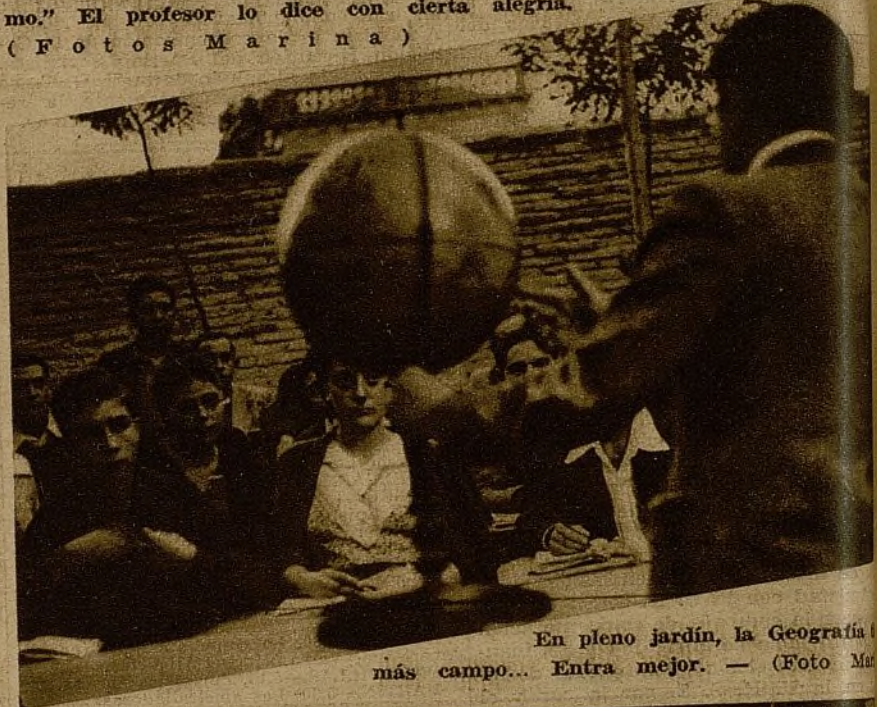
En pleno jardín, la Geografía más campo... Entra mejor.