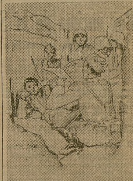
Pleno Ampliado del Comité Nacional de la J. S. U., celebrado en Madrid.

EJERCITO DEL AIRE. —Con excepción de algunos bombardeos efectuados en la carretera de Almedinilla a Priego (Córdoba), sobre convoyes de camiones enemigos, sólo ha actuado la Aviación en el Norte, donde la enemiga, compuesta de trimotores y cazas, intentó bombardear nuestros aeródromos, impidiéndolo la nuestra, que la obligó a que lanzaran las bombas fuera de los objetivos. En el combate entablado perdimos un aparato.