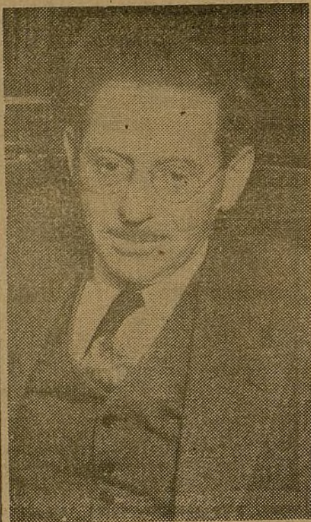
El gran abogado norteamericano David Levinson.

"El pueblo de todas las naciones está siempre en favor de la democracia y de la paz, y, por lo tanto, con el Gobierno democrático de España. Pero los Gobier-