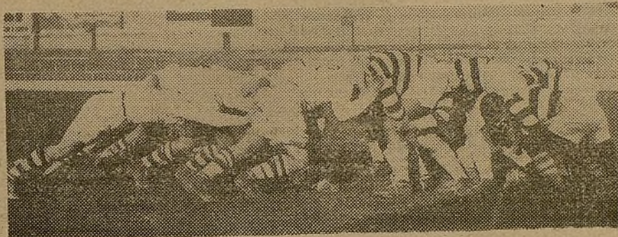
El medio "melée" echará el balón en medio del arco formado al juntarse los dos delanteros, y comenzará la lucha

En los festivales deportivos de vuestra brigada, de vuestra División pueden participar estos equipos invitados por vosotros cuando las necesidades de la guerra no lo impidan.