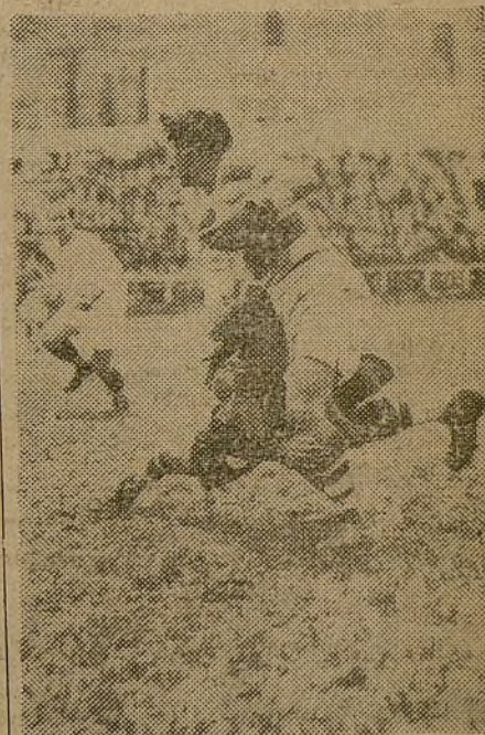
Un tres cuartos corre hacia el terreno de marca; un delantero placa

MOSCU, 11.—Ha llegado el avión "A. N. T-25", en el cual Gromov, Yumachev y Dalinin efectuaron su vuelo sin escala Moscú-Norteamérica a través del Polo Norte; ha sido transportado por mar hasta Leningrado, donde ha sido montado de nuevo. Una vez revisado está presto el "A. N. T-25" para efectuar nuevos vuelos.—A. I. M.