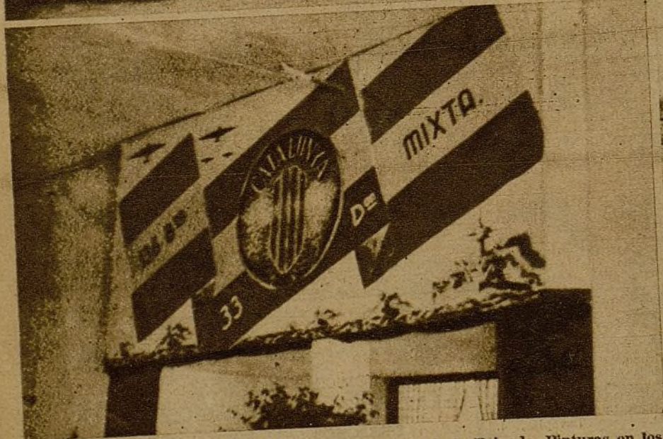
Dos ejemplos de cómo cuida el Arte el Comisariado de la Brigada. Pinturas en los muros del bar del "Llar del combatent"