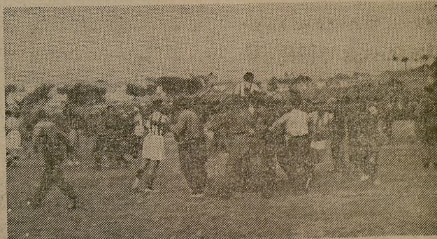
La 69 Brigada prosigue las competiciones para los campeonatos deportivos. El domingo pasado el entusiasmo cundió al finalizar las pruebas

(Enviado por el monitor del 6.º Cuerpo de Ejército.)