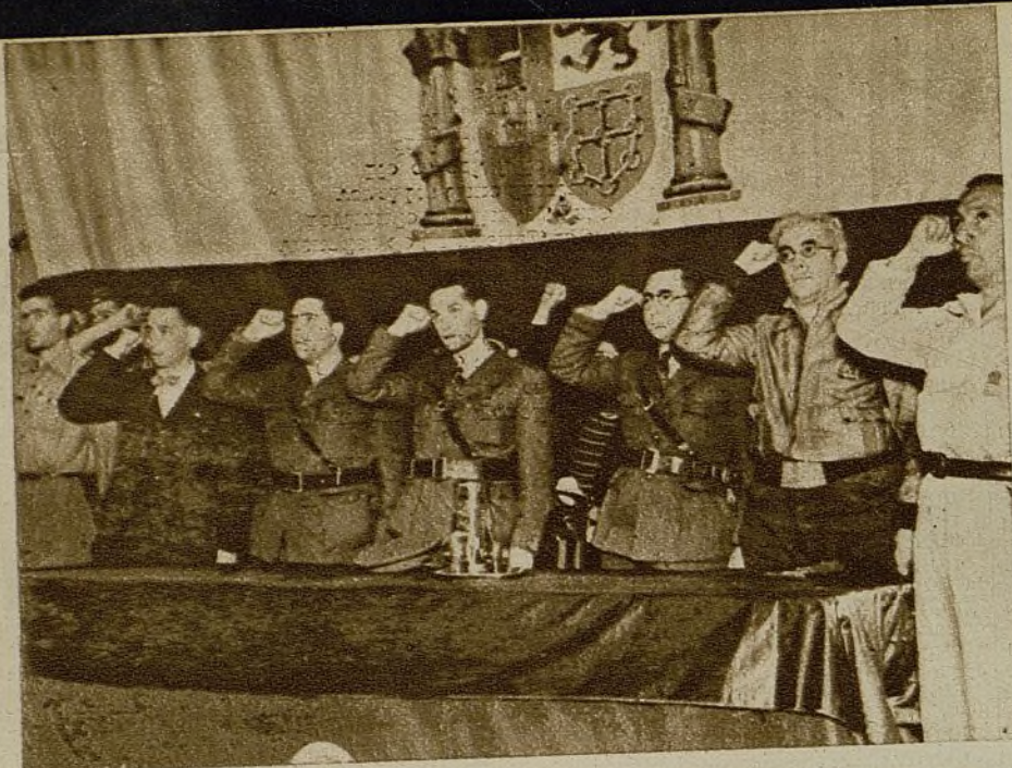
Días pasados se clausuró en la Gimnástica el curso de instructores de cultura física del Comisariado de Guerra. He aquí la presidencia del acto