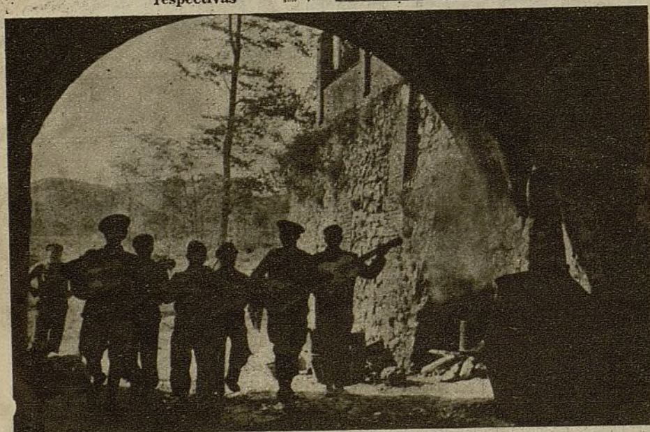
Bajo el arco de piedra blanca pasan, tocando y cantando, los seis jóvenes músicos del batallón. El aire de guerra, en los breves descansos, se puebla de canciones e instrumentos