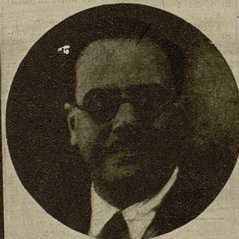
Los señores Negrín y Companys, que ayer llegaron a Madrid, entre el entusiasmo y la simpatía de todo nuestro pueblo, que ve en ellos a dos abnegados defensores de la causa popular, a dos amigos de la juventud española