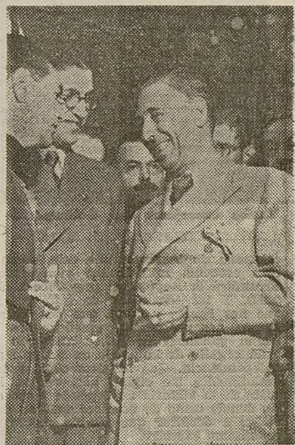
El señor Companys conversa con los periodistas

Ayer mañana han visitado los frentes de Madrid el jefe del Gobierno y el pre-