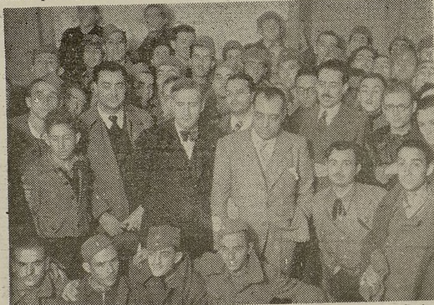
Varios consejeros del Gobierno de Cataluña en el Hogar del Combatiente Catalán

ses de comenzada, no hubieran podido continuar sin la colaboración solapada, primero, y la invasión cínica, después, de dos naciones extranjeras que, con menosprecio y burla de lo estatuido en materia internacional, encontraron beneficioso el ensayar la potencia destructora