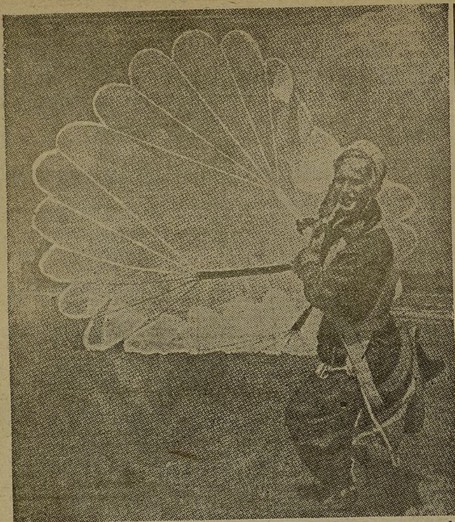
El paracaidismo, deporte que la juventud española quiere y va a practicar con la ayuda del Ministerio de Instrucción Pública