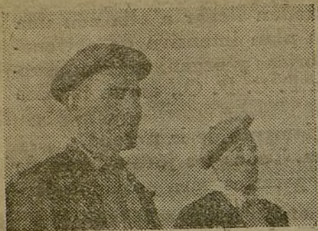
Hombres de nuestros campos. Miran sonrientes al porvenir...