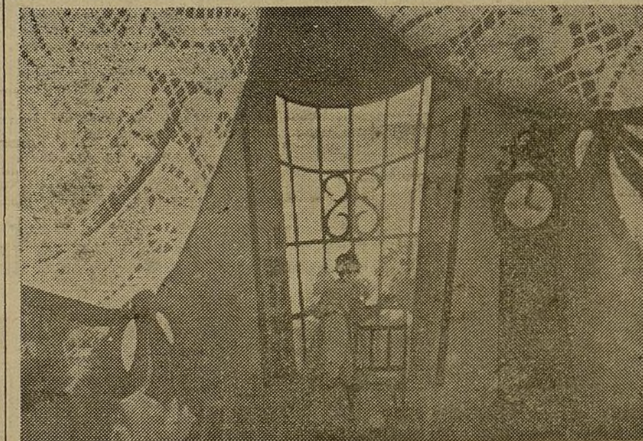
Una escena de "Los títeres de Cachiporra", de García Lorca, que, junto con otras obras de prestigiosos autores, constituyen el repertorio de la Zarzuela para esta temporada

Reunidos, pues, y cantad, bien o mal; después se arreglan y afinan las dificultades. No recuerdo si fué Juan Jacobo Rousseau quien dijo esta frase: "Por las palabras las personas disputan, riñen, se separan; por el canto, se unen y son fraternales".