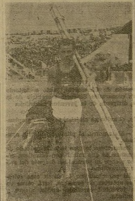
Osolin, el gran campeón soviético de pértiga

Nicolás Osolin es uno de los deportistas soviéticos más populares y el más extraordinario saltador con pértiga de la U. R. S. S. Este atleta ha logrado arrebatarse últimamente a Charles Hoff el re-