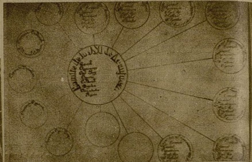
En la Secretaría general, un gráfico refleja la marcha de la organización. Uno tras otro, los "globos" que representan los clubs van quedando llenos con los datos de organización

¡Ni un solo analfabeto sin recibir clase! Cada día se gana un joven para la cultura.—(F. Marina.)