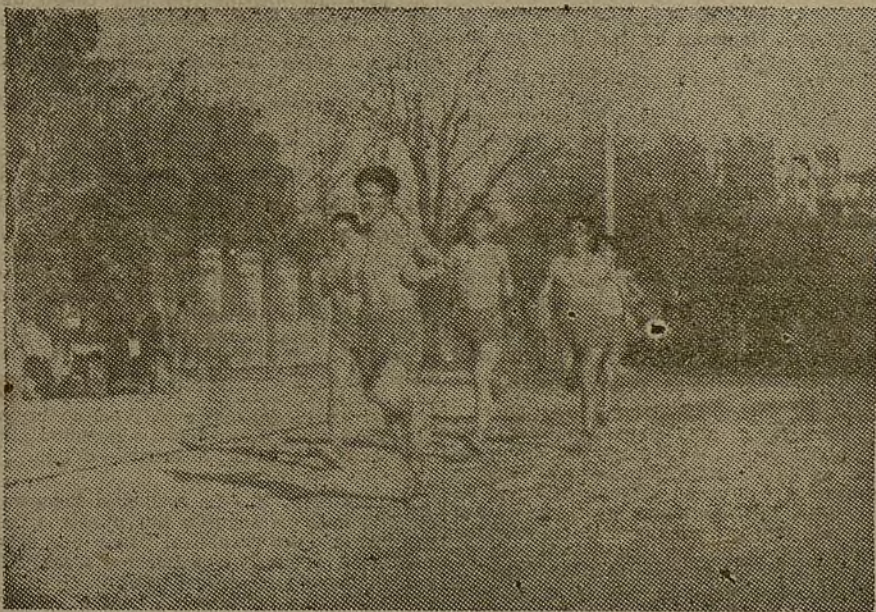
Los equipos que participarán mañana en el Gran "Cross" de la Juventud, organizado por el Club AHORA, han desarrollado en los días anteriores un intenso entrenamiento sobre el propio terreno del Retiro.

Art. 9.º Todo lo no previsto en el presente reglamento será resuelto por la Comisión organizadora dentro del estricto criterio de la ecuanimidad y de la justicia.