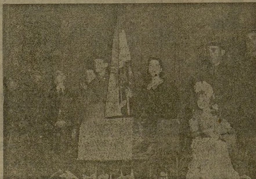
Homenaje a la 36 Brigada mixta, con motivo de la entrega a su 143 batallón de la bandera y banderines que le regala el Monte de Piedad y Caja de Ahorros de Madrid

Su jefe se suicidó arrojándose por una ventana del tercer piso de la casa en donde fueron detenidos.—Fabra.