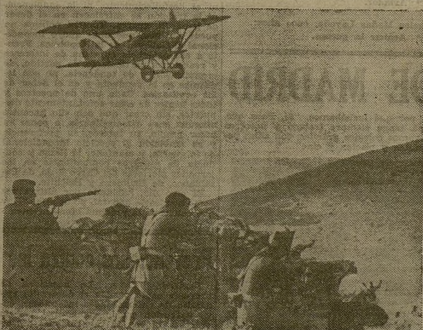
Los heroicos soldados del Ejército Popular, nuestros jóvenes y bravos aviadores, toda la juventud antifascista de España, se encuentran más dispuestos que nunca a conseguir la victoria completa sobre los enemigos de las libertades populares

cia Provincial nuestra organización se marcó la tarea de forjar la unidad de toda la juventud antifascista. Los ejemplos prácticos que a raíz de aquella reunión nos ofrecieron diversas organizaciones de la provincia, entre otras, la de Aranjuez y Chamartín, aparte de aquellos otros que nos fué dable recoger como realización magnífica en la capital, demuestran que la juventud campesina ha sentido de siempre la necesidad de marchar unida, de combatir conjuntamente a nuestros enemigos. Ahora, con la Alianza Juvenil Antifascista en marcha, crea-