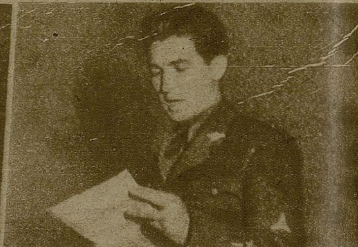
El chófer de Beimler: "Jamás olvidaré la energía y la bondad de Beimler. Su recuerdo quedará en mí durante toda mi vida"