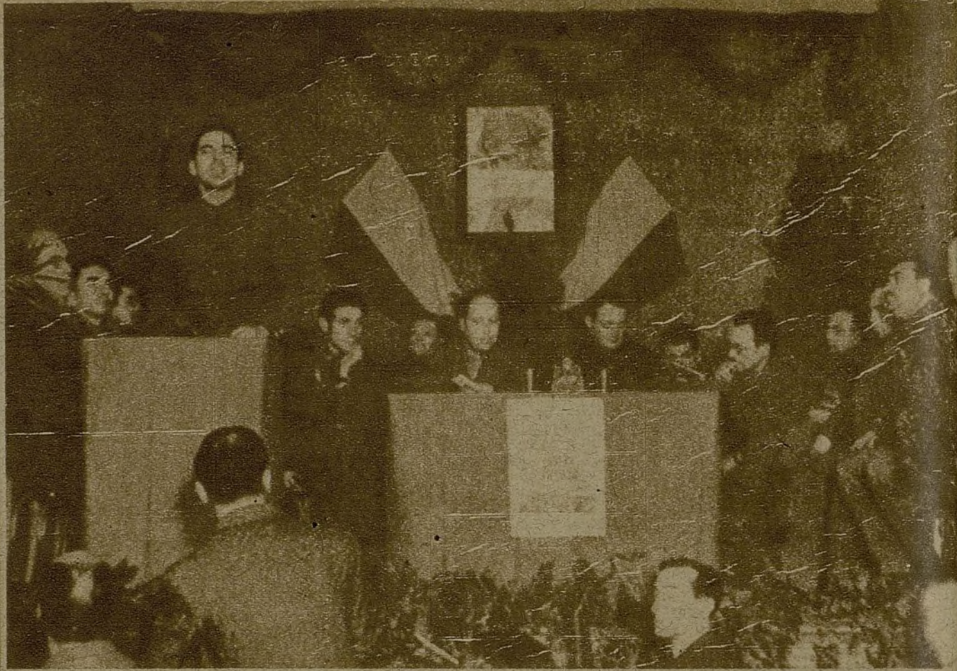
Presidencia del acto-homenaje a la memoria de Hans Beimler. En ella, un combatiente de la Brigada Internacional. Palabras pronunciadas en un idioma hermano, pero de tal forma, que el espíritu vibraba como si estuvieran pronunciadas en nuestro propio idioma. Era la voz de los trabajadores del mundo, de los amantes de la paz y la libertad de los pueblos.

El Comisariado de las Brigadas Internacionales rindió ayer, al cumplirse el aniversario de la muerte del gran luchador antifascista Hans Beimler, un caluroso y entusiasta recuerdo en su memoria. Los allí reunidos, representantes de todas las organizaciones, jefes militares y autoridades civiles, prometieron seguir el ejemplo del héroe hasta conseguir la derrota total del fascismo