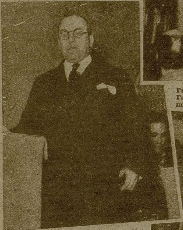
El alcalde de Madrid: "Promesa de sacrificio del pueblo de Madrid por la defensa de la libertad del mundo entero"