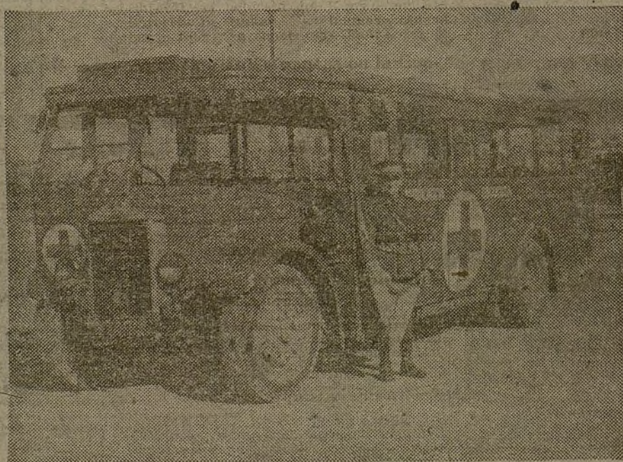
Ambulancia que la Cruz Roja escocesa ha regalado a la España republicana

PARIS, 3.—Comunican de Burgos que, a consecuencia de un accidente de automóvil, ocurrido entre Valladolid y Burgos, el traidor Queipo de Llano ha sufrido la fractura de un brazo.—Fabra.