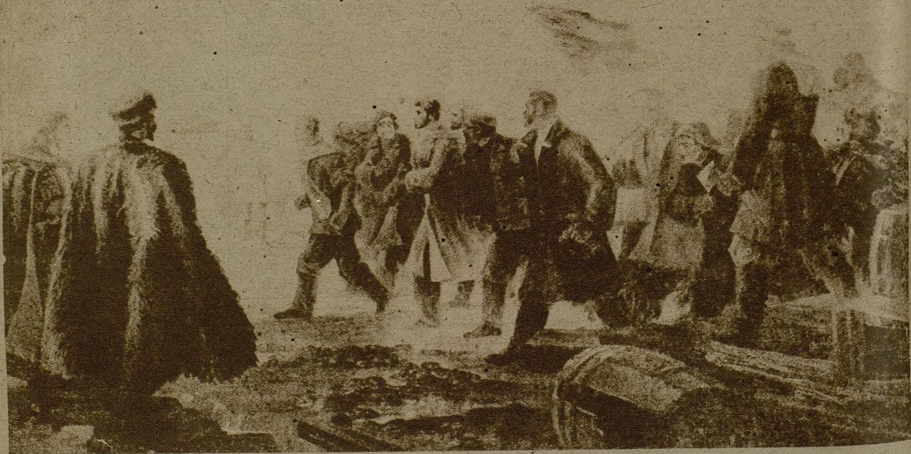
Magnífico cuadro del pintor A. Kouteladzé, titulado "La manifestación obrera de Bataun, en 1902, bajo la dirección del camarada Stalin. En él se representa la famosa manifestación política obrera, con motivo de la huelga en las oficinas Rotschild y Mantachév, que fué el principio del pujante vuelo del movimiento revolucionario en la Transcaucasia