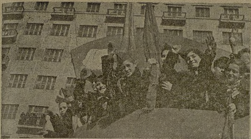
Grupo de niños españoles saludando desde la tribuna de la plaza Dzerjinski, de Jarkov, al paso de la gran manifestación celebrada con motivo del XX aniversario de la revolución soviética