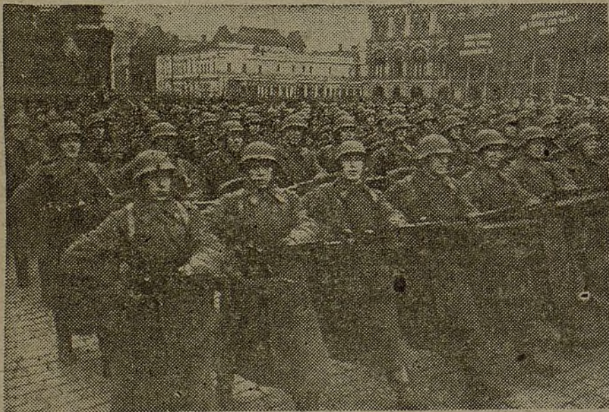
Las unidades del Ejército Rojo obrero y campesino, de la División proletaria de Moscú, desfilando el 7 de noviembre por la Plaza Roja.

Mientras en la Alemania de Hitler y en la España fasciosa presentan este balance desastroso, hambre y terror, en la Unión Soviética, país feliz, estos camaradas estarán unos días con sus familiares, dos meses en un sanatorio y después un mes descansando en su casa, antes de reanudar sus trabajos.