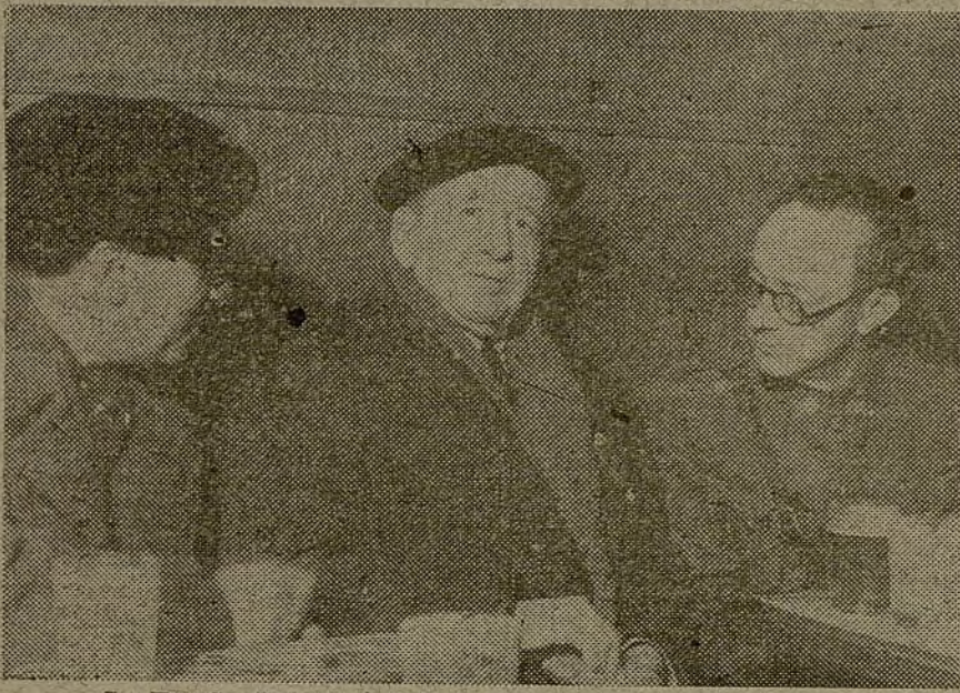
La España "grande y única" del imperialismo.

Aquí la tenemos. En la historia de la vida de este anciano obrero. Es como si hubiéramos retrocedido cuarenta y cinco años... o simplemente como si estuviéramos oyendo a un obrero actual de... Sevilla o de Salamanca. Porque esto es lo que pasaba, y lo que pasa y pasará donde la reacción pone su garra.