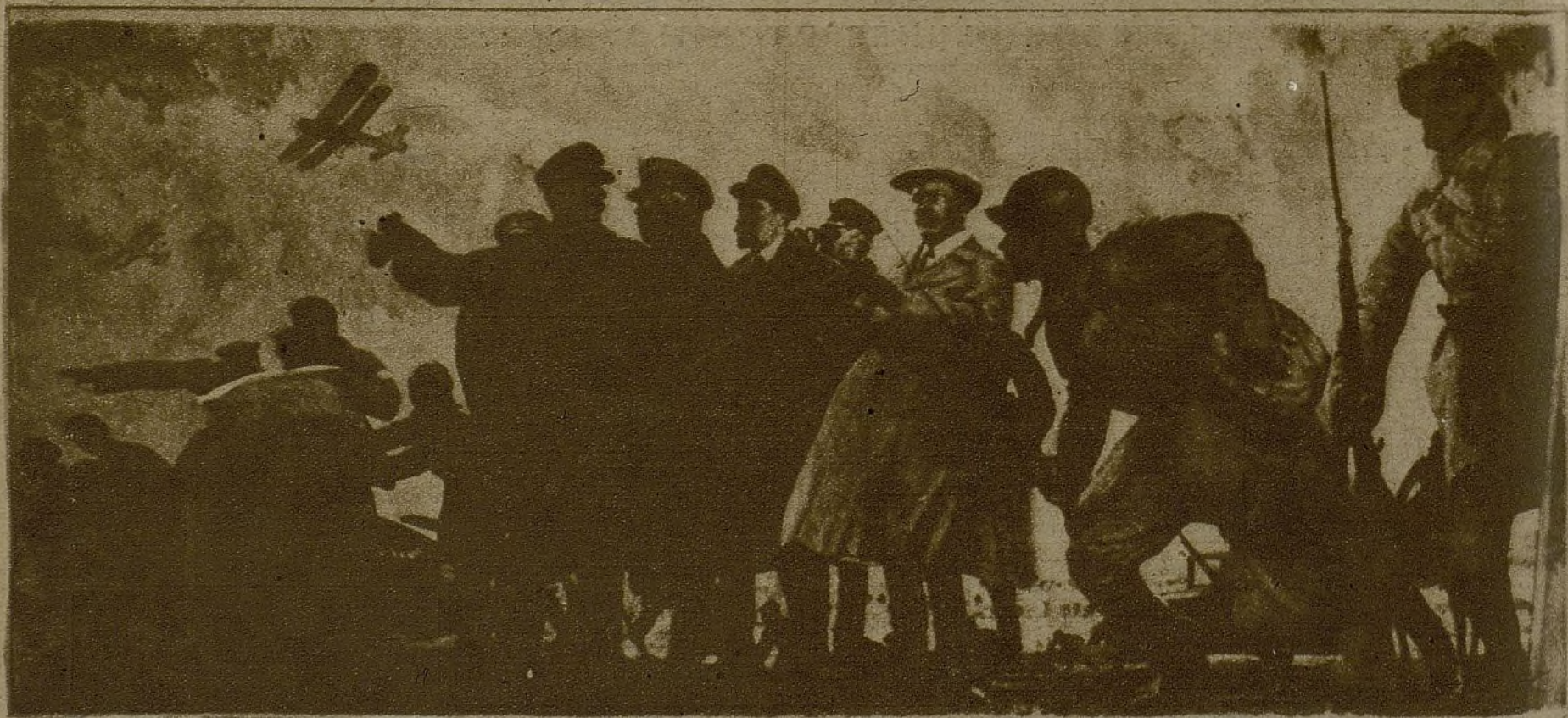
El camarada Stalin, junto con otros destacados miembros del Estado soviético, durante unas maniobras de la Aviación roja