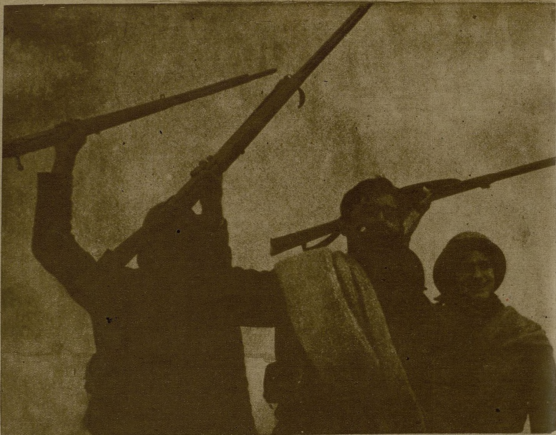
Los jóvenes soldados de nuestro glorioso Ejército tienen confianza en la potencia de sus armas de combate, que no abandonarán mientras quede un solo fascista sobre el suelo español