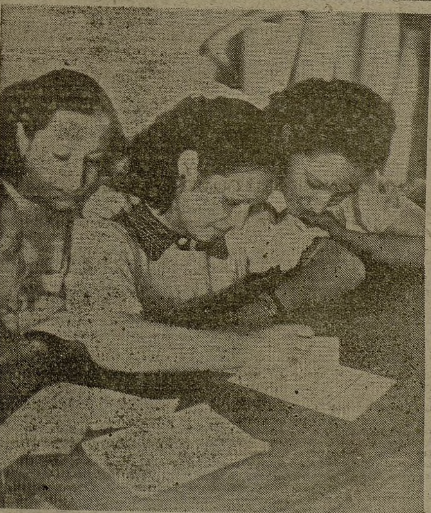
Las muchachas estudian y se capacitan para ocupar los puestos que nuestros soldados han dejado vacantes

—Antes tenían la costumbre, cuando llegaba el anochecer, de subir y bajar las persianas de madera tres o cuatro veces. Como el refugio ocupa lo menos seis o siete pisos de esta casa, se armaba un pris, ras! de mil demonios. Empezaba, por ejemplo, el primero de aquel rincón, y seguía es-