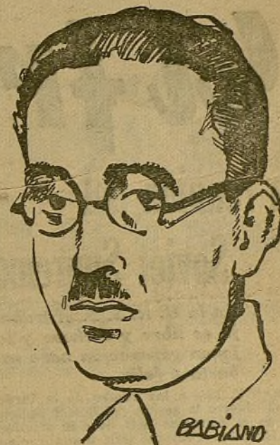
El general don Vicente Rojo, que por justa decisión ministerial ostenta actualmente la gran Placa laureada de Madrid, a la que le ha dado merecimiento su comportamiento en el transcurso de la guerra y, más recientemente, en las operaciones de Teruel

La Aviación leal realizó, como de costumbre, vuelos de observación y vigilancia. La facciosa se internó por nuestras líneas, pero no pudo realizar bombardeo por el intenso fuego que se le hizo. Los aviones rebeldes dejaron caer algunas bombas en las cercanías de Vicién, sin causar desgracias ni daños.—Febus.