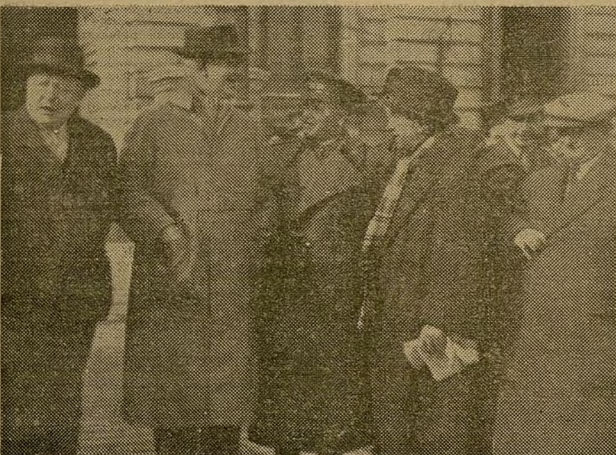
Los diputados laboristas en unión de las autoridades y jefes militares de nuestro Ejército popular

Mañana, a las doce, hablarán por radio al pueblo inglés.