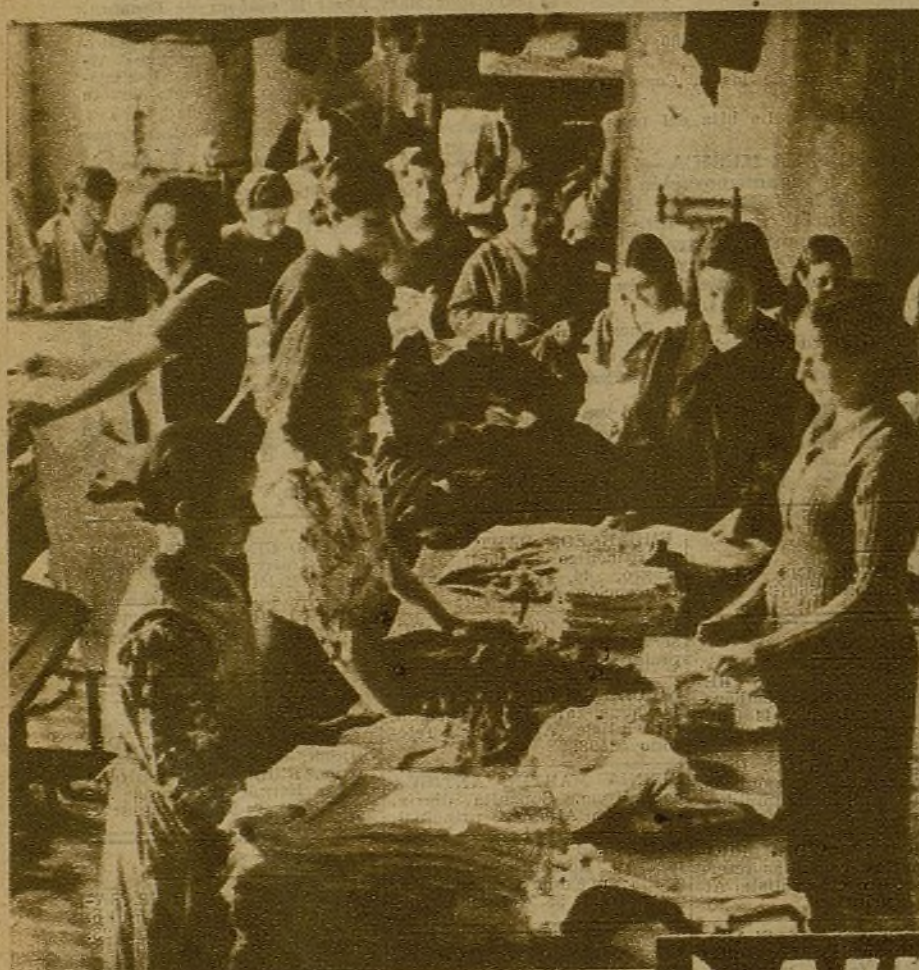
Muchachas madrileñas confeccionando ropa que habrá de destinarse a los heroicos soldados del Ejército popular