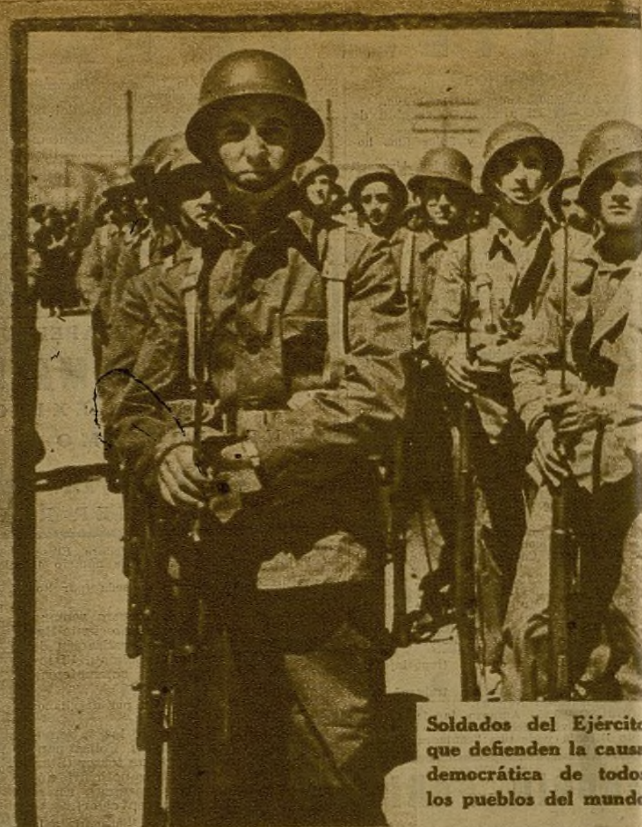
Soldados del Ejército que defienden la causa democrática de todos los pueblos del mundo