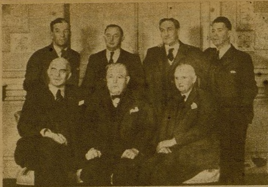
La Delegación de diputados laboristas que en estos días visita Madrid