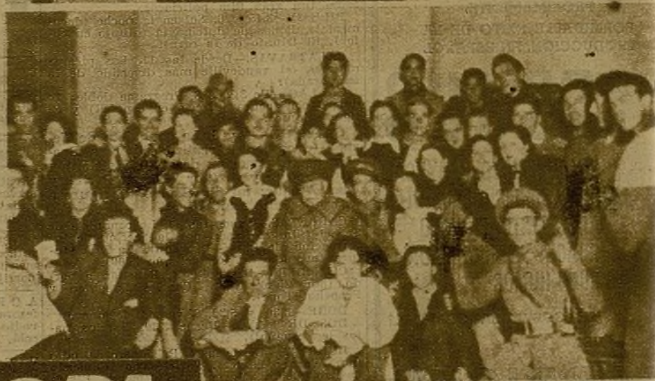
Grupo de asistentes al festival organizado por el Batallón de Sanidad del Segundo Cuerpo de Ejército