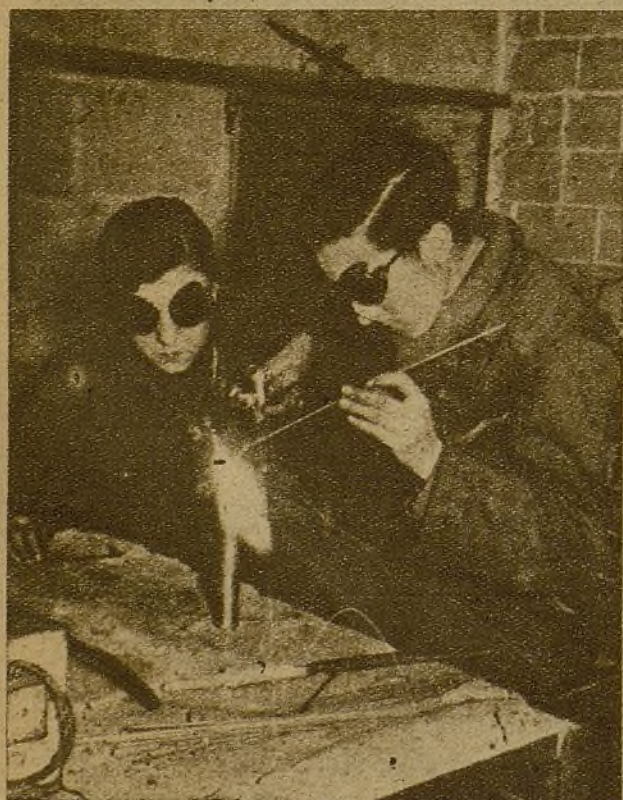
La incorporación de la juventud de ambos sexos a la producción va convirtiéndose en una magnífica realidad. Las muchachas y los jóvenes no incorporados al Ejército, contribuyen de esta forma a la victoria sobre el fascismo