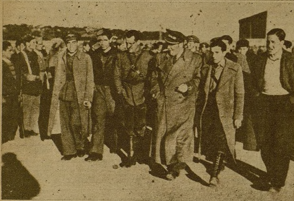
Atendiendo a las invitaciones hechas por diversas unidades del Ejército del Centro, una Comisión del Frente Popular de Madrid ha venido haciendo durante estos días diferentes visitas. Los delegados, acompañados del teniente coronel, visitando las Brigadas de la 11 División, que con tal motivo realizaron algunos ejercicios tácticos. Los miembros jóvenes de la Comisión (a la derecha), entre los que se encuentra el representante de la J. S. U., conversan con los camaradas soldados