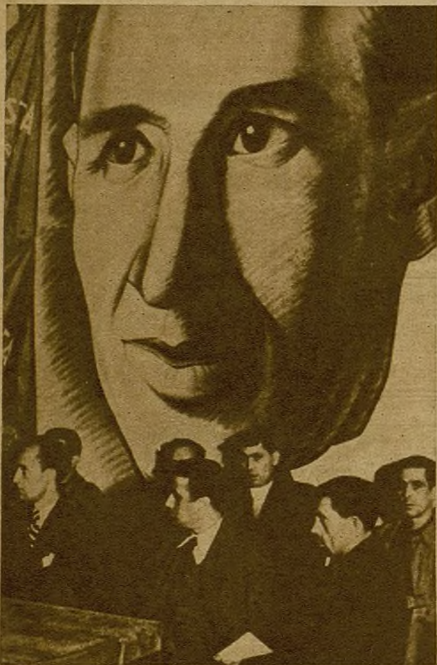
Presidencia del acto celebrado en la mañana de ayer en recuerdo del líder sindicalista, Angel Pestaña