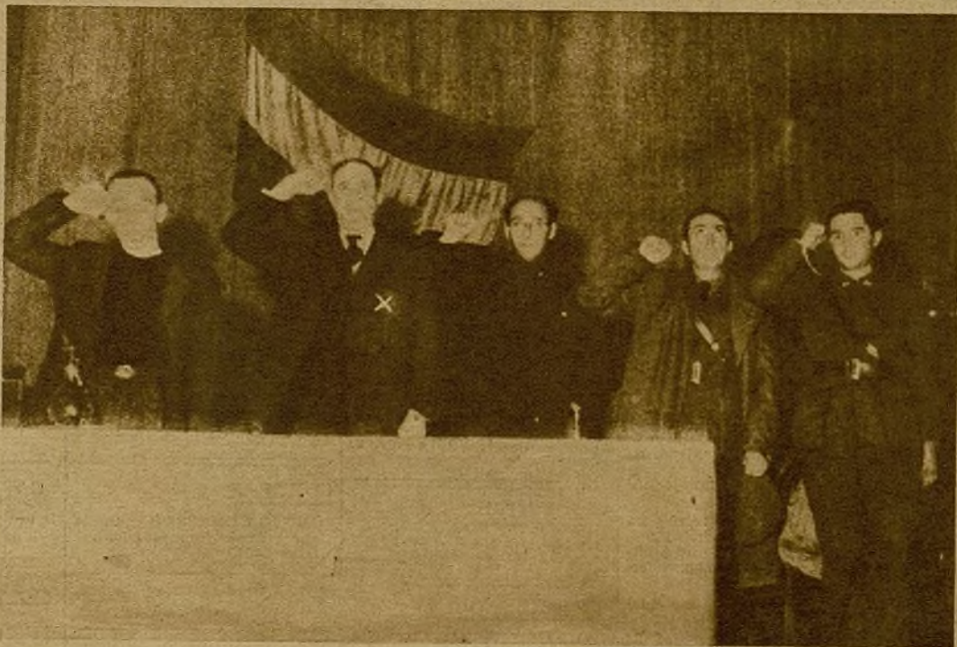
El Frente Popular de Madrid dedicó, en la mañana de ayer, un homenaje a la XV Brigada Internacional, con motivo del primer aniversario de su entrada en fuego, en defensa de Madrid. En la presidencia del acto figura el ilustre diputado comunista francés André Marty (x), que pronunció un brillante discurso