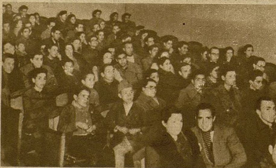
Un aspecto de la sala de actos del Auditorium durante la sesión de cine del Club AHORA, celebrada en la tarde del domingo