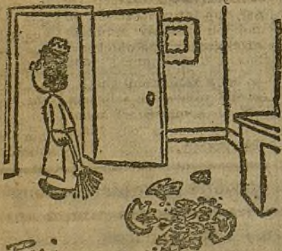
LA SIRVIENTA.—¡Señora, acabo de boycotear el gran jarrón japonés! (Del "Canard Enchaîné")

Alma y nervio de nuestro Ejército, los comisarios, justamente dirigidos, mantendrán alta la bandera de su heroica historia, la bandera que bordaron sus mejores elementos, salidos de las entrañas de la juventud española.