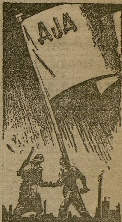
ción de masas que venga a reforzar más la lucha por la unidad, por la Alianza Juvenil Antifascista.

Rasgo elocuente que no debe de pasar desapercibido. Ejemplo que nos dan quienes todo se lo merecen por su comportamiento en la guerra y que aun se desprenden de su comida en beneficio de los trabajadores de la producción de guerra.