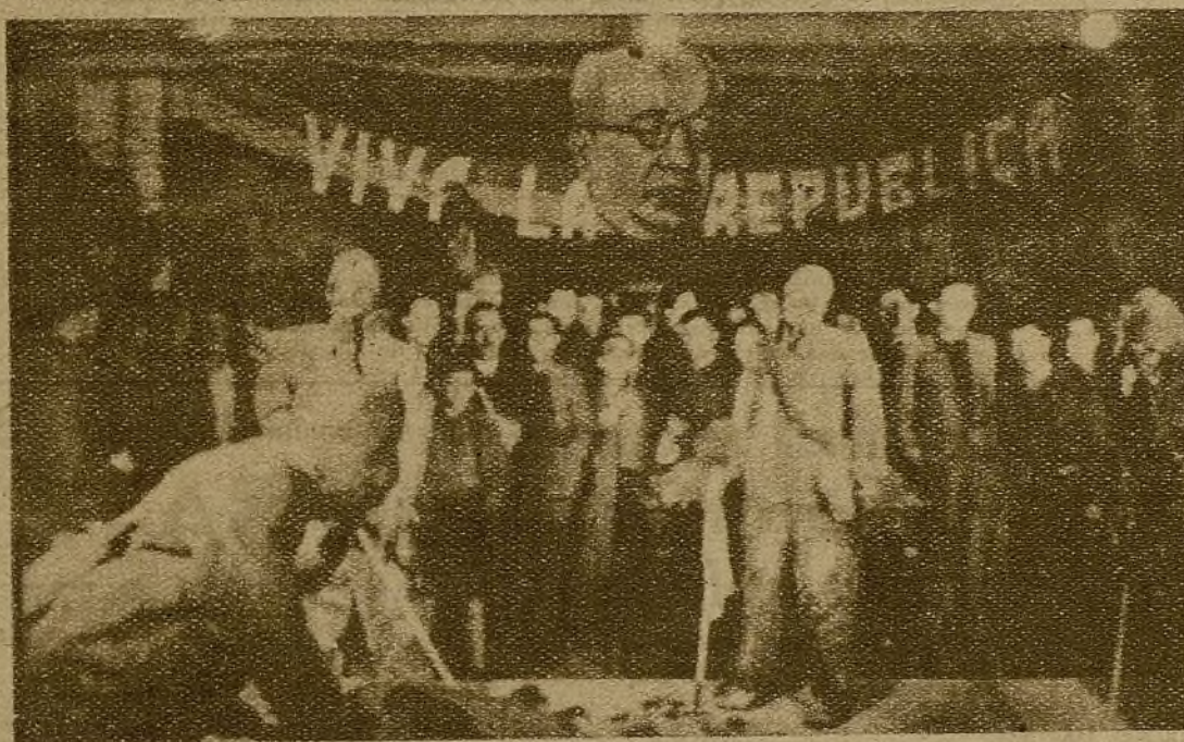
He aquí un aspecto de la Exposición de Artes Plásticas, organizada en Madrid por la Sexta División, cuyo jefe, [redacted] y comisario, [redacted], están siendo muy felicitados por tan acertada iniciativa.