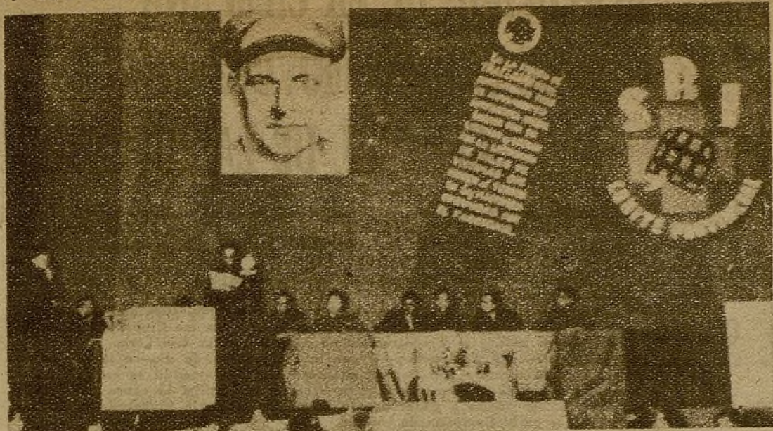
En el Monumental se ha celebrado un acto de solidaridad, organizado por el S. R. I., con motivo de cumplirse cinco años de la prisión del líder comunista alemán, camarada Thaelmann, mantenida contra toda justicia por los verdugos "nazis".