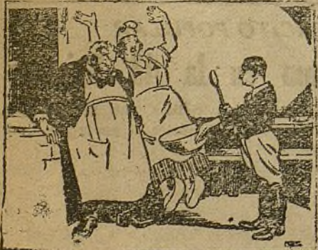
ADOLFO PIDE CADA VEZ MAS

LONDRES, 9.—En los círculos ingleses existe cierto pesimismo sobre las negociaciones entre Londres y Berlín. El Gobierno alemán parece negarse a que el problema de Austria sea motivo de ne-