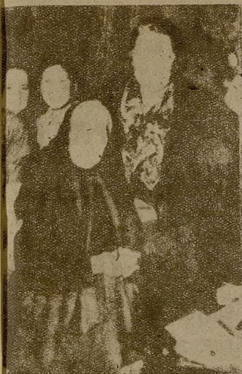
Dolores Ibarruri, "Pasionaria", ha sido escuchada en su último discurso, pronunciado en Madrid, por millares de mujeres, que la abrazaron y besaron para expresarle el cariño y la admiración que todo el pueblo español siente por ella.