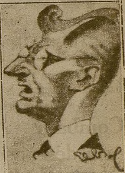
Schuschnigg, el aliado de Hitler, que no ha sabido defender la independencia de "su" patria...

¡Unidad, unidad, energía y rapidez en la acción!