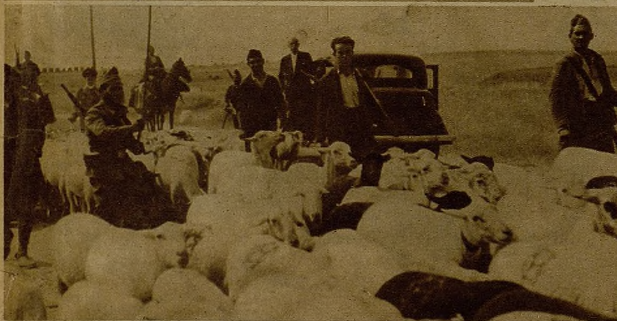
En uno de nuestros últimos avances, los soldados y milicianos que desalojaron al enemigo de sus posiciones se adueñaron con tal rapidez del terreno que los facciosos dejaron abandonado importante material y numeroso ganado. Parte de uno de los rebaños cogidos, que los atacantes llevaron a la retaguardia y que han sido transportados a Madrid