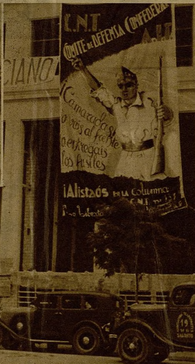
Un cartel monumental en Valencia, en el que se excita a la actividad a los milicianos de la retaguardia: "¡Camaradas: o vais al frente o entregáis los fusiles!"