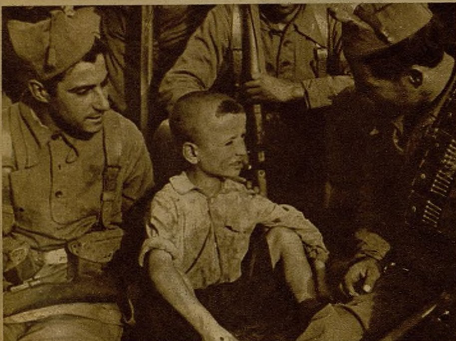
Un niño de Siétamo cuyos familiares, en número de ocho, fueron fusilados por los fascistas, relata el horrible trance a unos milicianos que le recogieron

(DE NUESTRO ENVIADO ESPECIAL EN EL FRENTE, JOSE QUILEZ VICENTE)