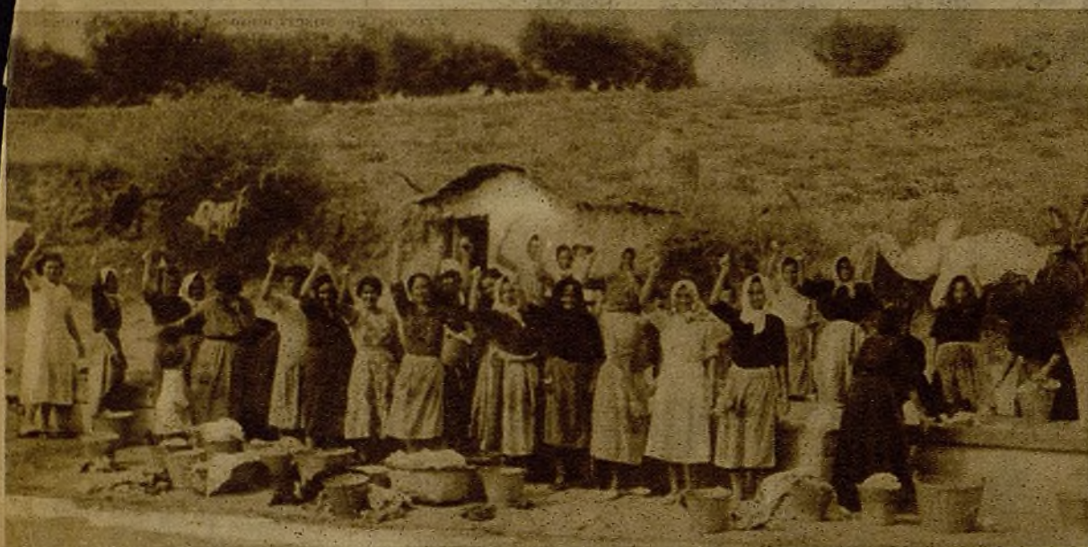
Lavanderas voluntarias de nuestros milicianos. Estas mujeres de Oñas se pusieron al servicio de los voluntarios y levantan el puño entusiastamente ante el objetivo, interrumpiendo unos momentos su tarea