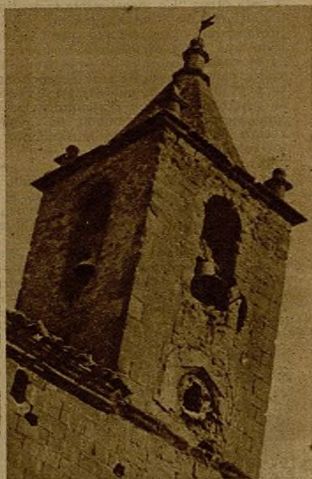
La iglesia de Siétamo

Sólo desolación y dolor es Siétamo. Sus muros de adobes han resistido cuatro ataques tremendos. Por cuatro veces estuvo en manos de los fascistas y otras tantas pasó a poder de los ejércitos republicanos, que hicieron punto de honor su conquista. Ahora ya nadie podrá arrebatarnos.