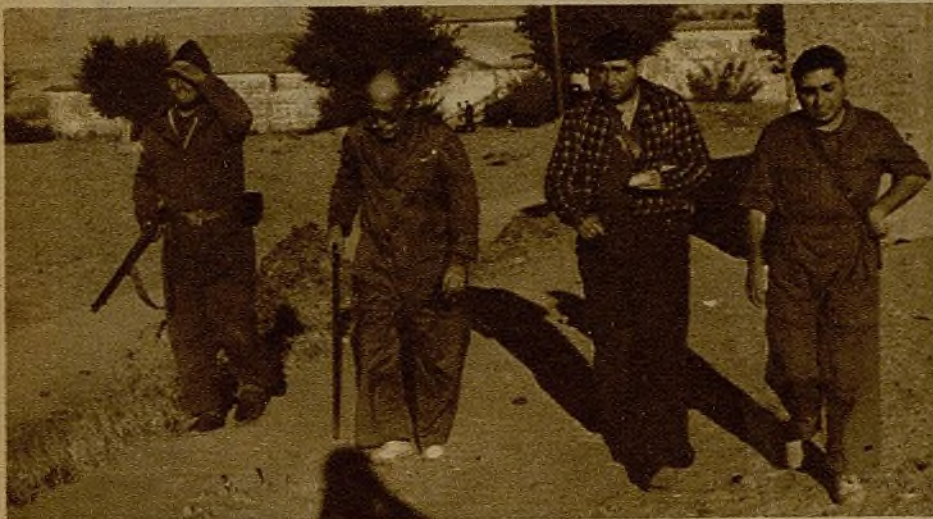
Nuestro compañero en el frente del Tajo dirigiéndose hacia la línea de fuego

(CRONICA DE NUESTRO REDACTOR JESUS IZCARAY)