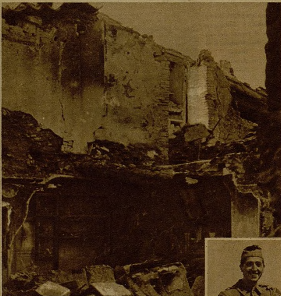
De la casa de unos recién casados de Siétamo sólo quedó un espejo...

A lo lejos hay ante nuestra retina un combate magnífico. ¡Nadie es capaz de detener el empuje de nuestros leales!