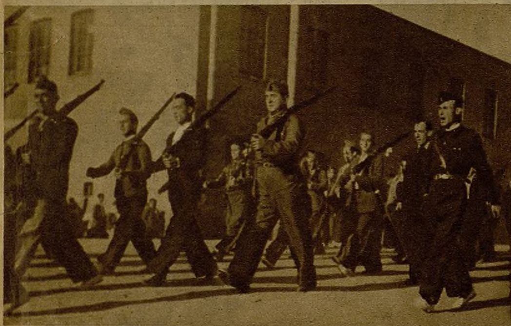
Un desfile marcial de la compañía voluntaria del Batallón de Prensa