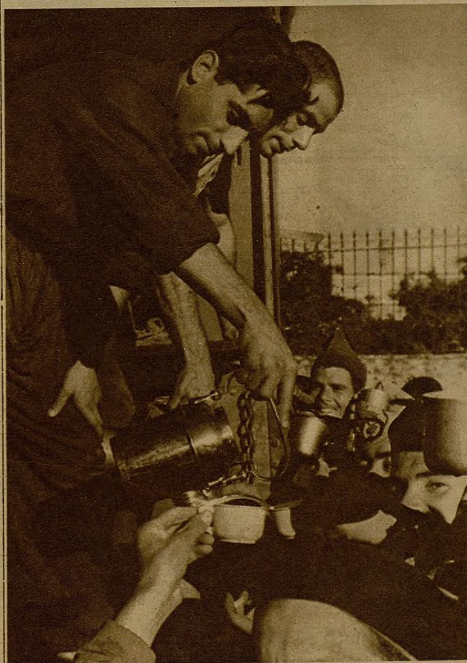
El Frente Popular se ocupa celosamente de que a nuestros soldados en campaña no les falte nada. Desde este camión "bar-café" se sirven tazas de sabroso moka a los soldados y milicianos