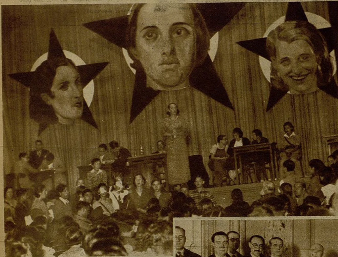
El Secretariado Femenino Nacional de las Juventudes Socialistas Unificadas ha celebrado un mitin, al que concurrieron numerosas afiliadas a la entidad. Tuvo lugar el acto en el Monumental Cinema, y en él tomó parte, con otras oradoras, la diputada Margarita Nelken, que pronunció un vibrante discurso. Véase la durante su intervención