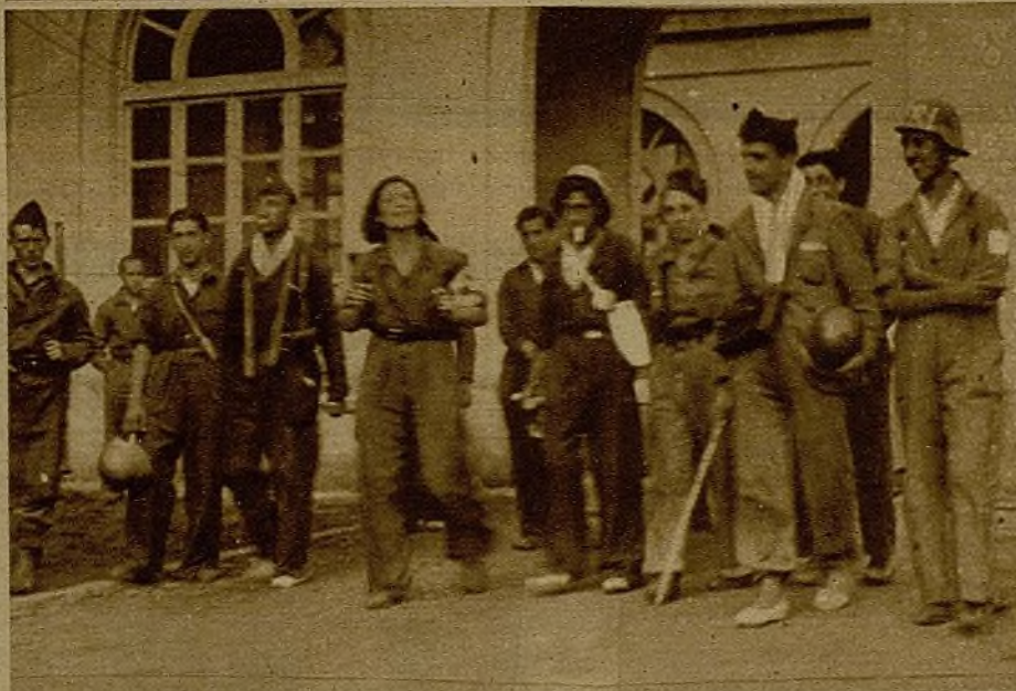
Mineros de Asturias convertidos en milicianos desde que se inició la guerra, en marcha para incorporarse a la línea de fuego

prismáticos pudimos ver cómo recogían hasta una docena de víctimas de nuestro cañoneo.