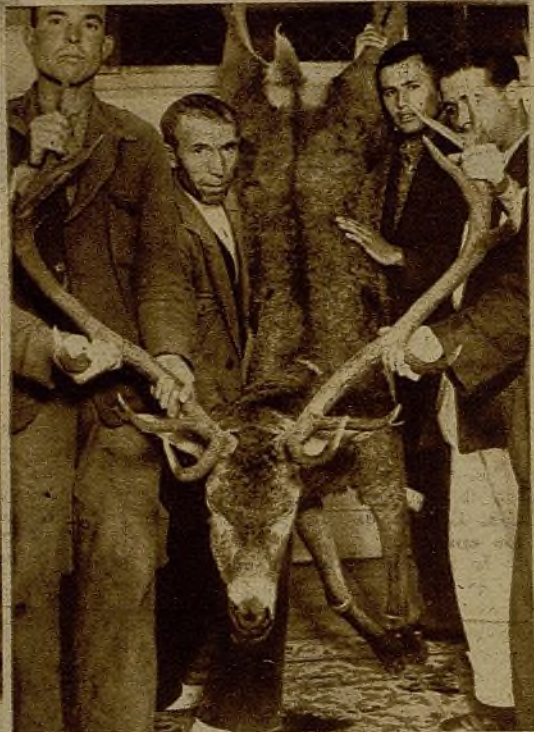
En terrenos de El Pardo fué cazado este ciervo, magnífico ejemplar de 150 kilos de peso, que ha sido enviado al Hospital de Sangre de San Carlos