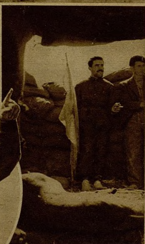
Un soldado muestra la bandera blanca que hicieron ondear los rebeldes de Montearagón para hacer creer en su rendición, y que fué cogida por nuestras tropas en uno de los parapetos

espectros que saltando de risco en risco, arrojando armas, correaes, abandonando cañones y bagajes, trataban de buscar en la huida un camino de salvación, que no encontraron, para desgracia suya. Esta ha sido para el fascismo su gesta de ignominia en Montearagón.