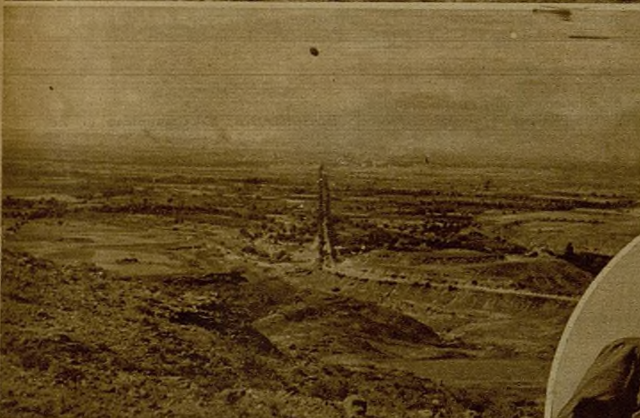
El castillo almenado de Montearagón

He estado contemplándolo dos días a un kilómetro escaso; junto a nuestras avanzadas se oía hablar a los rebeldes. "Están agonizando los dos reductos", decía yo en mi crónica anterior. Ya se derribaron los famosos puntos estratégicos de Montearagón y Estrechoquinto, únicos puntos de apoyo para sostenerse en Huesca las turbas del fascio. ¡Qué cruel defección habrá sufrido el ex general Cabanellas cuando se haya enterado de la toma de dichos lugares! No hace aún quince días afirmaba jactanciosamente: