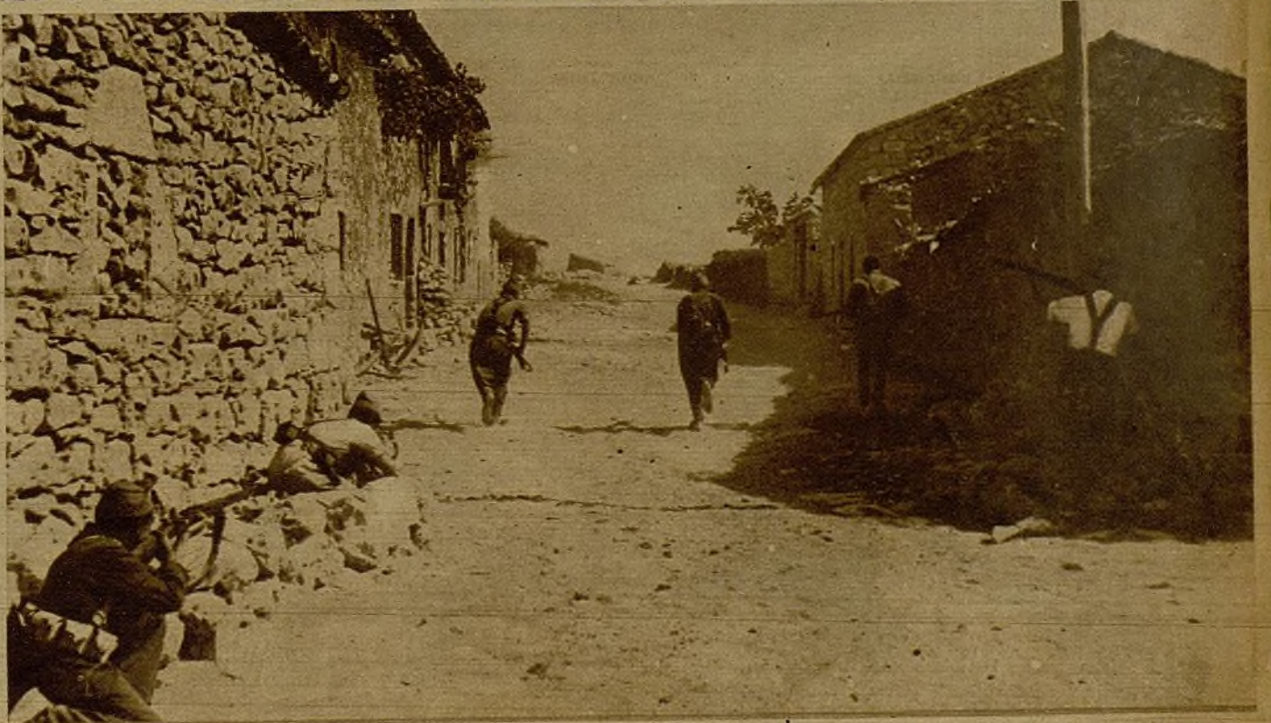
En el sector de Sigüenza, nuestras tropas no sólo han rechazado los ataques de los facciosos, sino que en violenta contraofensiva han logrado hacerles abandonar varios pueblos. Véase la entrada en uno de ellos de una guerrilla de vanguardia

Después de este día aún han seguido los vuelos, y con los vuelos los bombardeos. Ayer estuvo nublado, y por ello sólo pudo actuar la Artillería. Con los