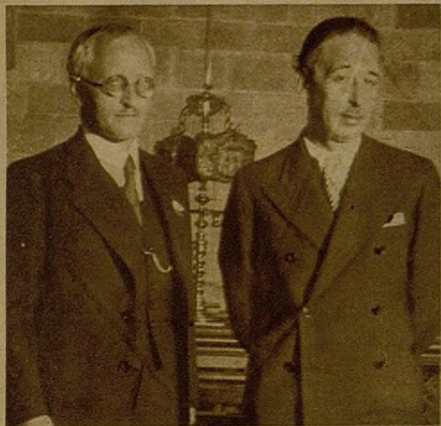
El cónsul de Rusia en Barcelona, Antonov Owseenko, con el presidente de la Generalidad, señor Companys, a quien visitó a su llegada a la capital de Cataluña