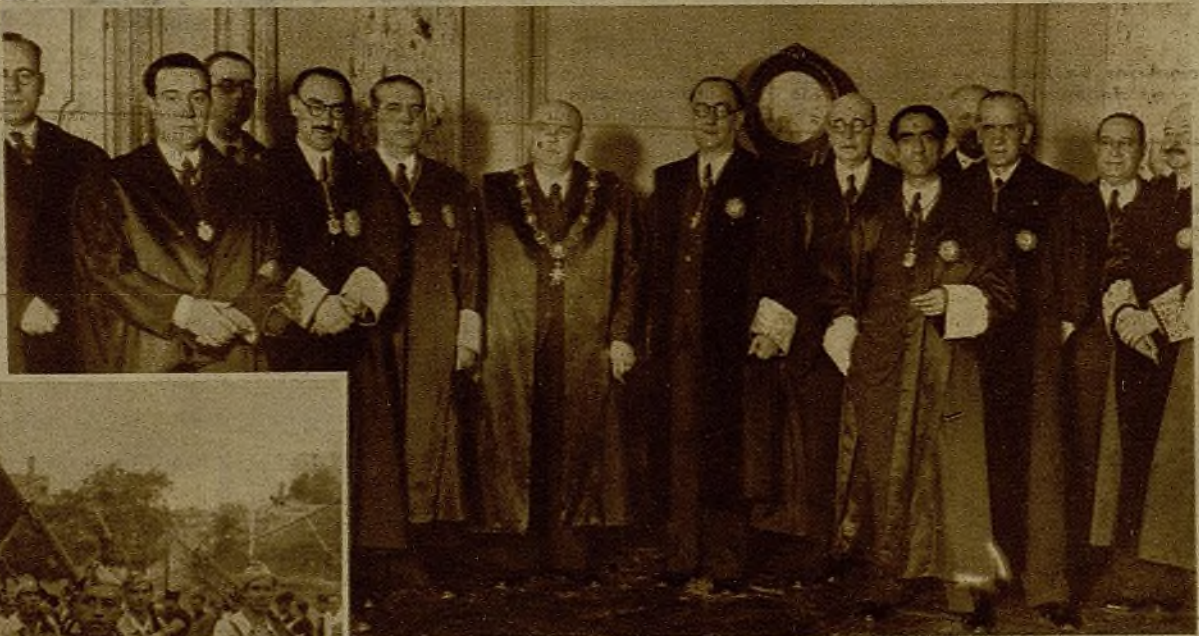
El desfile de milicianos que tuvo lugar el domingo en la Castellana fué presenciado por numeroso público, que saludó el paso de los bravos voluntarios con encendidos vitores y aplausos. He aquí el momento del paso de uno de los grupos