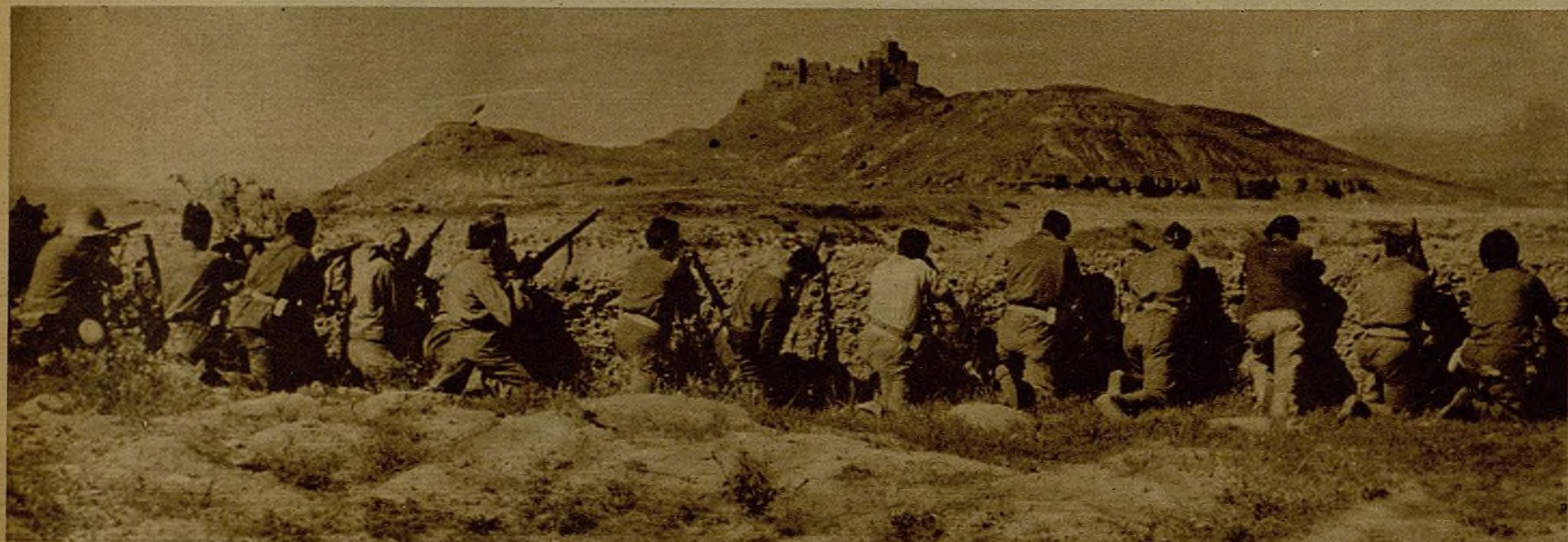
Milicianos en una trinchera disparando contra el enemigo antes de iniciarse el avance