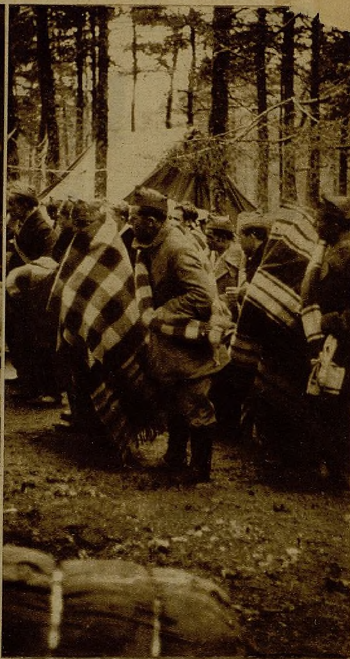
Envueltos en sus mantas, los combatientes salen para los puestos de las avanzadillas. ¡Hacen falta más prendas de abrigo para los luchadores!