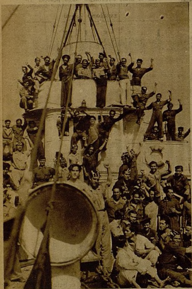
La tripulación de un cañonero, que desde el primer momento manifestó su fervor por la causa popular, saluda, al llegar a uno de nuestros puertos, a la multitud que la aclamaba