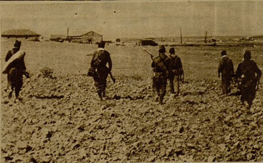
Un grupo de milicianos dirigiéndose hacia un pueblo del frente extremeño, del que habían sido ahuyentados los facciosos

Son estos delegados políticos—hombres seleccionados entre nosotros—los que por mil razones pueden atender a todo esto. Los militares harto tienen que hacer con desarrollar eficazmente su labor técnica y con dirigir a los hombres en el combate.