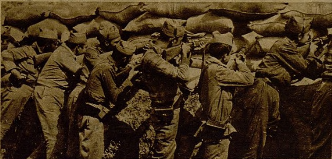
Un grupo de milicianos disparando por las troneras que dejan los huecos de sacos terreros