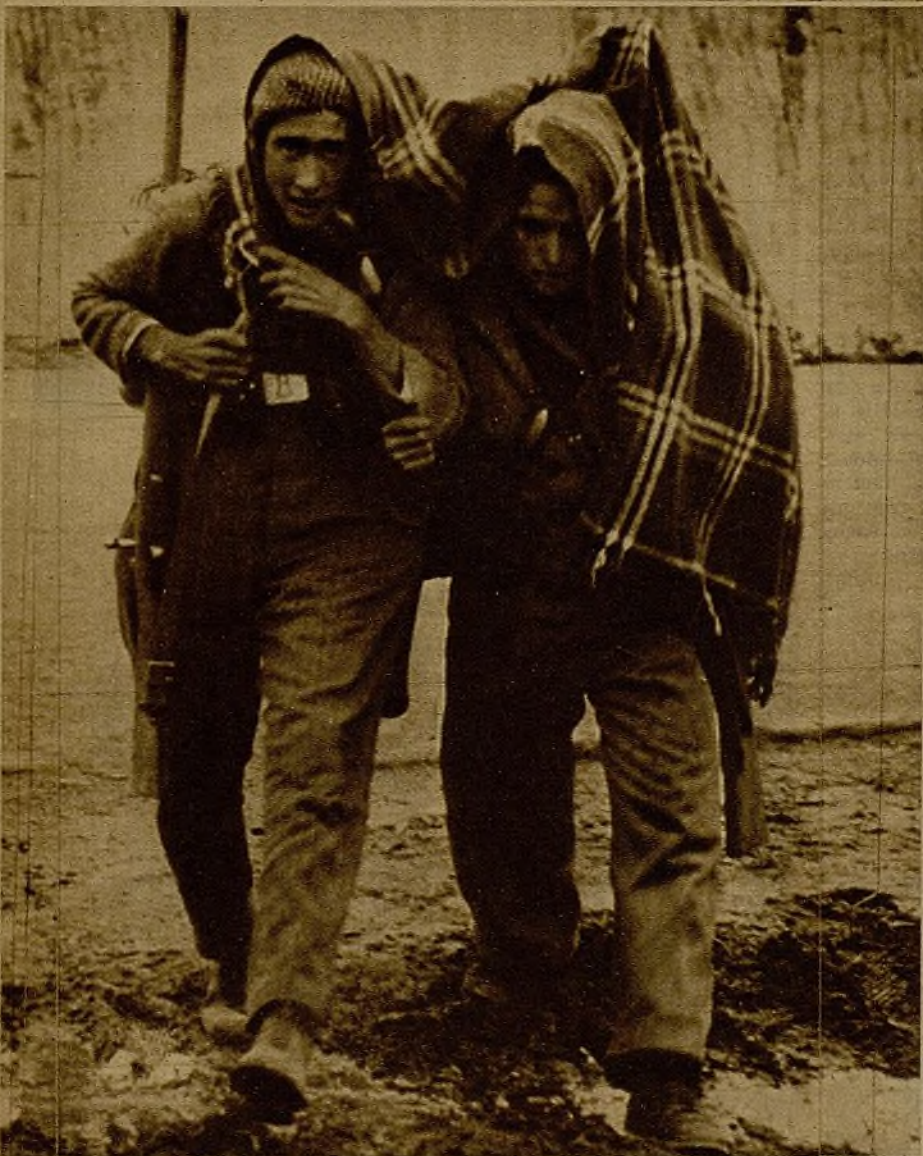
Llueve con gran intensidad en el frente de Extremadura. Estos dos milicianos marchan hacia sus puestos, protegiéndose del agua con una manta

El terraplén se ríe de los obuses que van a estallar en la era de enfrente. Pasa el silbido ogro y los hombres se aplastan contra el paredón de tierra. Hay guardias de Asalto, soldados del ejército voluntario y obreros de las Milicias. Zumba otra vez el viento herido y uno me dice: