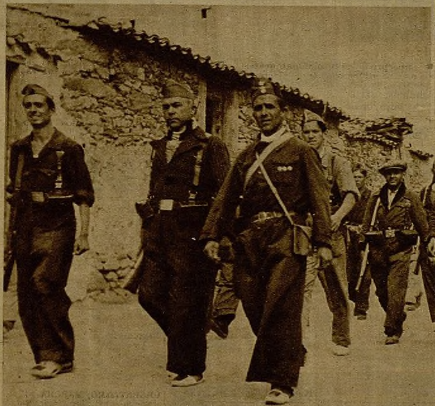
Un grupo de milicianos, que con singular arrojo se bate en la Sierra, saliendo de un pueblo para dirigirse a relevar a sus compañeros de las líneas avanzadas