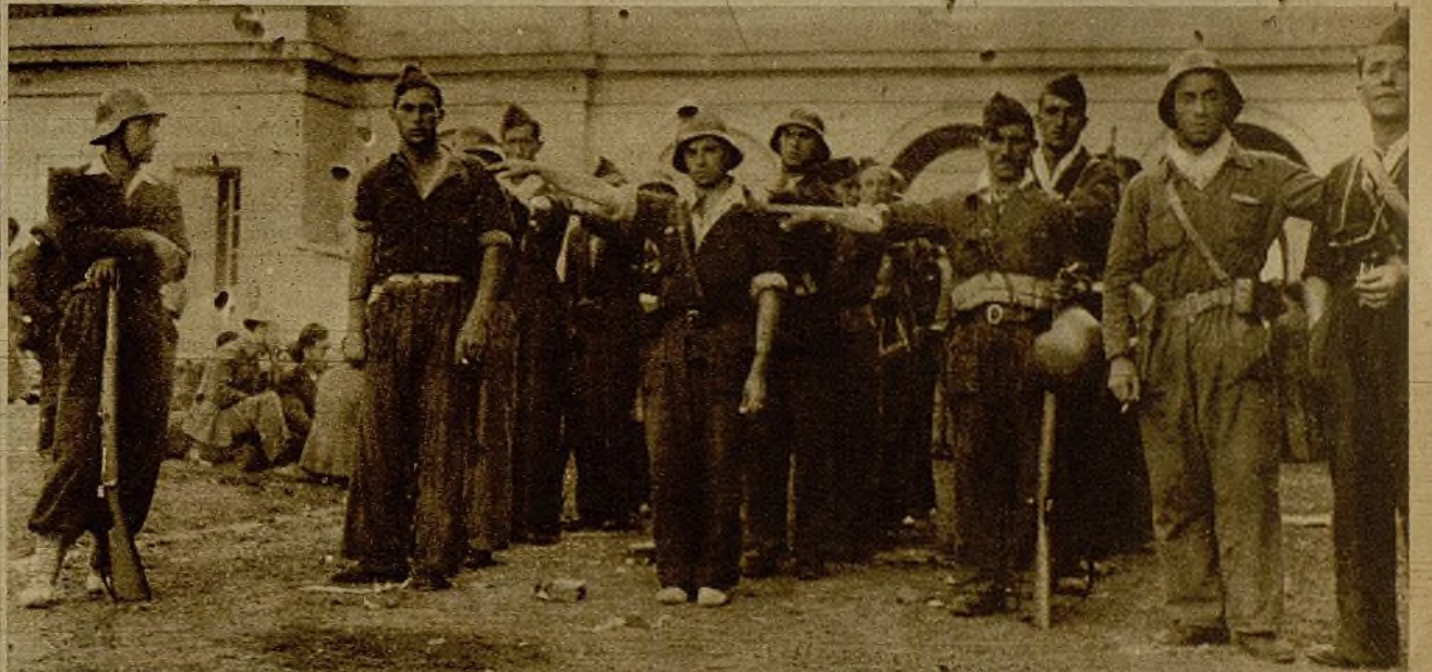
A las puertas de uno de los edificios tomado en las cercanías de la capital asturiana, los mineros, hoy disciplinados milicianos, se alinean en formación para marchar a las avanzadillas