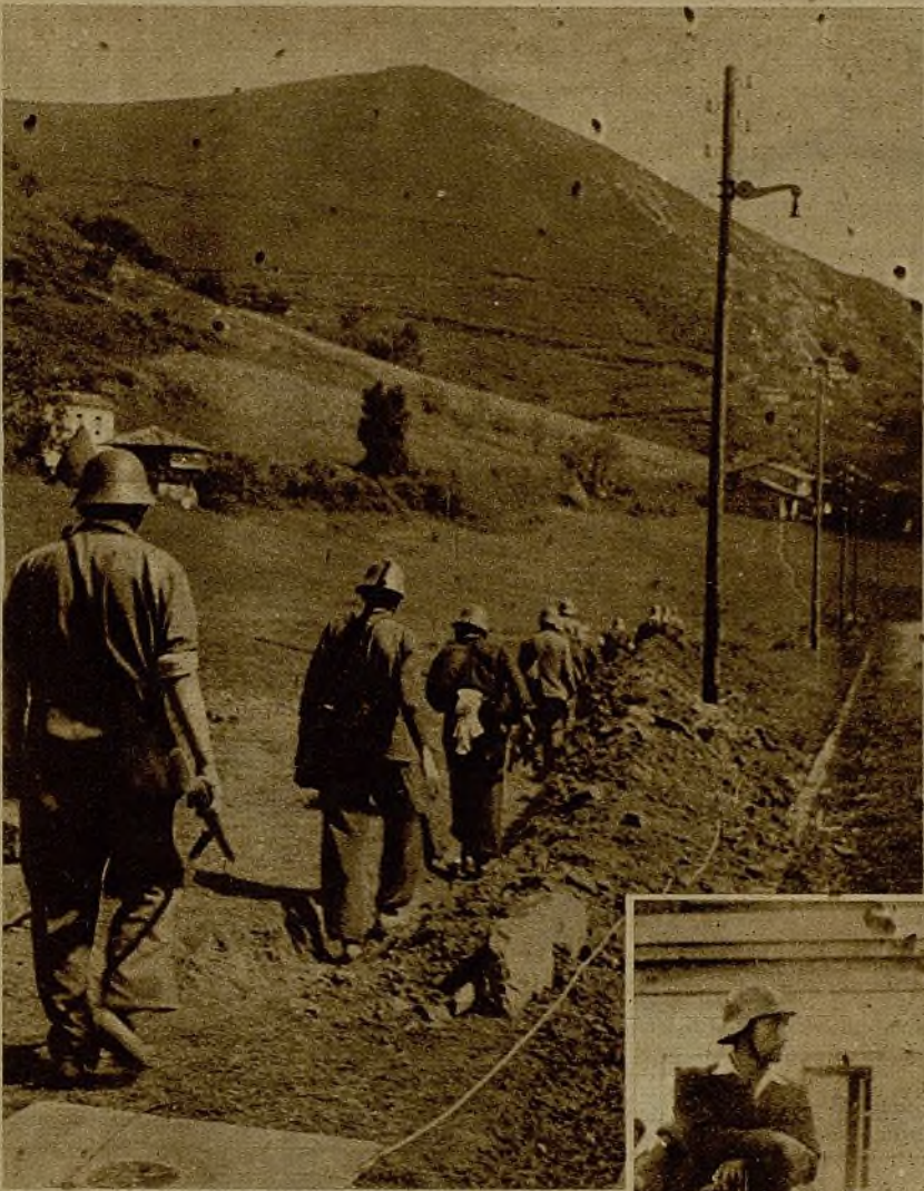
Soldados marchando por las estribaciones de los montes cercanos a Oviedo para emplazarse en una avanzadilla