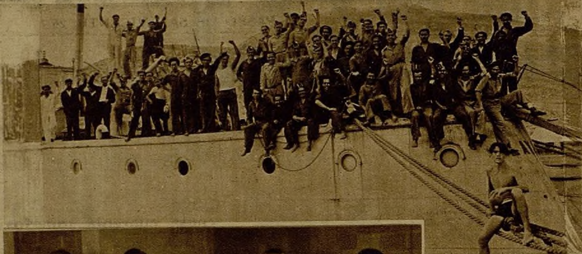
Otro grupo de tripulantes del cañonero correspondiendo al entusiasta recibimiento que se le dispensó. Este buque, que se hallaba en Huelva al producirse la rebelión fascista, fué tomado por la dotación que lo puso a las órdenes de la República