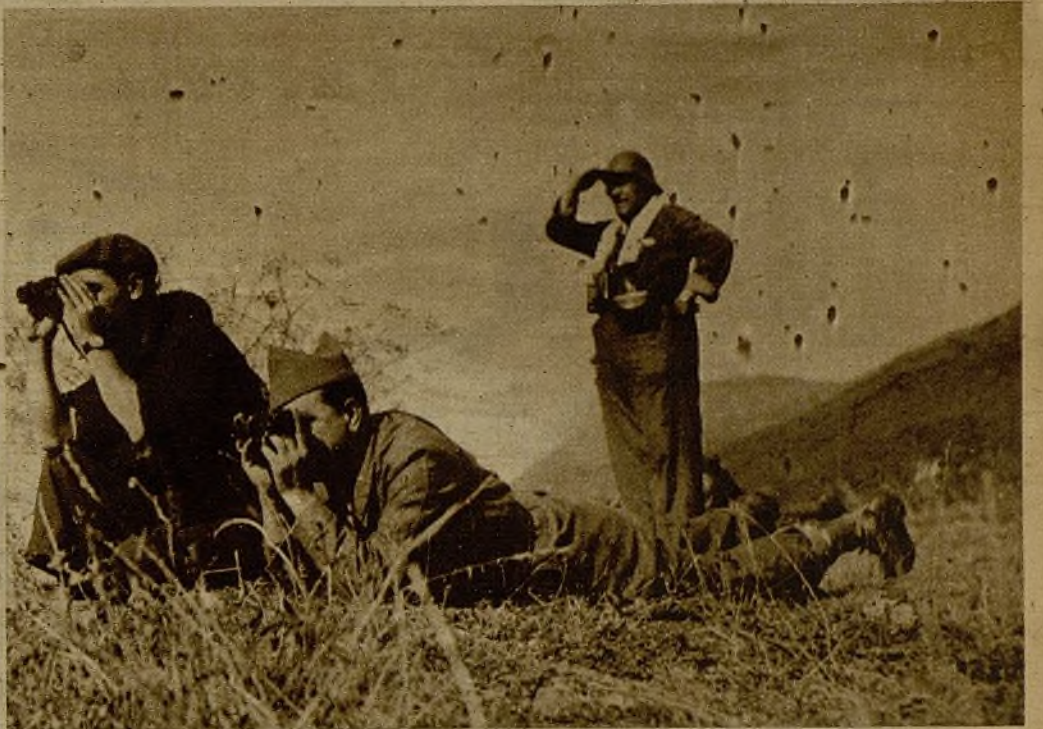
Un puesto de observación en las inmediaciones de la capital asturiana