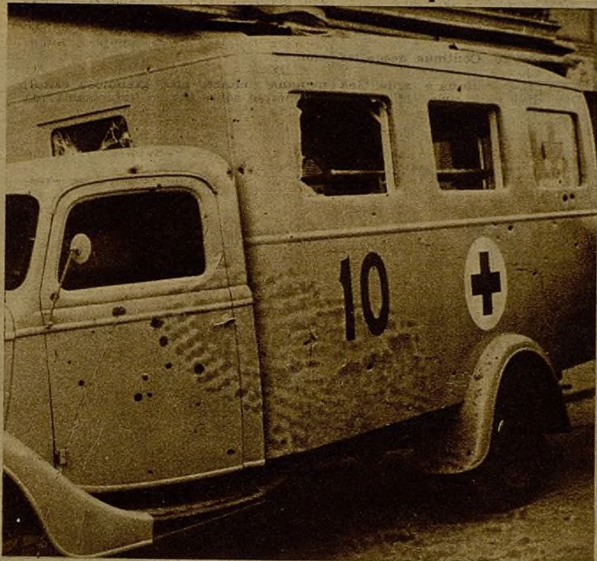
El salvajismo de los facciosos no respeta nada, ni aun el sagrado concepto de la Cruz Roja. Véase este coche para la conducción de heridos, cubierto de impactos