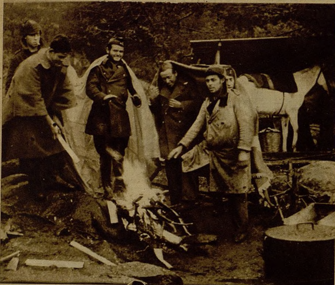
Nuestras tropas, que luchan valerosamente en la Sierra, se ven ahora acometidas por los rigores del frío. Nada de ello disminuye el tesón de la resistencia. He aquí a varios milicianos secando al calor de la hoguera sus mojadas ropas.