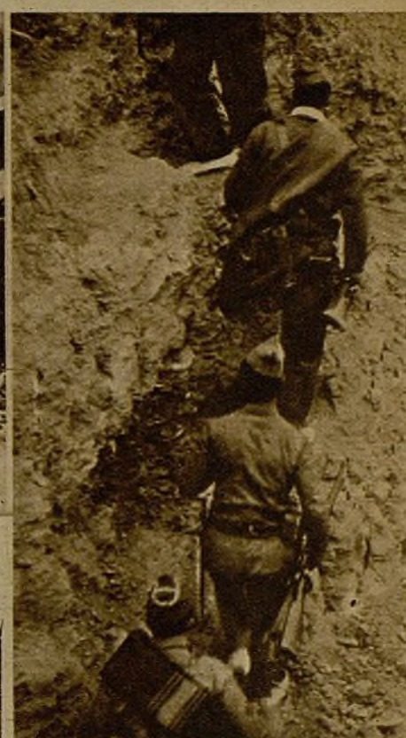
Soldados avanzando por un camino cubierto durante el desarrollo del combate, para sorprender a un grupo faccioso

—Cuando volvimos—cuenta uno de los voluntarios de Cuenca—se nos acercaron a decirnos que atrás quedaba un herido. Al saberlo, cogió el capitán y, con dos tenientes, se fué a buscarlo. Llegó hasta donde habíamos estado, y como no le dieron, volvió con el herido, que no podía andar. Se encaró con nosotros y empezó a darnos gritos porque nos le habíamos dejado allí. A este capitán un día nos le sacuden de firme porque le gusta mucho andar de pie de un lado para otro, y eso, ya se lo hemos dicho, le va a costar un hospital o algo peor.