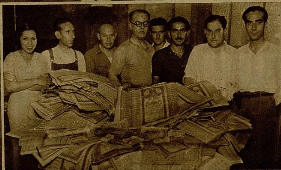
El papel de la Deuda que se hallaba oculto en la cámara secreta del Palacio Arzobispal de Valencia, y que fué hallado por la brigada de Investigación. Las láminas suponen una fabulosa suma