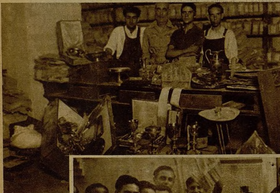
En virtud de confidencias recibidas por la Policía, varios agentes y milicianos de la brigada de Investigación de Valencia practicaron un registro en el Palacio Arzobispal, descubriendo una cámara secreta, en la que se habían ocultado preciadísimas joyas y papel del Estado en gran cuantía. En la foto se ven muchas de las alhajas y valiosos atributos de culto. También fué ocupada la mitra del arzobispo, valorada en varios millones