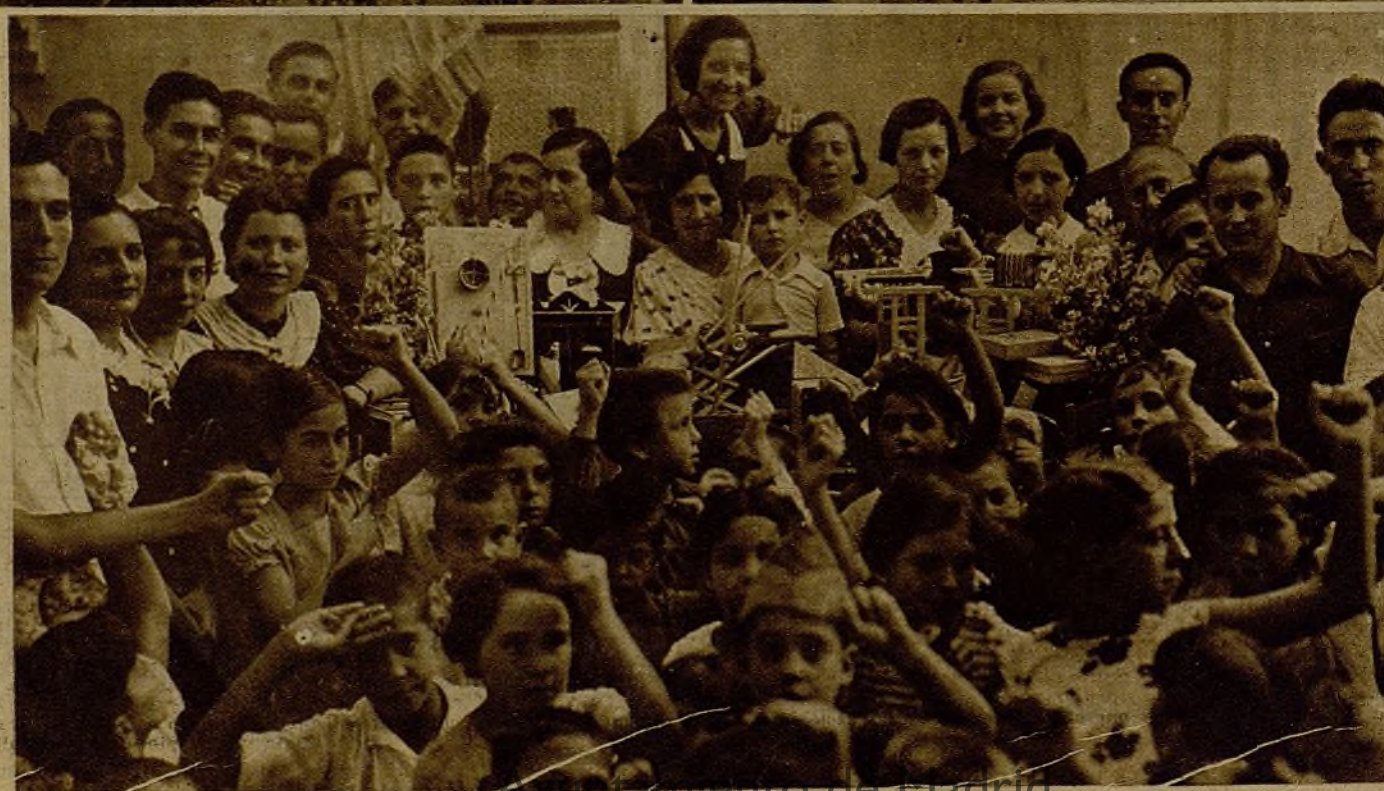
El Socorro Rojo Internacional, sección de Valencia, ha obsequiado con numerosos juguetes a los niños llegados de Madrid a la capital levantina. He aquí a los muchachos después del generoso reparto