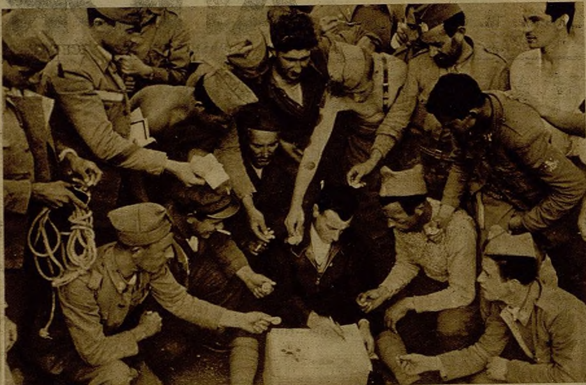
El encargado del coche de enlace entre las poblaciones y el frente es el amable cosario de los milicianos. Encargos, cartas, dinero para las familias...