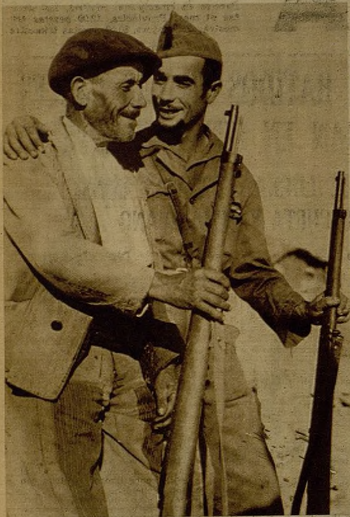
El viejo y el joven miliciano, símbolos de la general aspiración liberadora de los hombres de España, coinciden en un puesto de vigilancia.