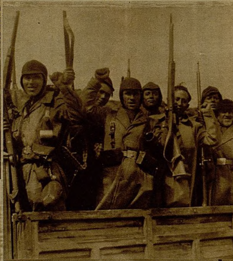
En la Sierra descien- de la temperatura, haciéndose sentir el frío intensamente. Los soldados han sido ya provistos del equipo de invierno. He aquí a un grupo de ellos, que a su paso en una camione- ta hacen el saludo a los compañeros de un control