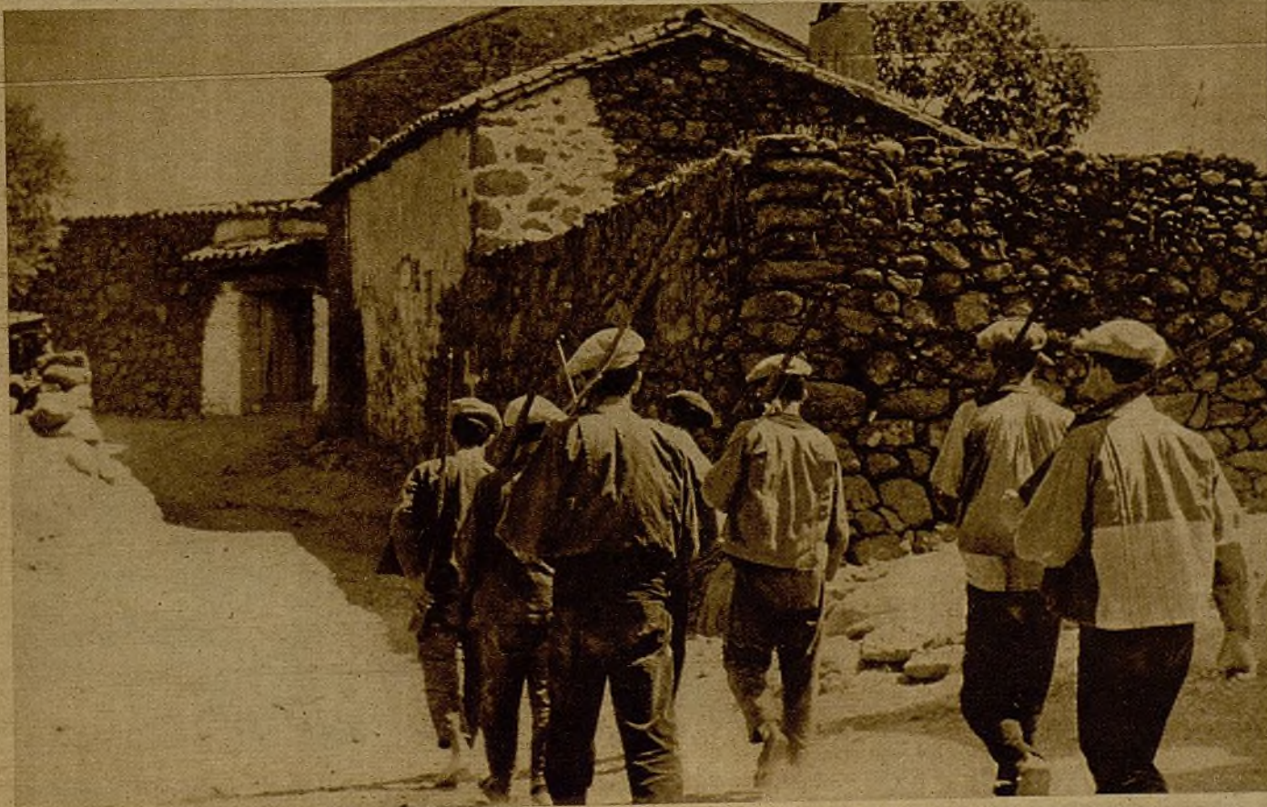
Los milicianos han hecho refugio de la pequeña casa abandonada