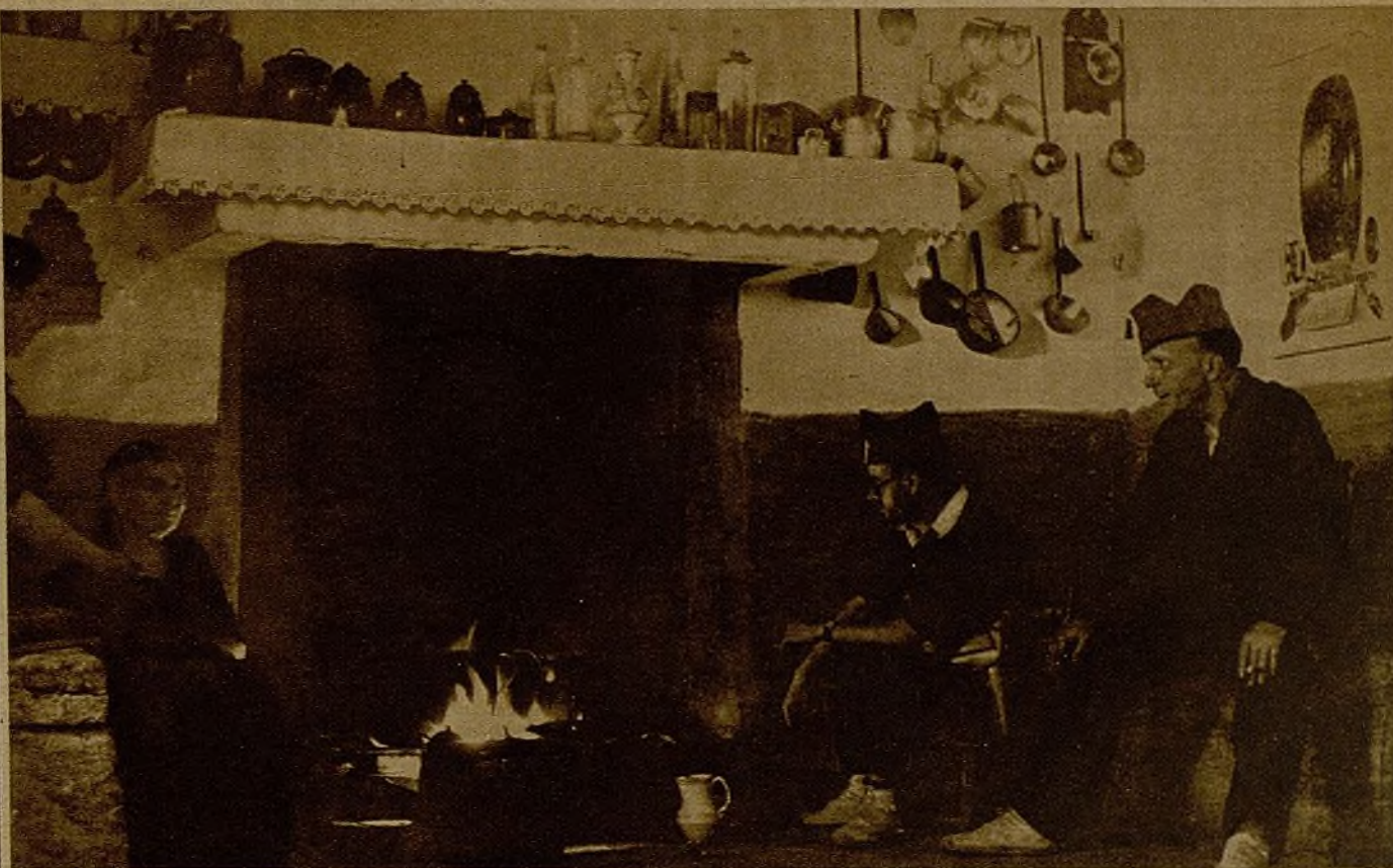
Al calor del hogar, amablemente acogidos por una familia partidaria de la causa popular, estos milicianos descansan durante momentos de tregua

¿De qué vivía aquella gente? Dicen por aquí que eran rentistas. Seguramente, claro está. Pero sería interesante conocer su vida, aunque su vida se cuente en una página, y saber si sus antepasados,