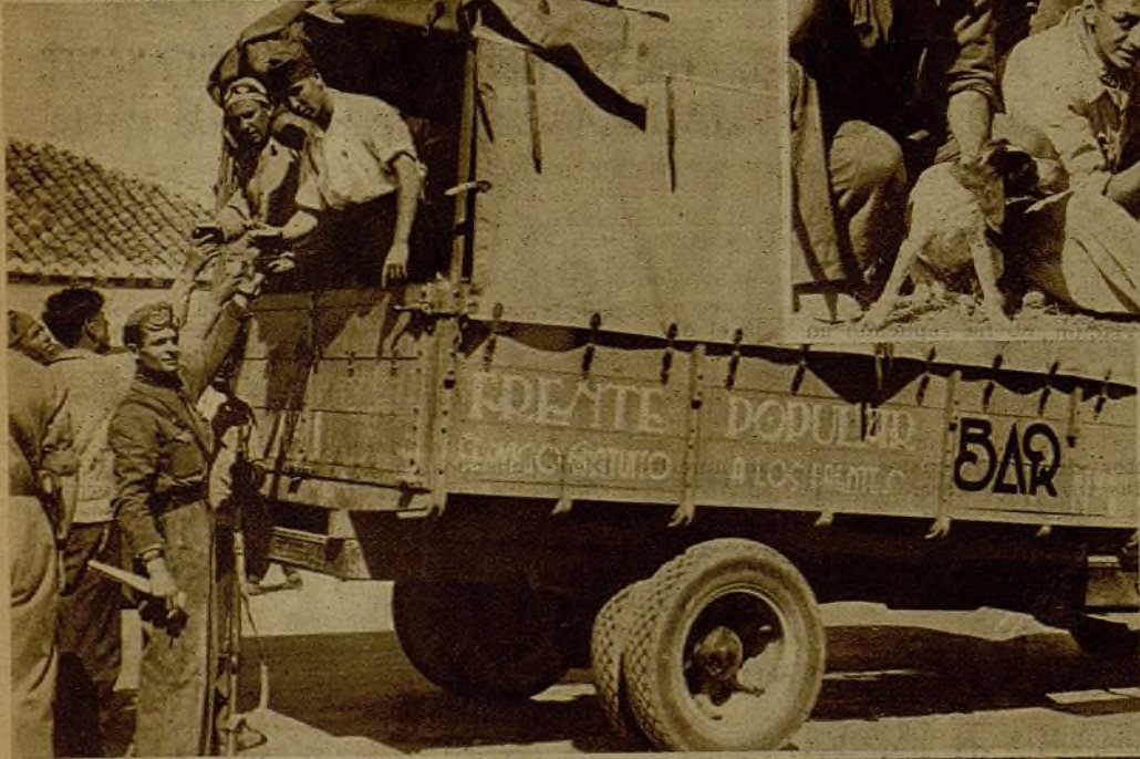
El bar gratuito que recorre todos los frentes para repartir refrescos entre los soldados es acogido siempre con la natural complacencia.