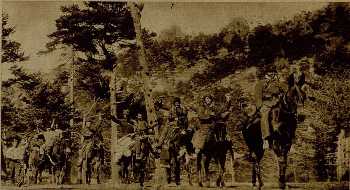
Equipados ya con sus mantas y pasamontañas estos milicianos regresan después de realizar una afortunada incursión, en la que causaron numerosas bajas al enemigo, en uno de los sectores de la Sierra