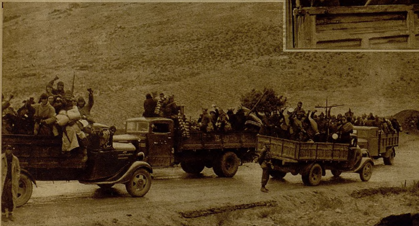
Fuerzas que mar- chan en opuestas di- recciones se encuen- tran y se comuni- can expresiva- mente su entu- siasmo