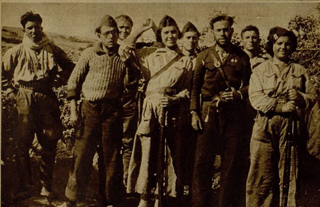
Milicianos, acompañados de un teniente, que formaron parte de las fuerzas que realizaron un afortunado avance y causaron a los rebeldes importantes bajas