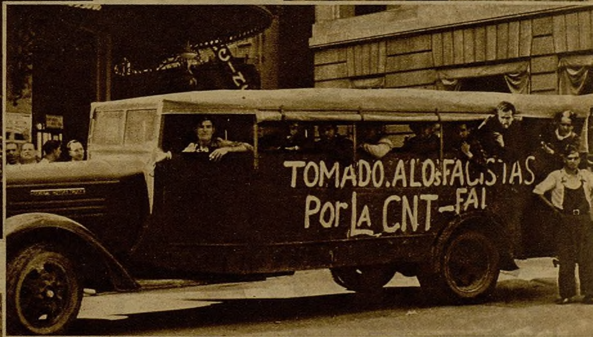
En una de las últimas acciones en el frente de Aragón nuestros milicianos coparon a una columna de guardias civiles facciosos, a los que tomaron este camión, que fué llevado a Valencia