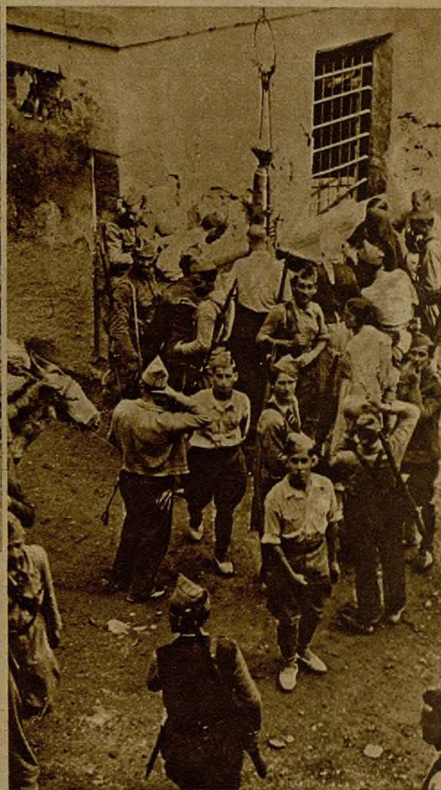
La llegada de un destacamento a uno de los pueblos reconquistados