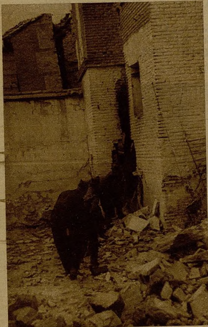
Milicianos adentrándose por el hueco de un muro semiderruido en la iglesia de un pueblo reconquistado en el sector del Tajo

A la puerta del Cuartel General llegó una bala perdida y mató a un guardia de Asalto. Estos azares tiene la guerra y a nadie debe extrañarle que una bala mate a un hombre. Aquí nadie se asombra, es la verdad, y quisiéramos que, como nosotros, todos se hicieran a esta idea de la guerra en la retaguardia.