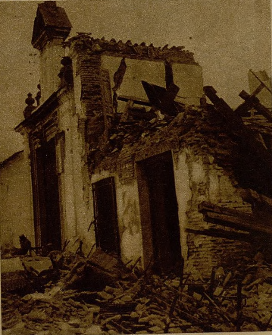
Restos de un caserío que hasta hace poco fué mansión de aristócratas, y en el que durante la ofensiva facciosa las bombas hundieron toda la construcción