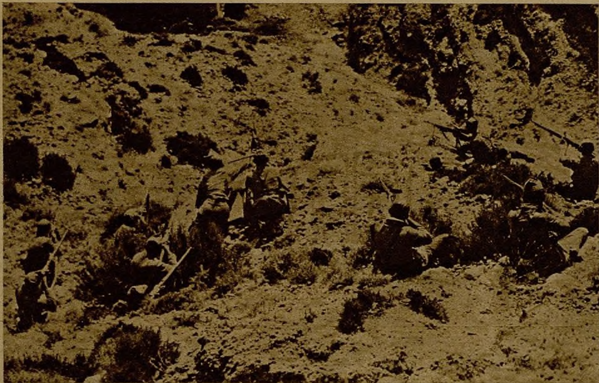
Guerrillas de milicianos en los alrededores de un poblado del sector de Aragón, amparados tras de una loma para sorprender el paso de una concentración rebelde fugitiva