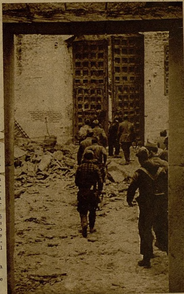
Un grupo de voluntarios después de haberse posesionado de un caserío en el pueblo tomado a los fascistas

—Mire, la Casa del Pueblo está sola. Los mozos se fueron y cerraron la puerta. Creen que con eso ya lo han hecho todo. Pero la Casa necesita un centinela y quiero serlo yo.