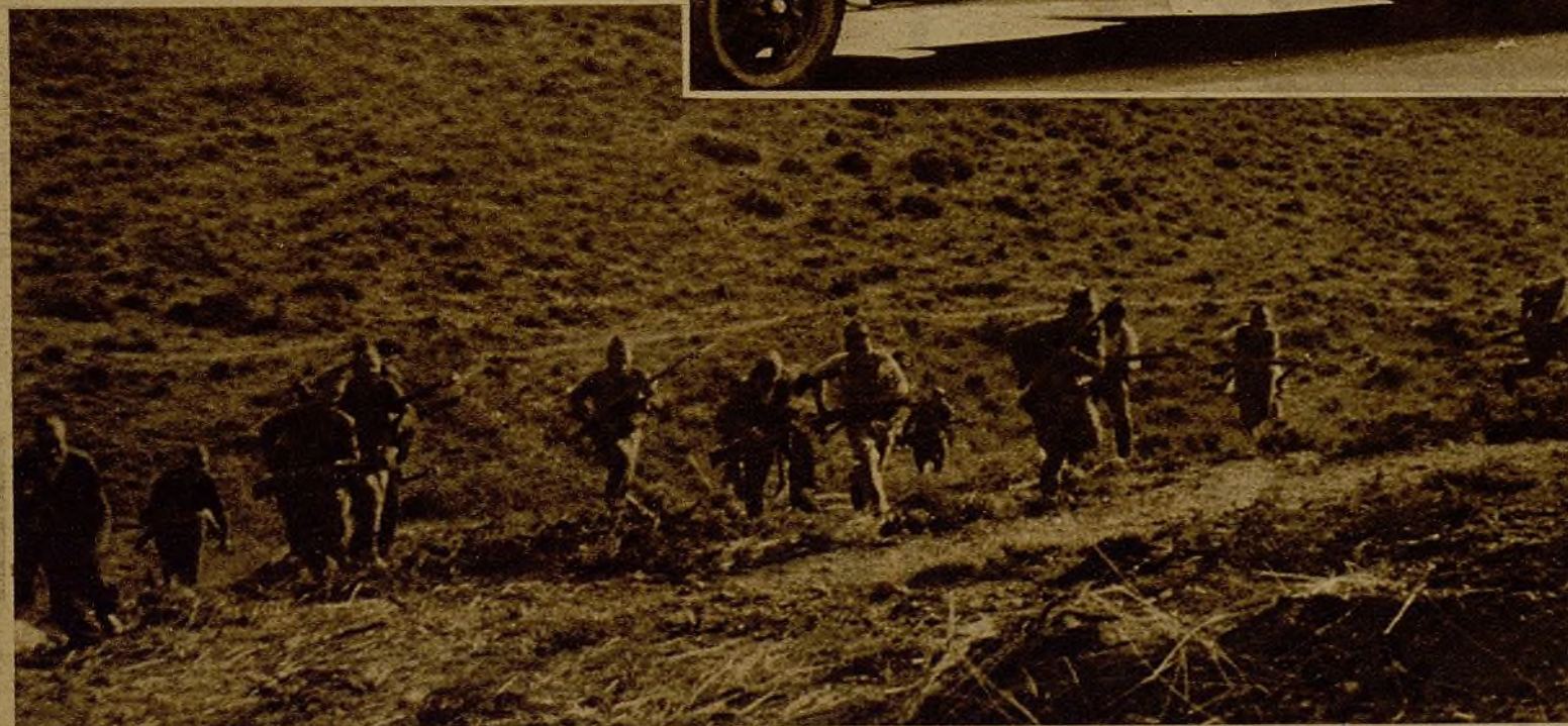
En el frente aragonés las lluvias son muy abundantes desde hace varios días, reblandeciendo el terreno y originando obstáculos para el avance. A pesar de ello el progreso de nuestras fuerzas hacia los objetivos señalados por el mando continúa sin interrupción. He aquí el momento en que una guerrilla se apresta a coronar una loma