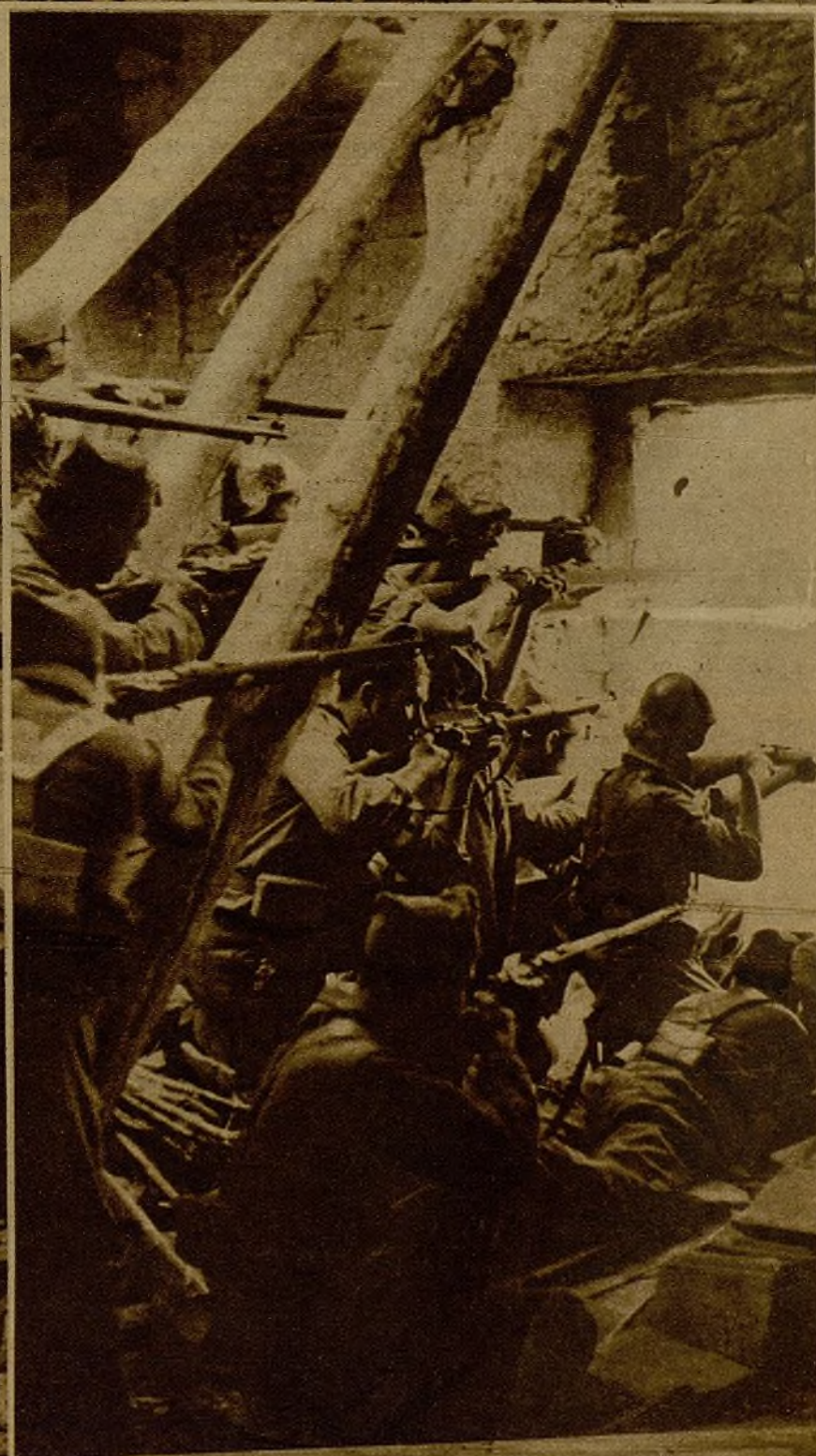
Entre las ruinas de las casas abandonadas por los facciosos los soldados leales encuentran convenientes lugares para disparar contra el enemigo, que se debatía aún en algunas calles del pueblo