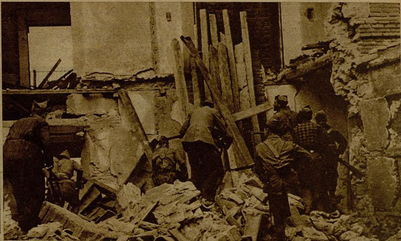
Soldados y milicianos entran en una casa de un pueblo del sector del Centro, que quedó casi totalmente reducida a escombros

Desde un boquete abierto en una casa los milicianos disparan contra otros edificios en que aún quedaban refugiados grupos de rebeldes