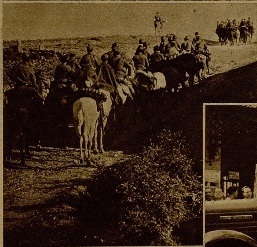
Una sección de Caballería marcha a uno de los puntos avanzados del frente para efectuar un ataque a los emplazamientos de los facciosos