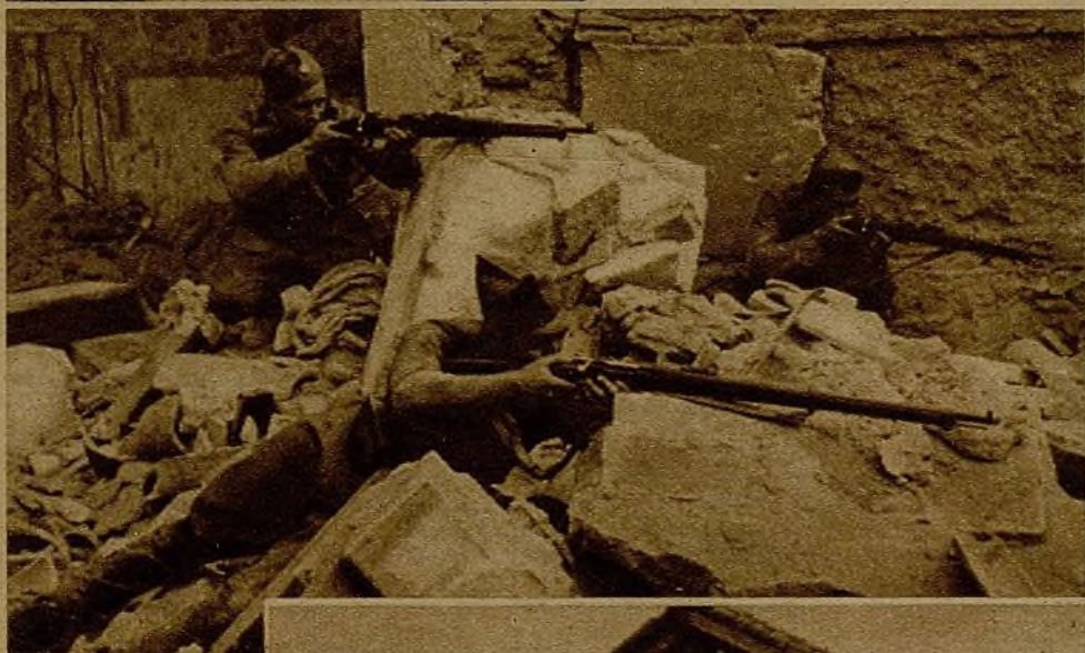
Los escombros de esta casa, que en la dura lucha sostenida contra los fascistas fué demolida, sirven de parapeto a los soldados leales, que persiguen con sus disparos a los rebeldes en fuga

Desde un boquete abierto en una casa los milicianos disparan contra otros edificios en que aún quedaban refugiados grupos de rebeldes