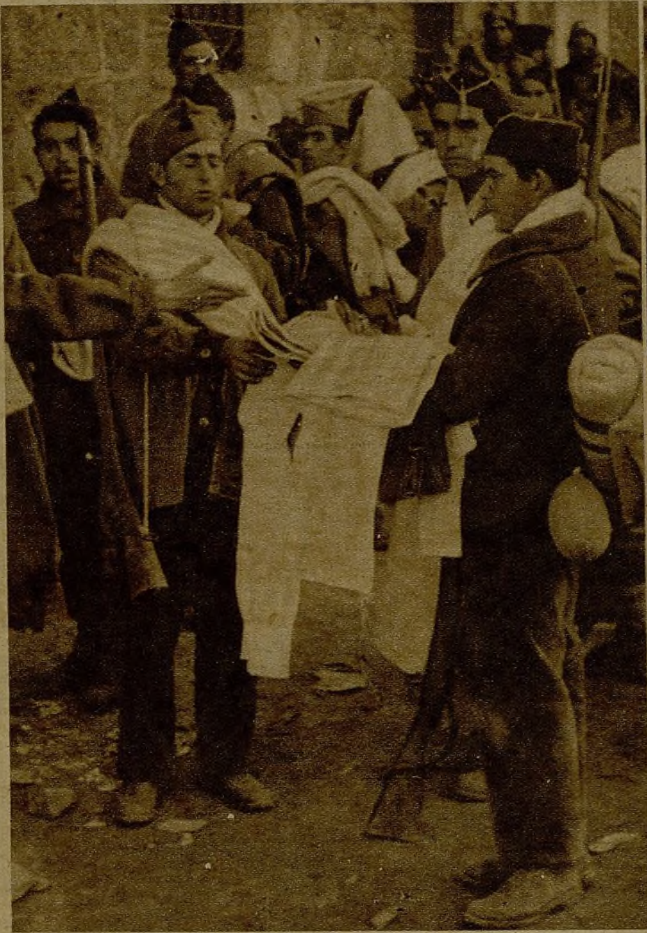
En los frentes se efectúa, profusa y activamente, el reparto de las prendas de abrigo que el Gobierno, entidades y particulares envían para equipar convenientemente a los luchadores. Un momento de la distribución