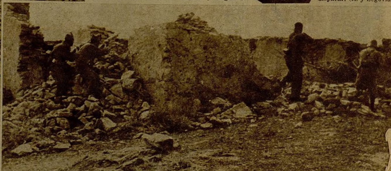
El campesino que defiende tenazmente el territorio donde se desarrollara su vida de trabajador y el joven miliciano graduado observan, vigilantes desde su atalaya, esperando el momento de disparar. (A. y Segovia)