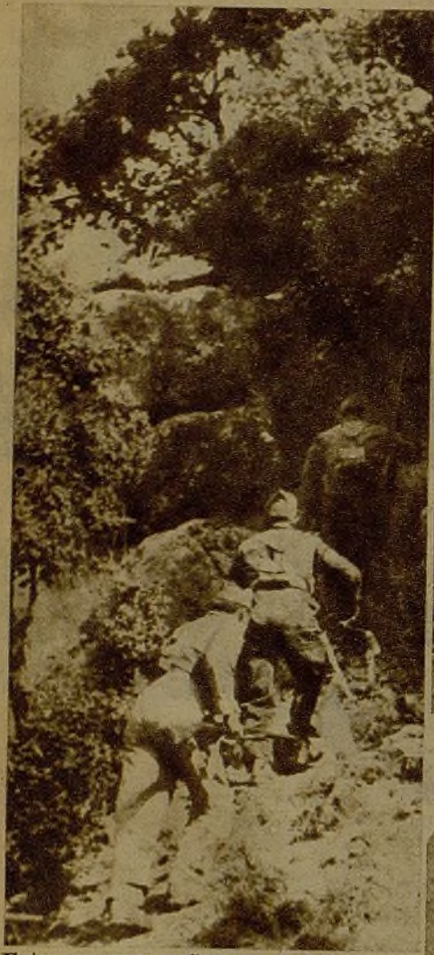
Entre enormes peñascos, en los abruptos terrenos de la Sierra, milicianos de la vanguardia avanzan para situarse en ventajosas posiciones de observación, dominando las líneas enemigas