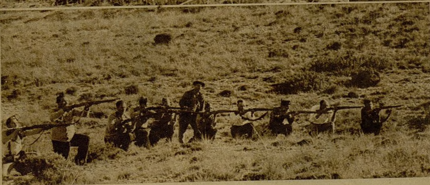
Otro grupo de voluntarios durante la lucha en las líneas avanzadas del frente de Teruel, donde nuestras tropas realizan constantes avances, venciendo la dura resistencia del enemigo