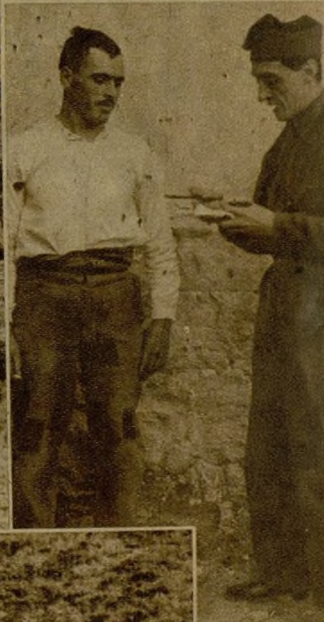
Un campesino de uno de los pueblecitos del sector de Aragón, que fué ocupado en los primeros momentos por los facciosos y que logró huir cuando le llevaban a las afueras para fusilarlo relata su odisea a un responsable de las Milicias y le da importantes informes