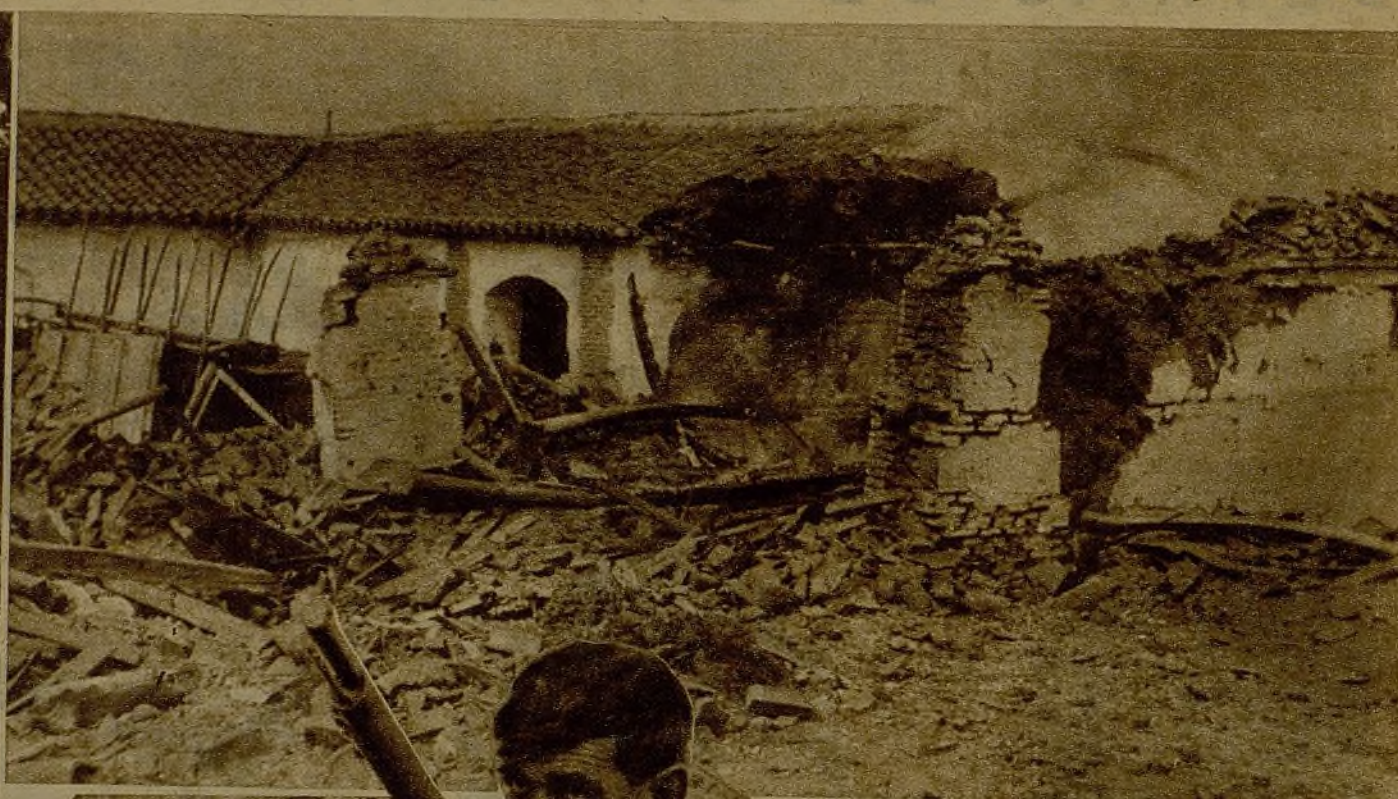
Las tropas facciosas en su huida hacen volar las casas de los campesinos en los pueblos que abandonan, dejándolas convertidas en montones de escombros. He aquí la vista de un grupo de modestas viviendas tal como las hallaron nuestros soldados al entrar en una aldea de la que nuestros fuegos habían ahuyentado a los fascistas