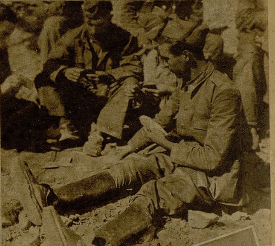
Bajo la grata caricia del sol estos milicianos entretienen la tregua con una partida de tute, en la línea de retaguardia.