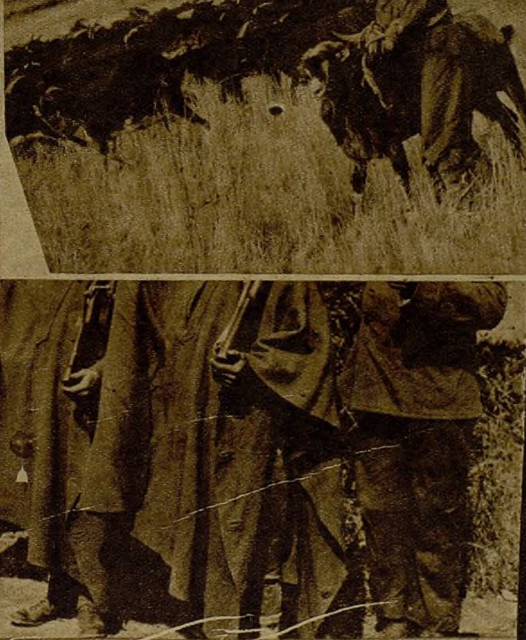
Nuestras patrullas de las líneas avanzadas realizan con gran frecuencia incursiones para sorprender al enemigo y apoderarse de su ganado. La bravura y empuje con que soldados y milicianos efectúan los súbitos ataques, dan casi siempre cuantioso fruto, y los rebaños son llevados a la retaguardia, desde donde se provee a la alimentación de las tropas. He aquí una piara que se cogió al enemigo en el frente