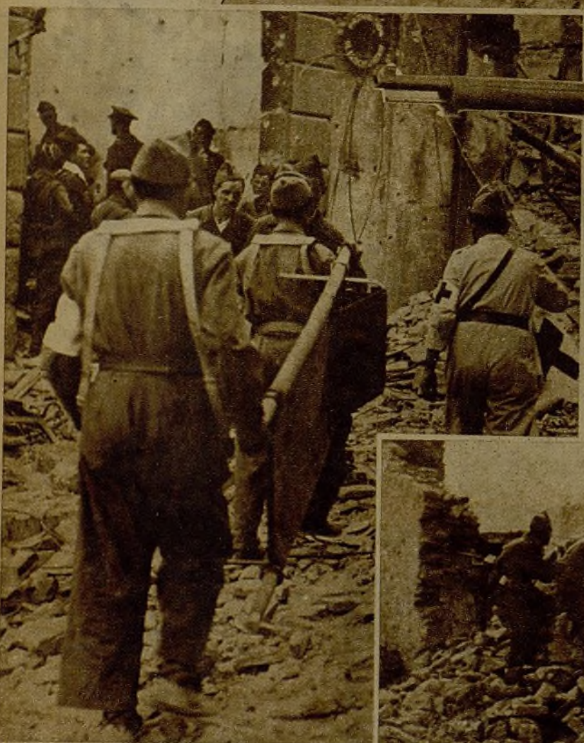
Desde los muros derruidos de los caseríos inmediatos a un pueblo, soldados y milicianos hacen intenso fuego contra el enemigo, que se defendía desde las viviendas, para hacerles abandonar sus posiciones