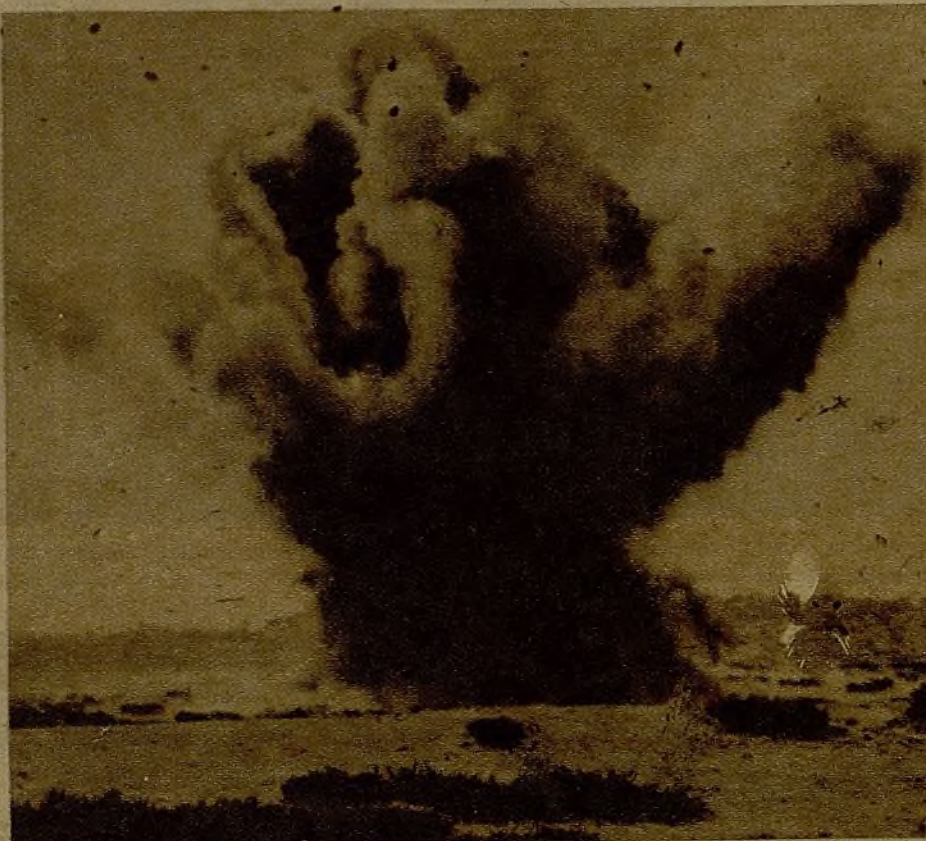
Efecto de una bomba de Aviación descargada por un aparato leal en las posiciones enemigas. La fotografía está obtenida con teleobjetivo

Sobre el terreno comprobamos la advertencia. Estos días la Aviación enemiga ha batido de firme en Estrechoquinto y Montearagón. Aspiraba a reconquistar lo que perdieron. Pues bien, ni una sola baja ha habido que apuntar por este motivo.