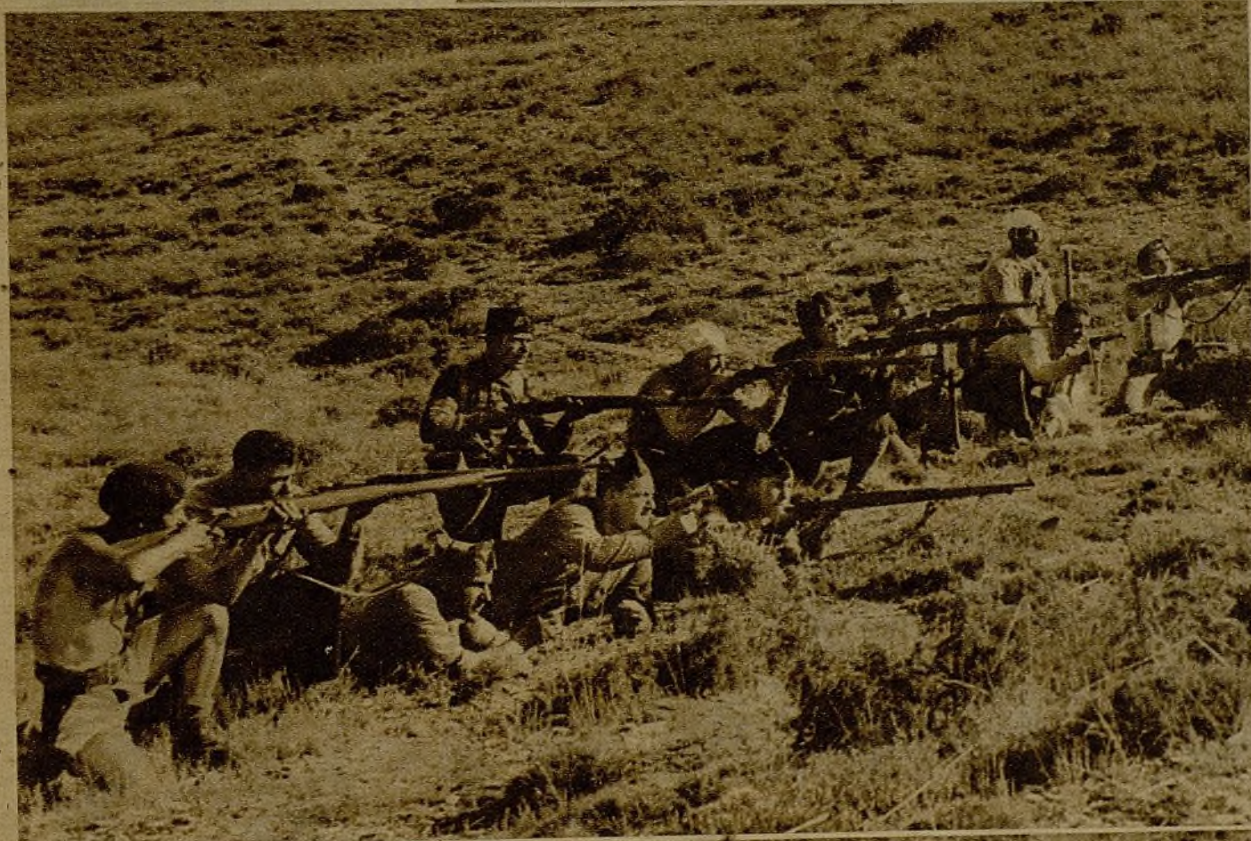
Un grupo de las avanzadillas, en el sector aragonés, persigue con sus tiros al enemigo en retirada y va adelantando metódicamente para establecerse en las posiciones que los rebeldes abandonan