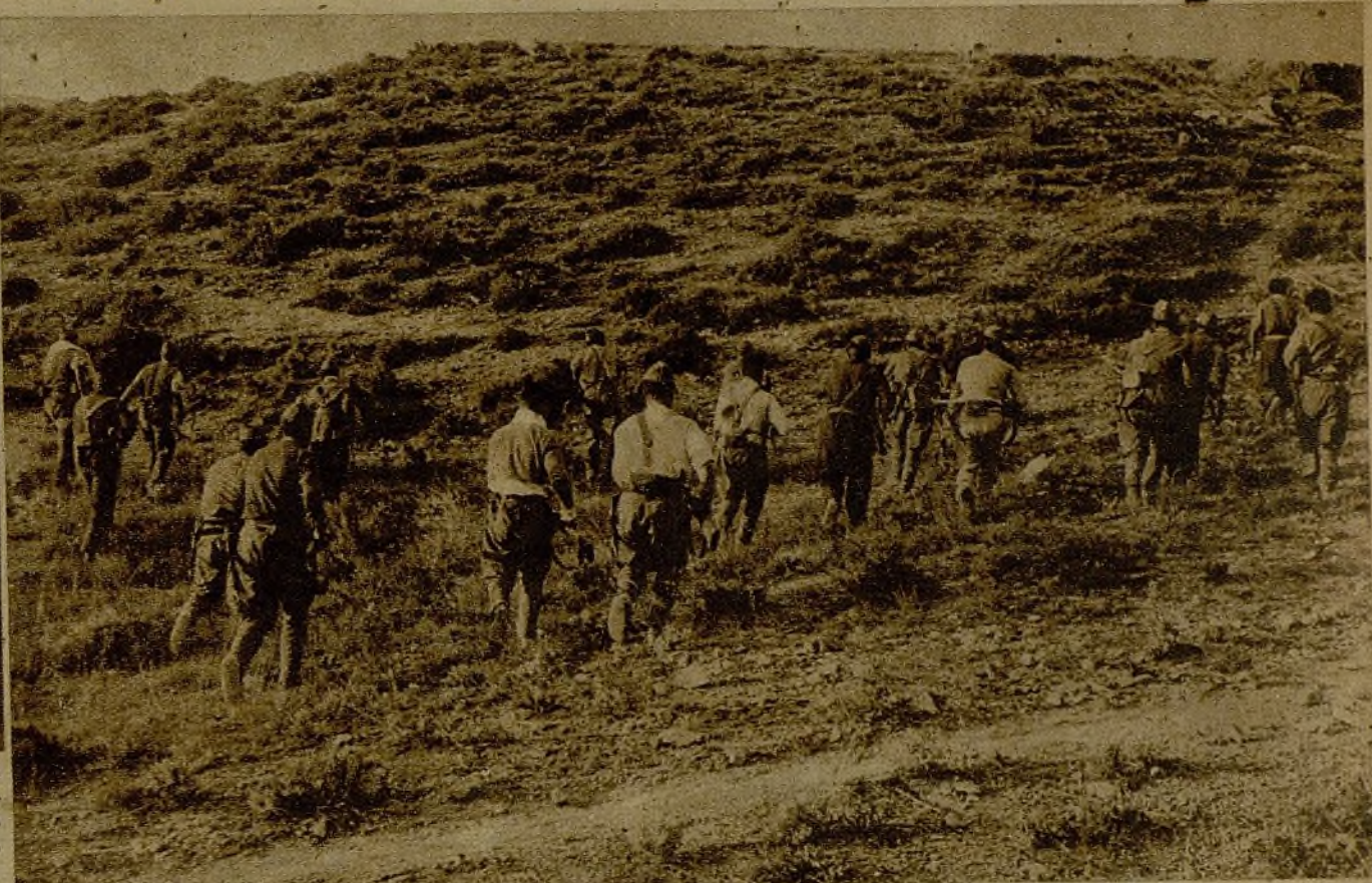
En la cumbre de esta loma se hallaban emplazados los primeros parapetos de los facciosos. Nuestros milicianos, después de una nutrida y eficaz preparación artillera marchan a ocupar las posiciones que los rebeldes se vieron precisados a abandonar