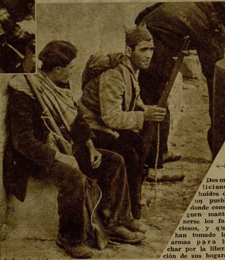
Dos milicianos huidos de un pueblo donde consiguen mantenerse los facciosos, y que han tomado las armas para luchar por la liberación de sus hogares