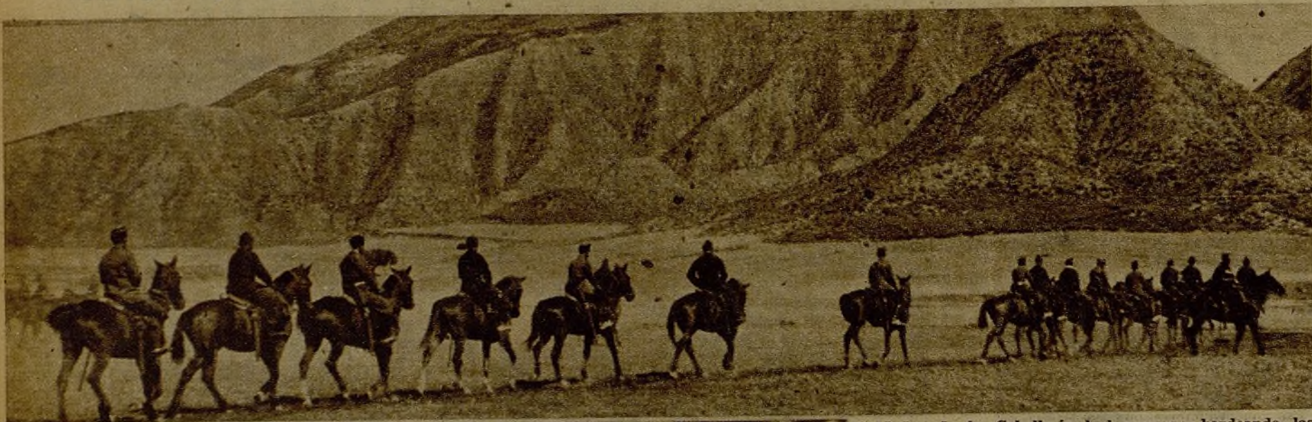
Soldados de la Caballería leal avanzan bordeando las montañas, para sorprender por la espalda a una concentración facciosa que obstaculizaba el avance de nuestra Infantería