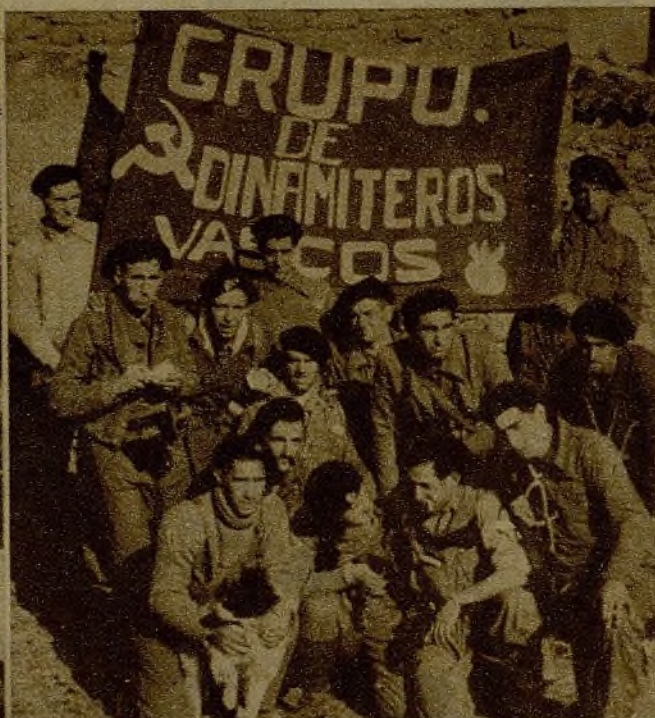
Dinamiteros vascos, que en el sector del Centro han tenido eficacísimas y bravas actuaciones, coadyuvando enérgicamente al avance de nuestras tropas