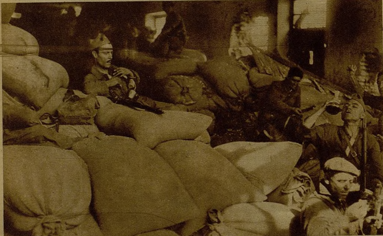
En uno de los pueblos conquistados recientemente por las tropas republicanas fué cogida a los rebeldes importante cantidad de víveres, que aparecen en la foto