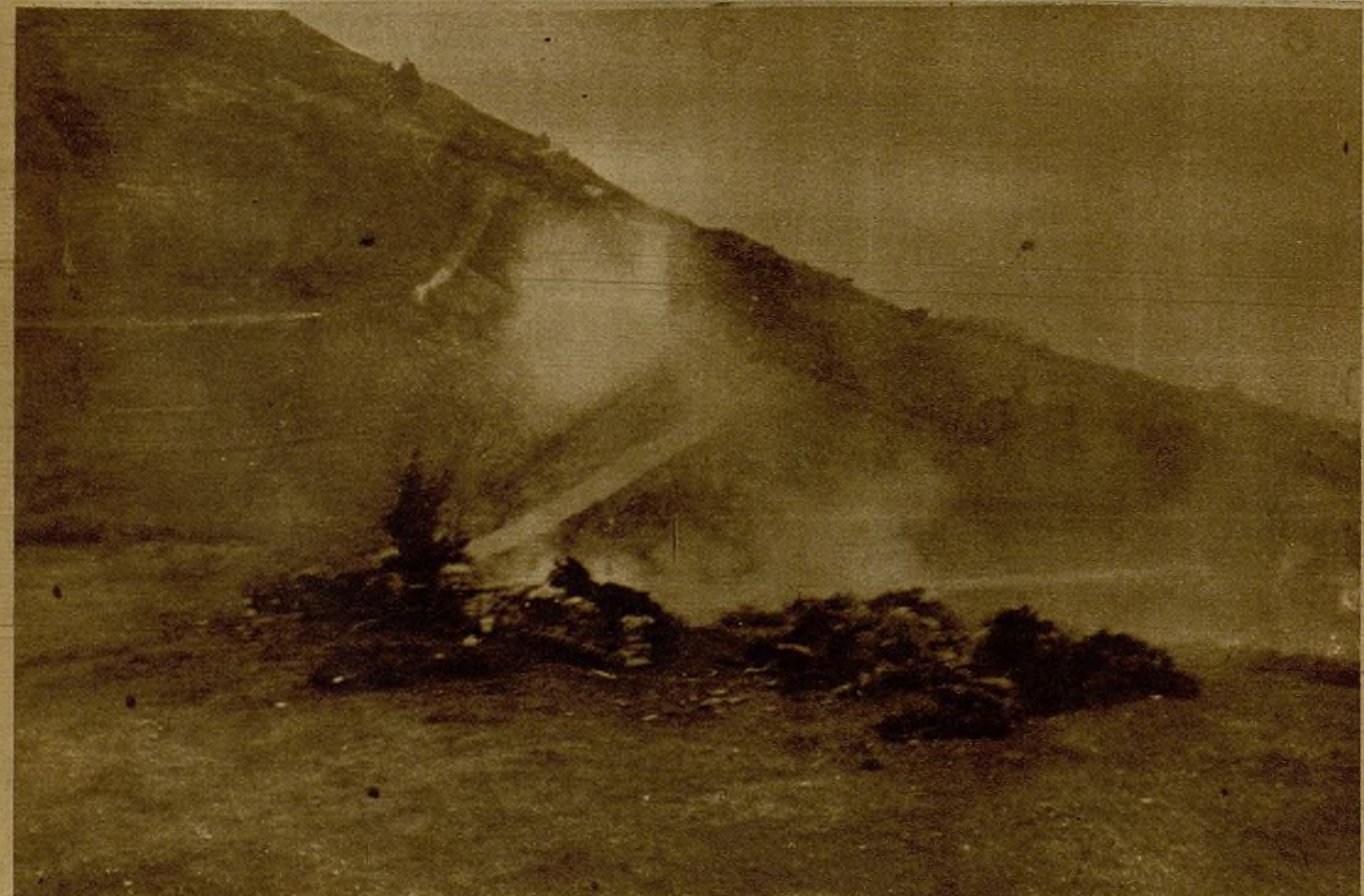
En lo alto del Naranco, nuestras baterías, localizadas por los rebeldes, que las bombardearon intensa e infructuosamente, prosiguen implacablemente apoyando el avance de los mineros con sus certeros disparos