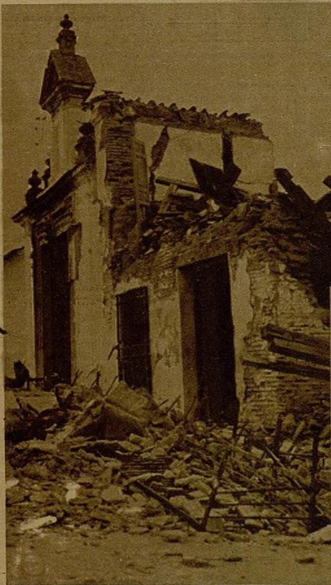
Cascotes, arrancados de los muros por la metralla, levantaban barricadas informes...