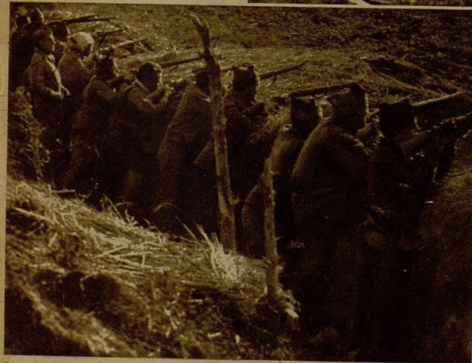
Las avanzadas de la columna batiendo con fuego de fusilería las posiciones de los rebeldes

A lo lejos se percibe el rugir de los cañones leales, que saludan a los rebeldes de Quinto con preparaciones artilleras de una duración que no baja de dos horas cada día. Vamos bordeando la ribera gris del famoso Ebro... Línea divisoria del fervor republicano y de la amalgama fascista. Hemos de atravesar el ya famoso recodo de las tragedias donde no pocos leales de la democracia cayeron bajo el plomo de la traición rebelde. El coche, al entrar en la zona peligrosa, pega un respingo, como consciente de su responsabilidad; se embala el motor con roncitos quejidos, y el vehículo, a más de ciento veinte kilómetros por hora, inicia una carrera desenfundada para salvar esa legua de la muerte. Las ametralladoras fascistas señalan nuestra ruta. Inician su ronco tableteo; pero el auto-