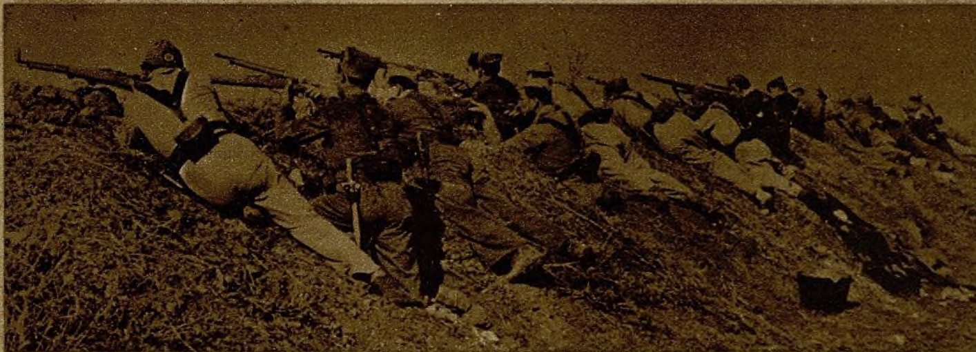
En los diversos sectores del frente del Tajo continúan las tropas republicanas su firme avance. En la foto, una avanzadilla entra en combate con el enemigo, en tanto avanza el grueso de las fuerzas

Se baten los hombres en la línea de fuego con el pensamiento fijo en la línea que tienen detrás. La cuesta arriba de la guerra—curva que puede durar poco o mucho—ha clavado en la cabeza de nuestros combatientes un nombre: Madrid, que será intangible.