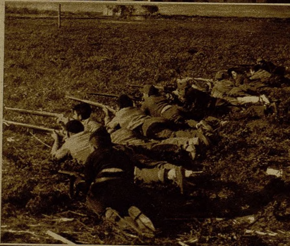
Esta patrulla de los "barbudos" ha conseguido ser la pesadilla de los fascistas del frente de Aragón

La guerra se ha tomado en este frente desde el primer momento con toda seriedad. Hace tiempo que en este cuartel general ni se sonríe ni se bromea... ¿Qué efectivos están diseminados por estos arenales de la provincia de Zaragoza?... Ni lo sé, ni aunque lo supiera haría mención de ellos en estas líneas. Son muchos miles de hombres. Hombres curtidos en todas las penalidades y en todos los sacrificios que trae una pelea sin cuartel y un clima más cruel y más inhumano que estos torrentes de metralla que nublan el sol y