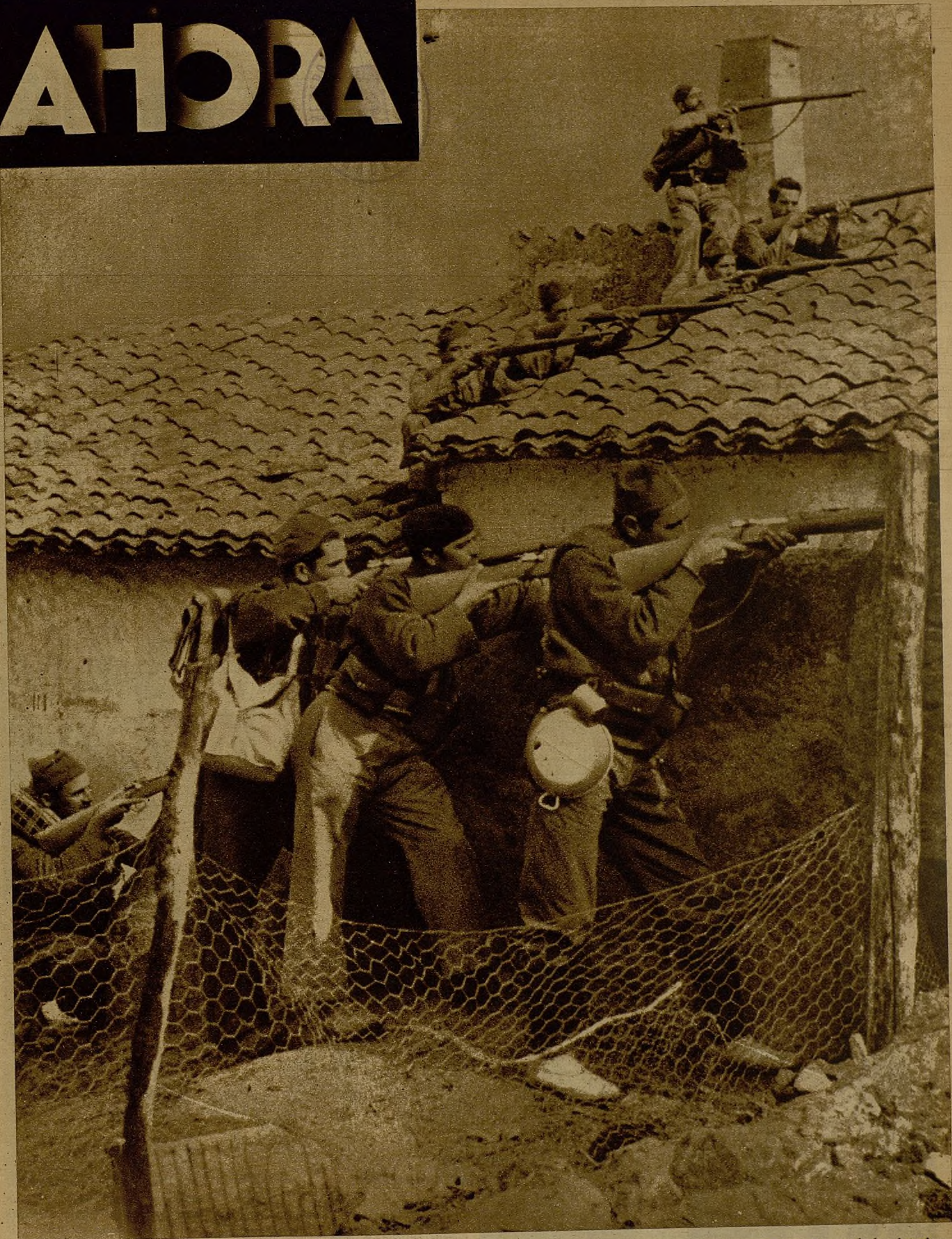
LA LUCHA EN LOS PUEBLOS DEL FRENTE DEL TAJO. —Después de la lucha en campo abierto—esfuerzo heroico en pos de la victoria—, las tropas republicanas toman por asalto un pequeño pueblo. La lucha se convierte en una trabajosa conquista del terreno palmo a palmo, casa a casa. Más tarde, lo que fué objetivo militar, ya logrado, se convertirá en parapeto