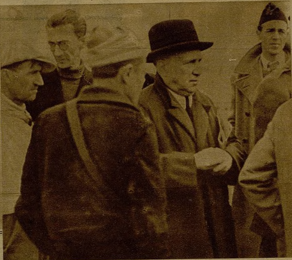
El jefe del Gobierno y ministro de la Guerra, señor Largo Caballero, durante una de sus constantes visitas a los frentes del Centro, rodeado de milicianos y soldados