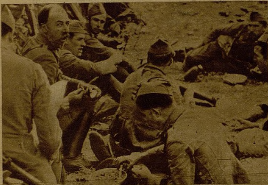
Un alto en la lucha es aprovechado por nuestros esforzados milicianos y soldados para reponer fuerzas, sentados tras el parapeto