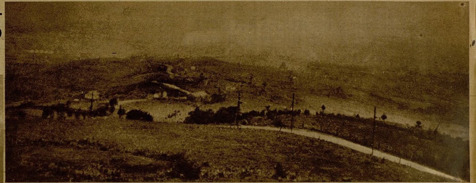
Desde El Naranco el casco de la ciudad de Oviedo se percibe apenas perdido en la polvareda y las columnas de humo que levantan nuestros proyectiles de Artillería y Aviación

sobre las posiciones contiguas a San Pedro de los Arcos a las dos baterías instaladas junto a los sanatorios del Naranco. Los disparos son certeros y se ve cómo el enemigo desaloja unas trincheras para correrse a otras. Las últimas bombas de la Aviación han hecho arder dos casas junto al depósito de máquinas y toda una manzana en la calle del Doctor Casal. El sol ha conseguido disipar la neblina matinal, pero una intensa cortina de humo de las explosiones cubre la ciudad.