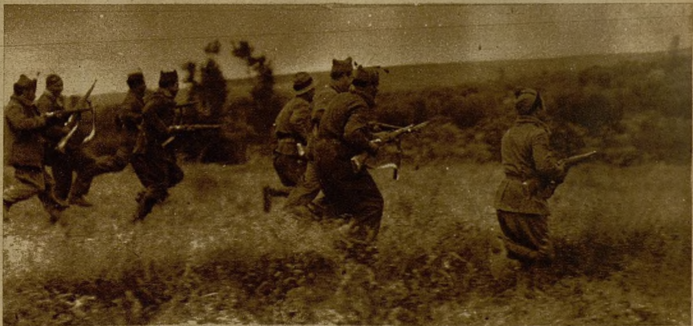
Soldados y milicianos, desplegados en guerrilla, inician un avance por unas llanuras del frente del Tajo

Cada automóvil que baje aquí, por la carretera brillante de agua, ha de venir con algo. A los hombres de la ciudad les es muy fácil llenar un "auto" de cosas. En la ciudad, que tiene portales y casas con camas, y todo bien, poco se necesita para vivir. En tiempo de guerra, muy poco.