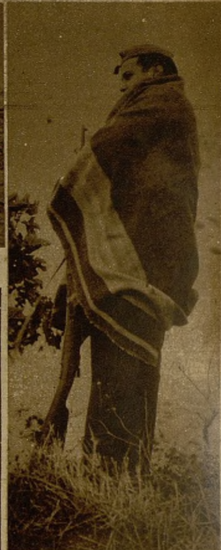
En todos los frentes que rodean Madrid han comenzado las lluvias de otoño. Nuestros soldados aguantan impertérritos las inclemencias del tiempo en los distintos servicios de campaña

Nuestros soldados disponen, es verdad, del vestuario preciso; pero tengan ustedes en cuenta que aquí, sobre la tierra húmeda, sobre estos rastros que