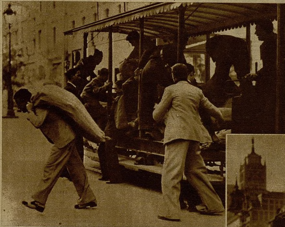
En las calles de Madrid el público se presta gustosamente a trasladar los sacos de víveres a los diversos parques de abastecimiento