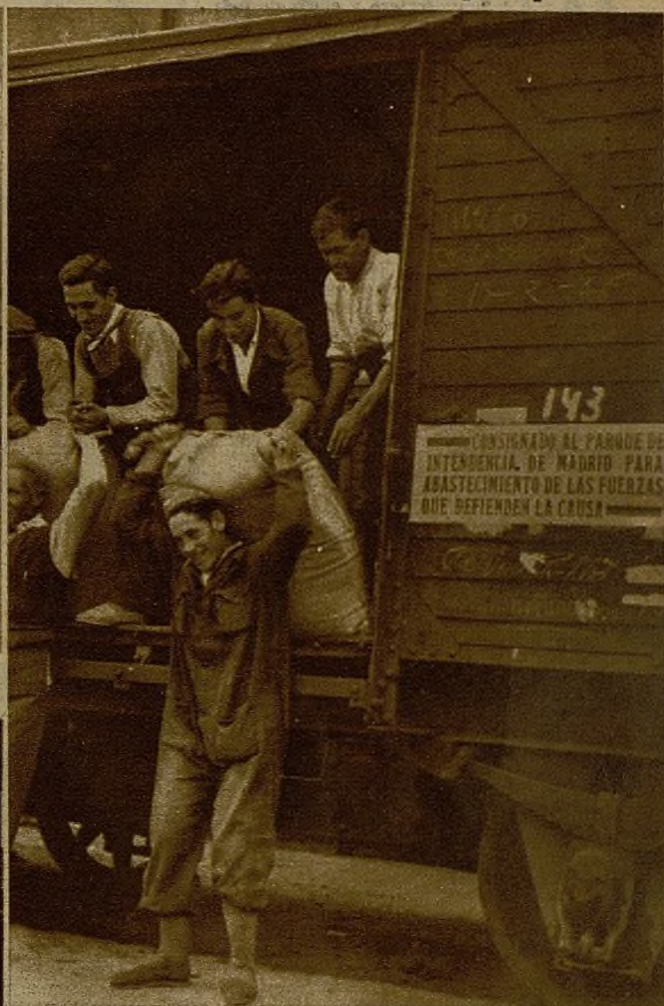
Numerosos voluntarios se adscriben al trabajo para la descarga de los vagones que llegan con víveres destinados a los parques de Intendencia. En todos los órdenes, con todas las actividades, se colabora a la causa común. He aquí a varios espontáneos trabajadores trasladando un cargamento