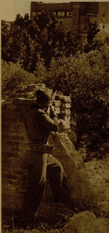
Tras la tapia semiderruida se distribuyen los milicianos para enfilar con sus tiros el refugio enemigo

(CRONICA DE NUESTRO REDACTOR JESUS IZCARAY)