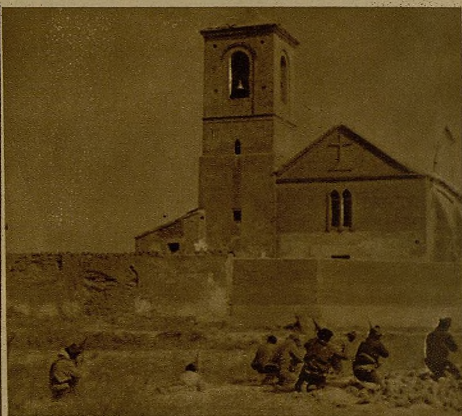
Un momento del ataque a un pueblo del frente del Tajo, en cuya iglesia se había refugiado un grupo de facciosos

Atacar, atacar... Los militares gritan el verbo y quieren correr hacia adelante