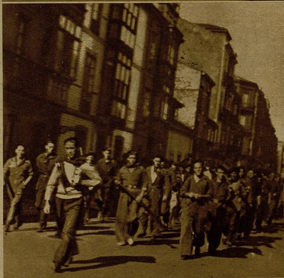
Compañías recién formadas dirigiéndose al campo para hacer la instrucción

capaz de todo sacrificio y de soportar toda incomodidad.