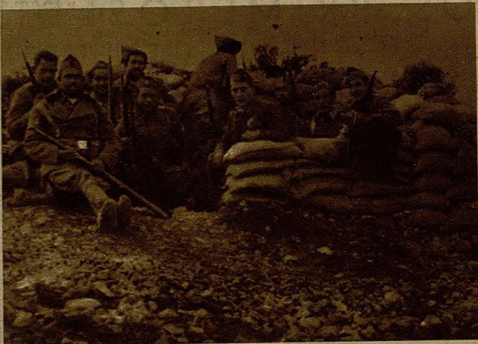
Una de las trincheras de avanzada en el frente de Teruel, emplazada a escasa distancia de la línea enemiga