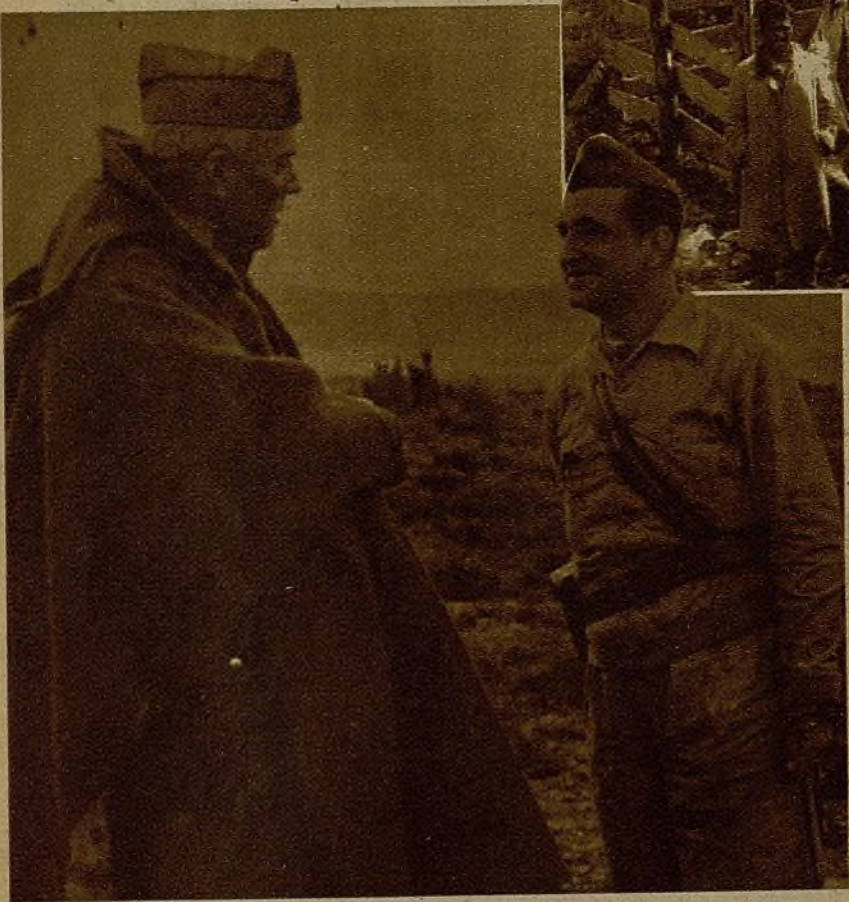
Un jefe en el frente de Teruel cambiando impresiones con otro