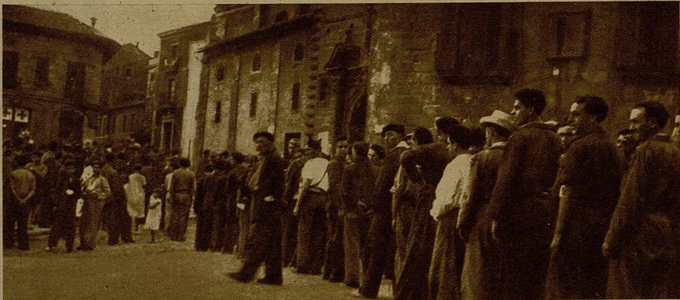
En Gijón el alistamiento de voluntarios es nutridísimo. He aquí a una "cola" para inscribirse en las Milicias

Frente a esta barbarie nosotros hemos de oponer no unas guerrillas, sino un ejército, un verdadero ejército al servicio de la Libertad. Y esto no se puede conseguir más que con una disciplina absoluta y estrecha, con una abnegación