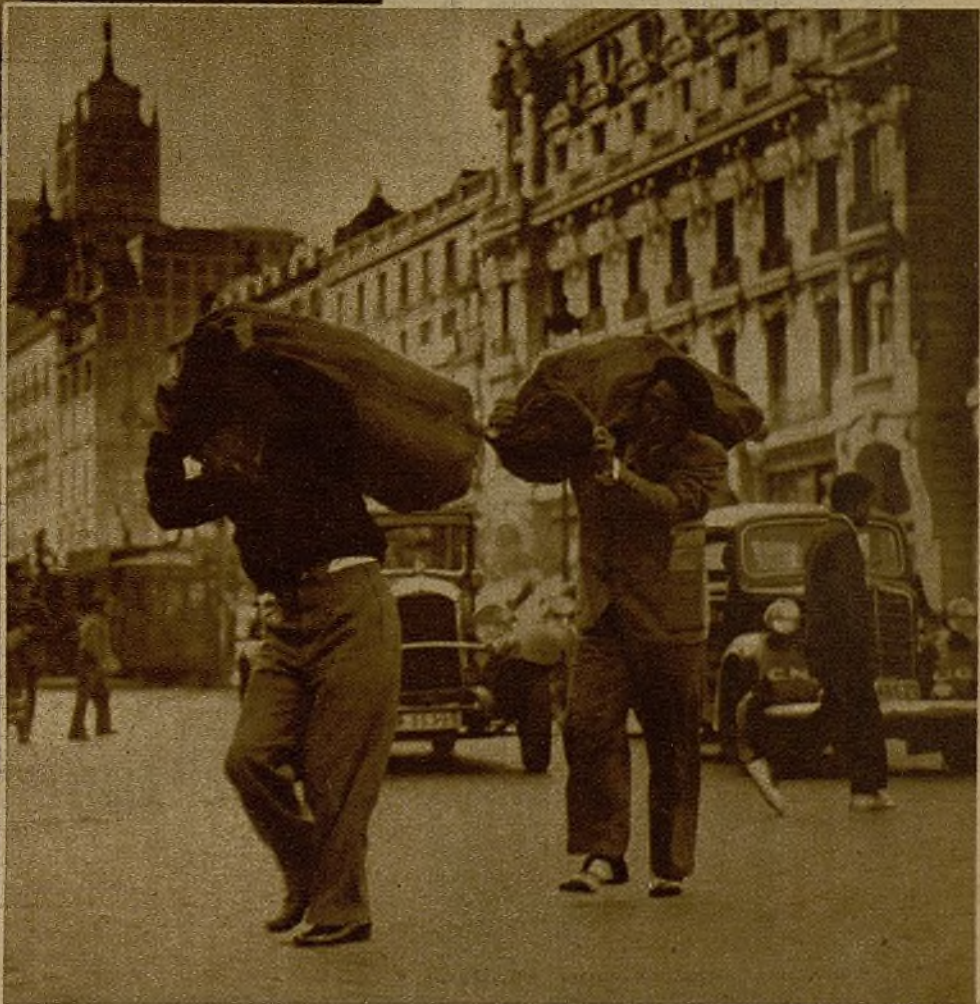
Inmediatamente que se ha detenido la jardinera del tranvía, los espontáneos cargadores toman los sacos, y en pocos momentos realizan el traslado