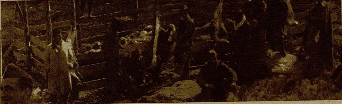
Nuestros luchadores disponen de carne en abundancia, aun en los lugares más avanzados de los frentes. Véase a estos servidores de un puesto de vanguardia descuartizando cordillos de su rebaño