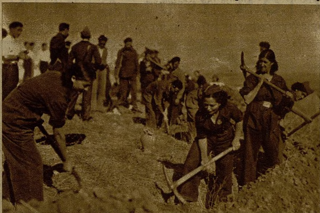
Jóvenes milicianos del Partido Comunista trabajando en la construcción de trincheras