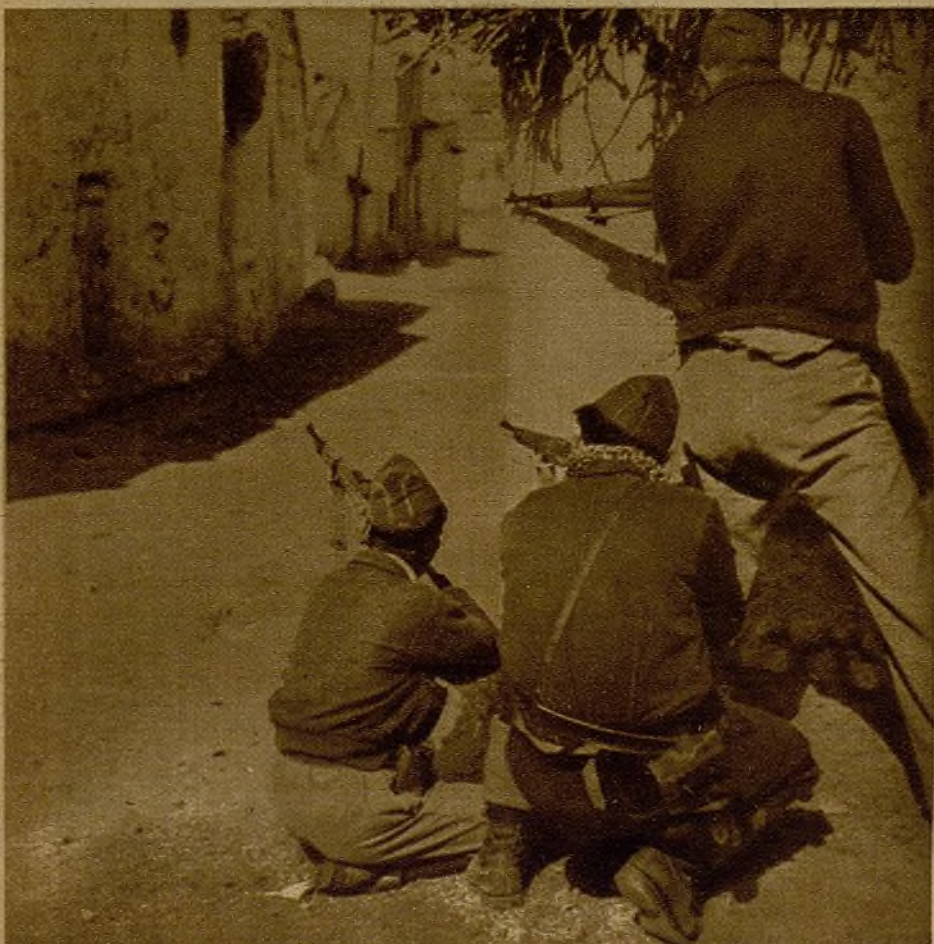
Milicianos entrando en las calles de un pueblo reconquistado en el sector del Tajo

¡Salud, comandante! Para cubrir tu cuerpo andan buscando la bandera más roja.