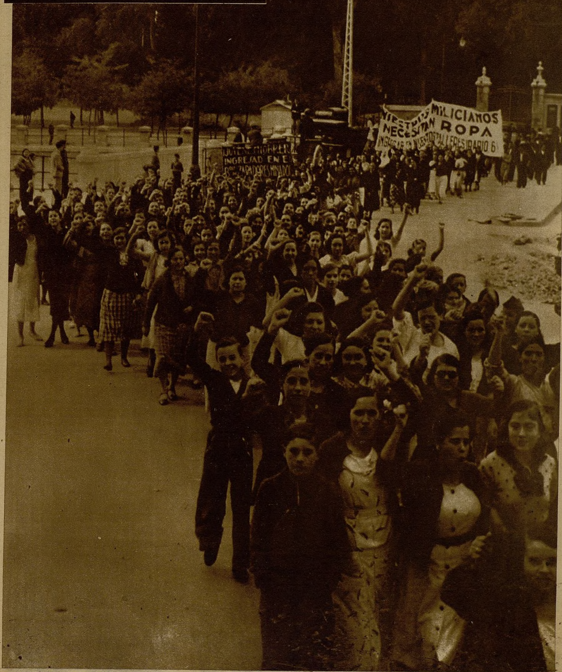
LA COLABORACION DE TODO EL PUEBLO PARA LA DEFENSA DE MADRID. — Numerosas manifestaciones formadas por mujeres, como esta que aparece en la foto, recorrieron ayer las calles madrileñas exaltando el ánimo público para que cada cual en la proporción de sus posibilidades, contribuya a la defensa de la capital de la República. Toda el pueblo madrileño, consciente de que vive unos momentos excepcionales.