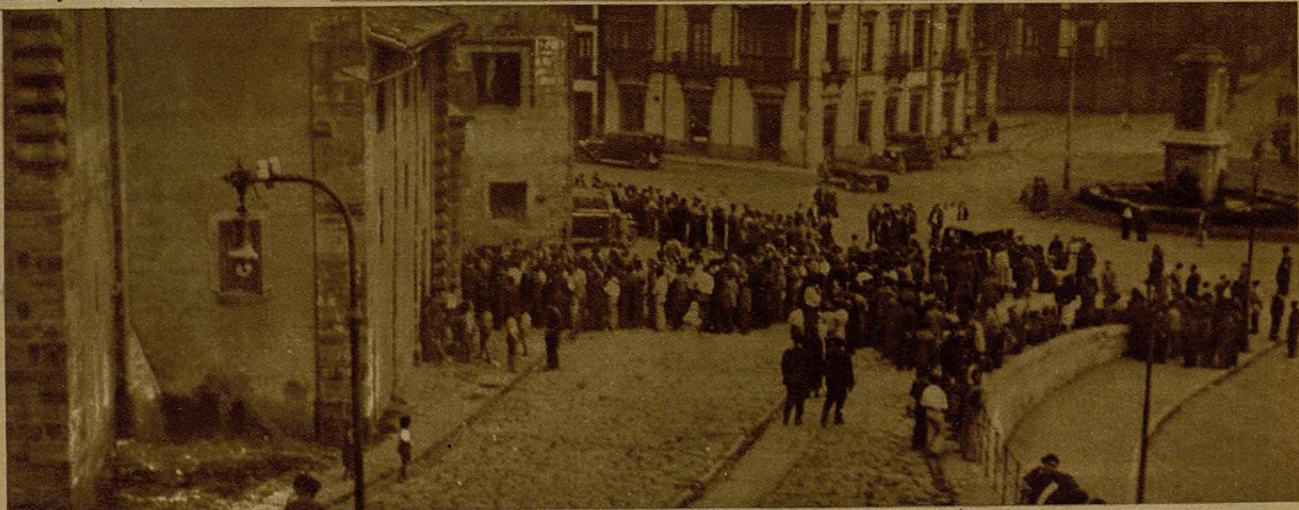
Otras "colas" de paisanos ante el palacio de Revillagigedo, en Gijón, para incorporarse a la lucha

Y me siento optimista porque creo que para aplastar al fascismo habrá en España tantos soldados disciplinados como hombres útiles.