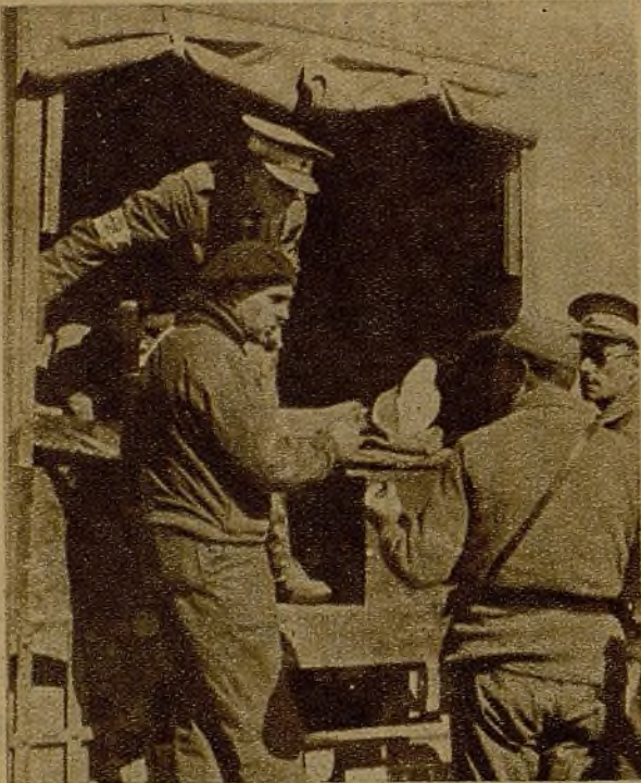
Miembros de la ambulancia sanitaria inglesa, que presta beneméritos servicios en nuestros frentes, en un momento de su generosa actuación.