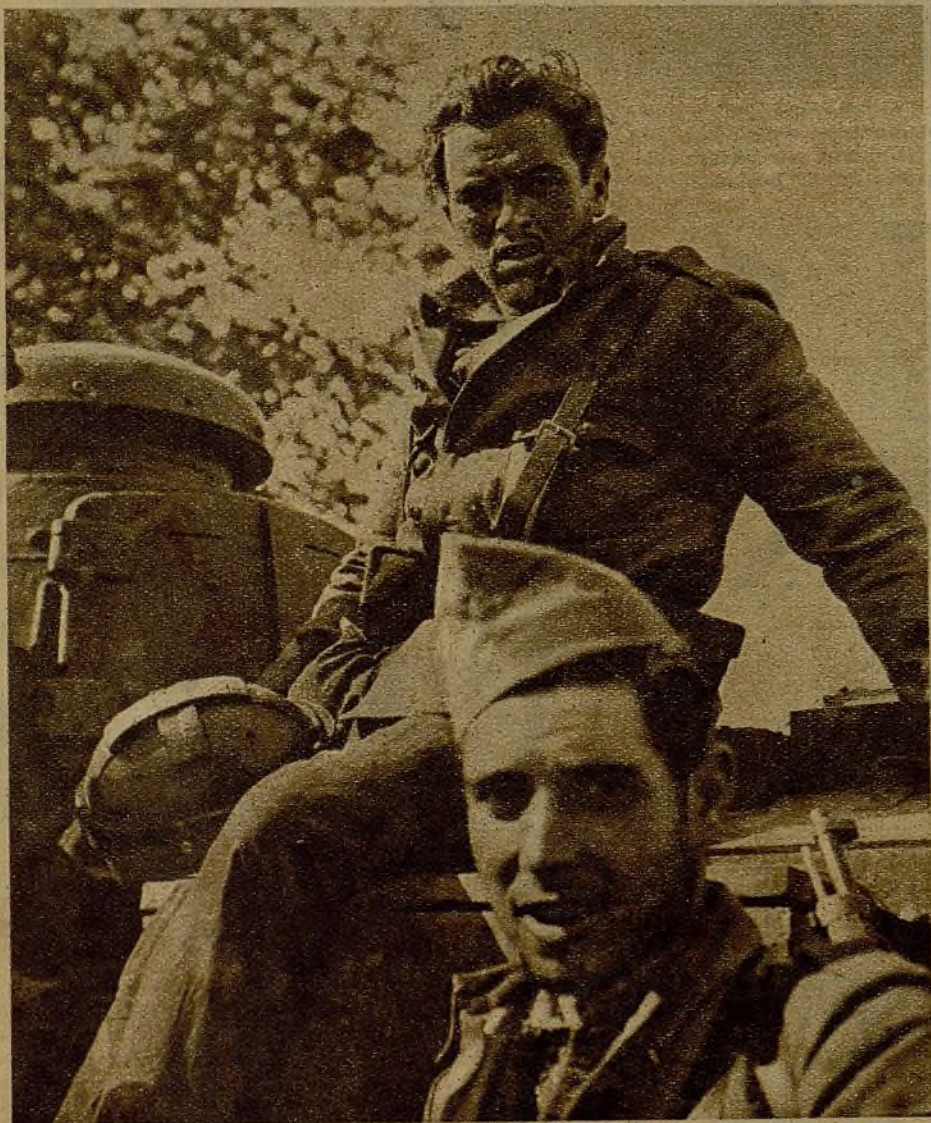
La fuerte reacción de nuestras tropas en el sector del Tajo ha puesto de manifiesto la gran eficacia de la unanimidad en la ofensiva, y su acción se hizo sentir prontamente, originando un precipitado retroceso del enemigo, que sufrió numerosas bajas y tuvo que buscar protección en sus posiciones de retaguardia. He aquí a dos conductores que se batieron con gran arrojo