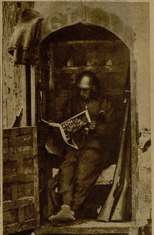
En su improvisada garita, el miliciano, que después de la ruda actuación del día tiene asignada ahora una tranquila vigilancia, se entera por nuestro diario de las impresiones de la jornada