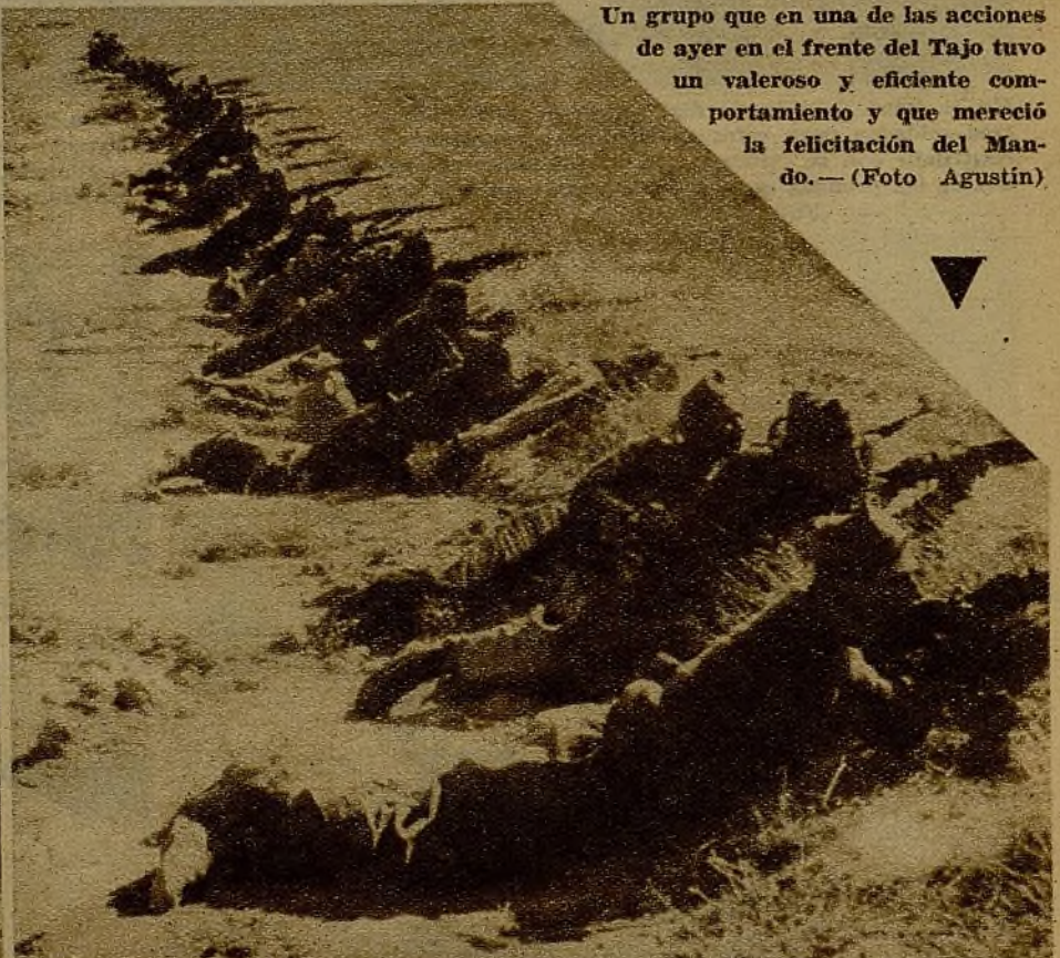
Un grupo que en una de las acciones de ayer en el frente del Tajo tuvo un valeroso y eficiente comportamiento y que mereció la felicitación del Mando.