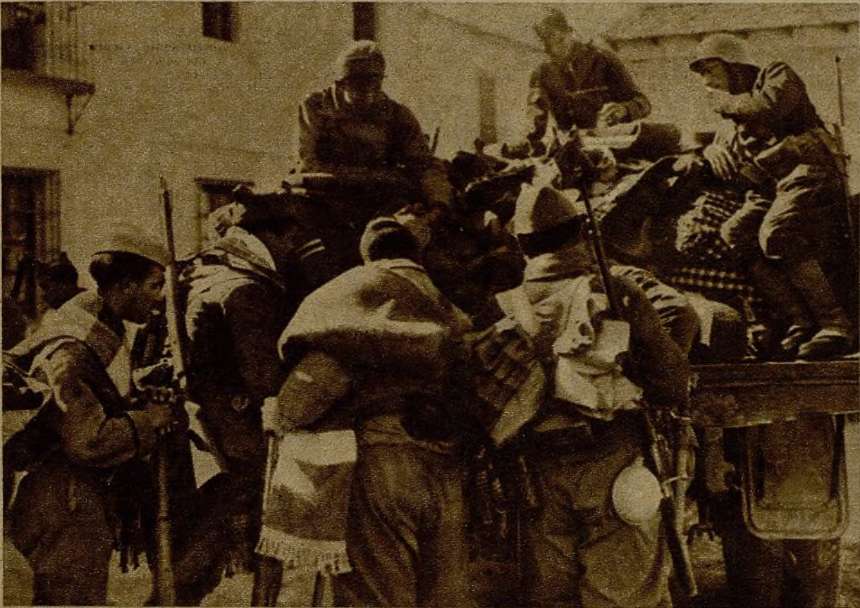
En la línea de retaguardia, antes de partir nuestros soldados para reforzar las líneas avanzadas y contribuir con su esfuerzo a la ofensiva son equipados de las prendas que les protegerán contra el frío