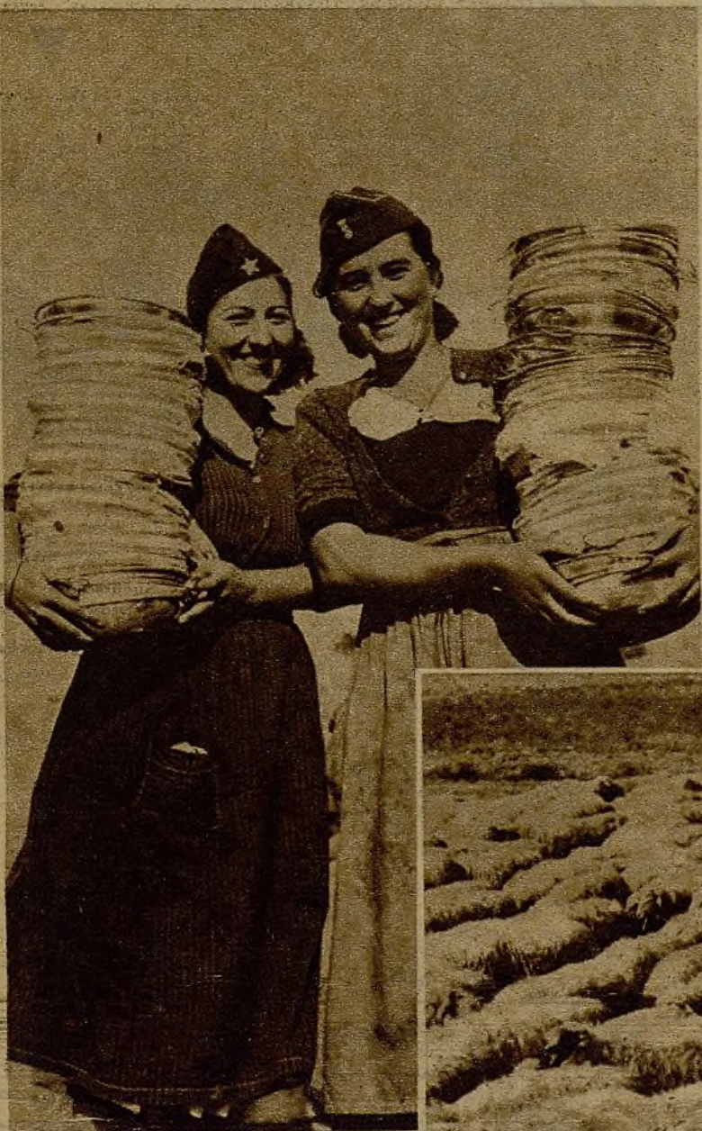
Estas dos bellas milicianas están encargadas de la cocina en uno de los grupos combatientes en el sector del Tajo. Ahora, descargan platos llegados en un camión para surtir a los milicianos. Ellas son también las encargadas de llevarlos...