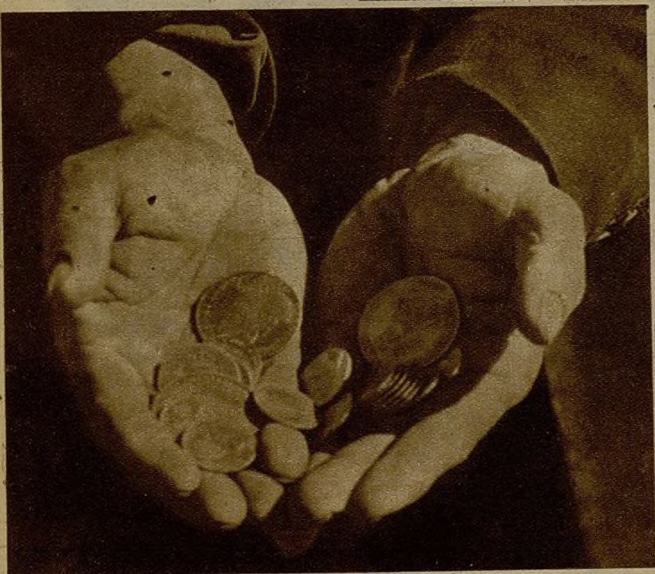
Las peluconas—ya se supone el origen de la posesión—que fueron halladas en la montura de un caballo moro, cuyo jinete cayó en la lucha

ga era débil y sonaba lejana. La explicación de esto se encontró poco después.