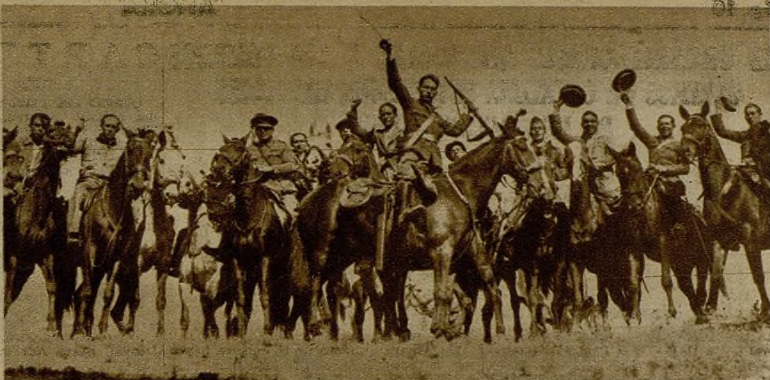
En uno de los combates de ayer en el sector del Centro este grupo de carabineros tuvo una intervención brillantísima. Con admirable empuje resistió las acometidas del enemigo, le rechazó en violentísimo contraataque y se adueñó de sus posiciones. Véaseles mostrando su entusiasmo por la victoria.