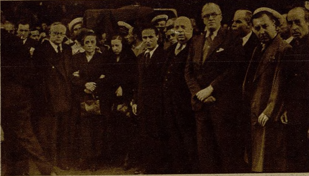
Varios miembros del Gobierno y familiares del heroico militar en la presidencia del duelo