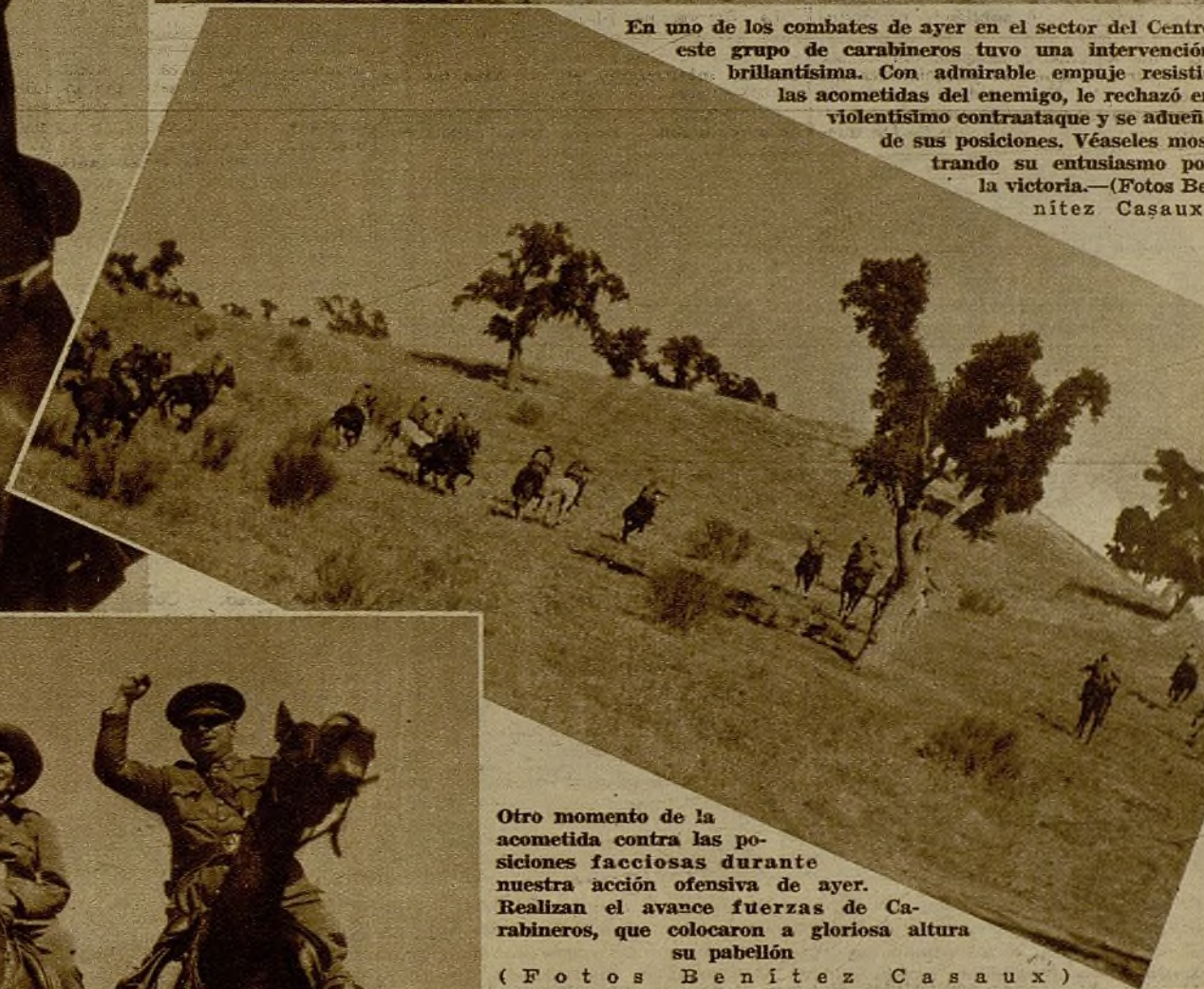
Otro momento de la acometida contra las posiciones facciosas durante nuestra acción ofensiva de ayer. Realizan el avance fuerzas de Carabineros, que colocaron a gloriosa altura su pabellón