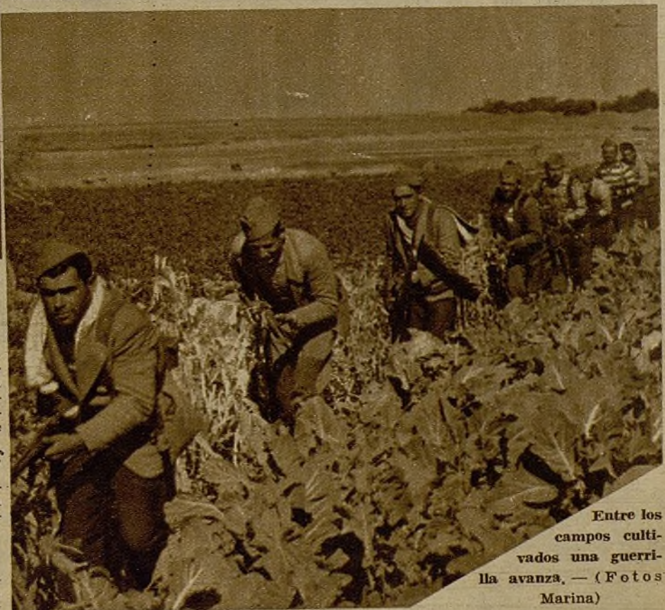
Entre los campos cultivados una guerrilla avanza.

Junto a los soldados de la ametralladora pasa un muchacho moreno subido en una yegua negra. Se la encontró ayer