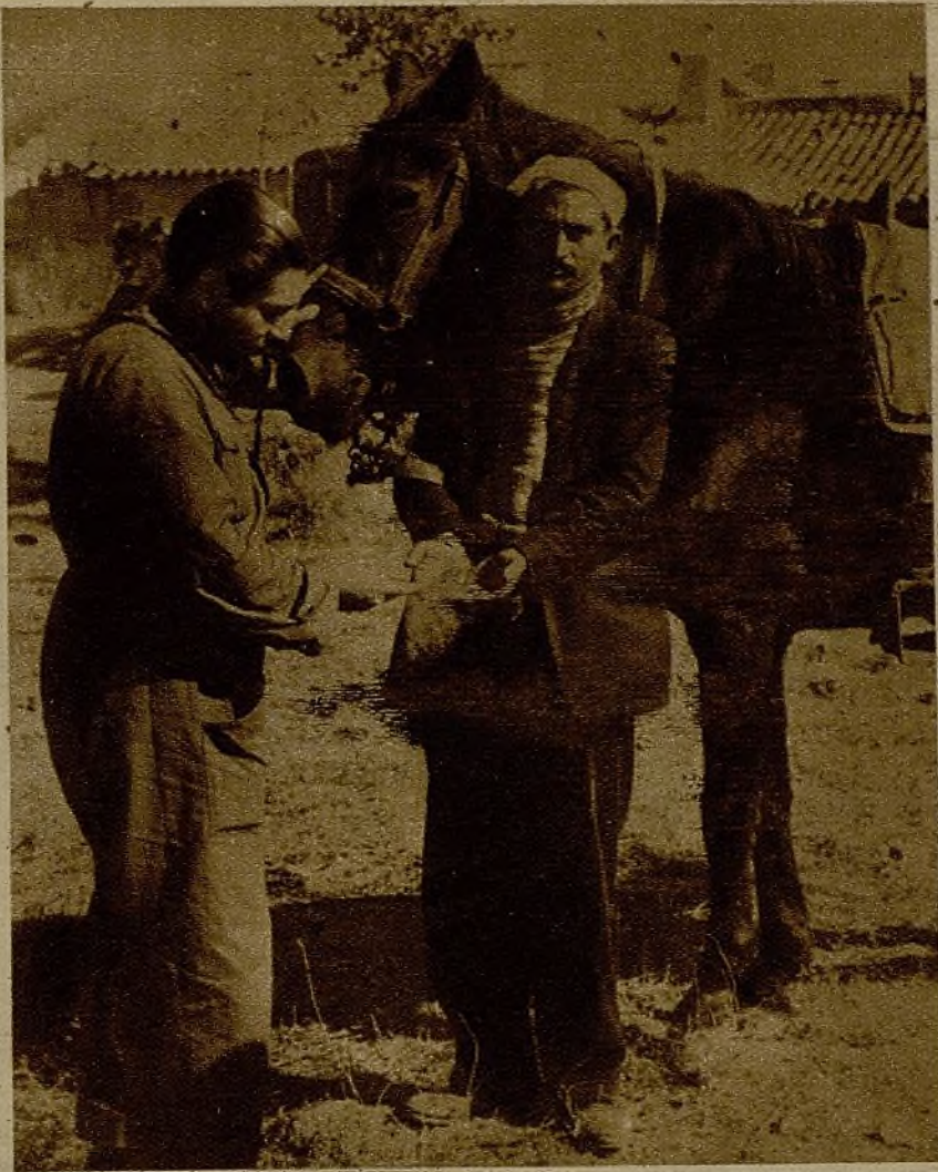
Un miliciano muestra a nuestro compañero Izcaray el puñado de monedas de oro que halló en las cartucheras de la montura de un caballo moro

Por la tarde, nuestra Artillería proseguía su labor eficaz. La réplica enemiga