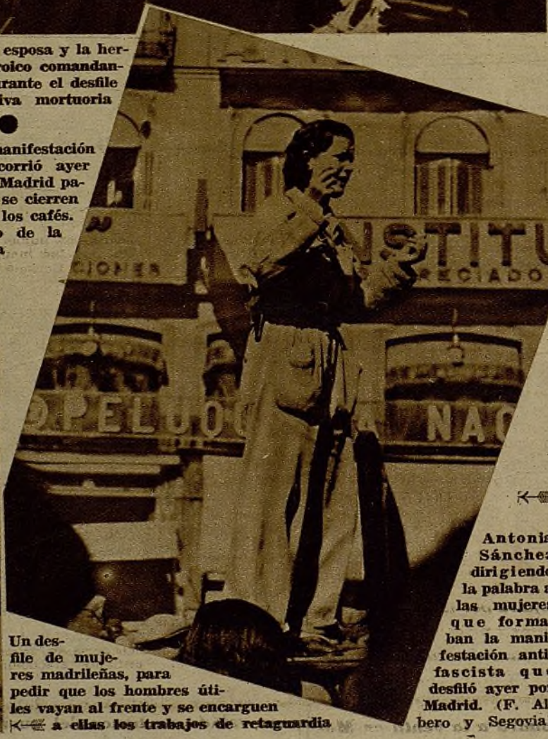
Un desfile de mujeres madrileñas, para pedir que los hombres útiles vayan al frente y se encarguen a ellas los trabajos de retaguardia