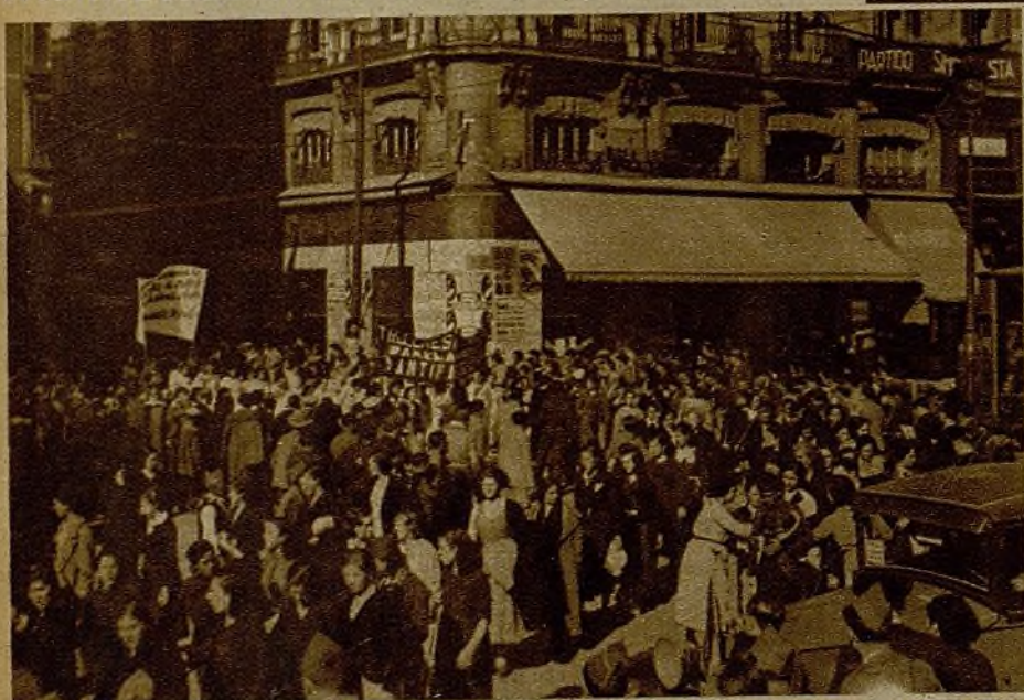
Una gran manifestación femenina recorrió ayer las calles de Madrid para pedir que se cierren los teatros y los cafés. Un momento de la misma