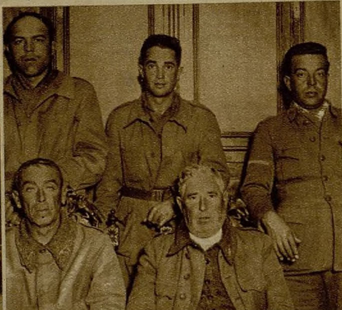
Carabineros de Extremadura que se refugiaron en Portugal y se trasladaron a Tarragona. Desde allí han venido a Madrid para ponerse a disposición del Gobierno de la República