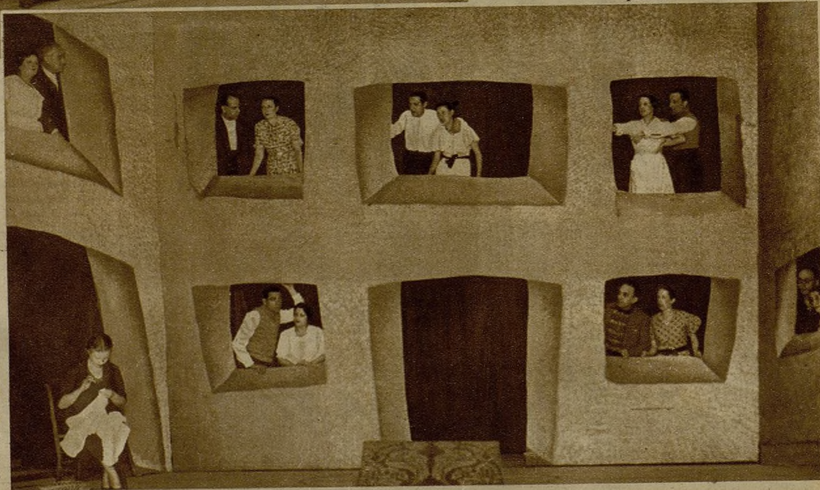
La notable escritora Luisa Carnés ha estrenado en el antiguo teatro Lara una obra relativa al trascendental momento que vive España, que se titula "Así empezó..." Un momento de la representación