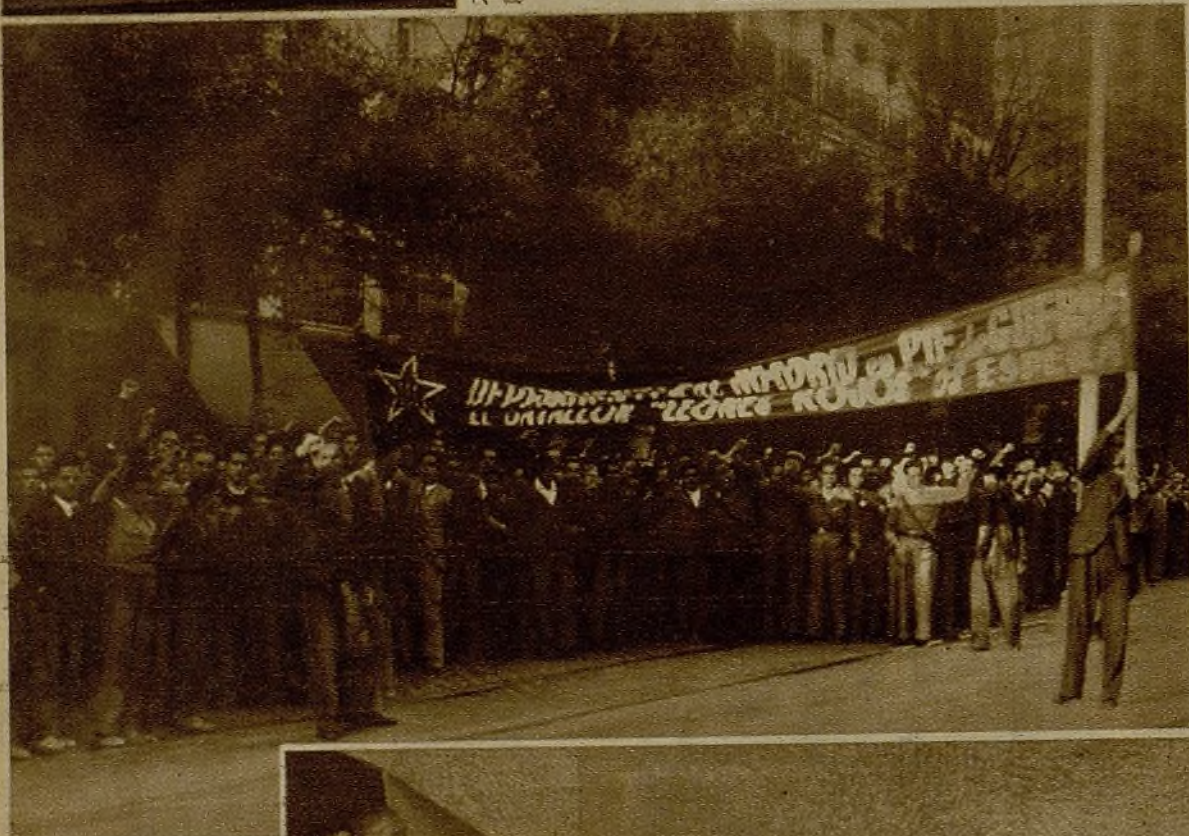
La Asociación de Dependientes de Comercio, afecta a la U. G. T., organizó una manifestación para propugnar la necesidad inmediata de la defensa de Madrid. Concurrieron a ella varios miles de afiliados, que recorrieron las calles en patriótica demanda de la prestación popular para la inmediata y definitiva batalla contra el fascismo. Un momento del paso de los manifestantes