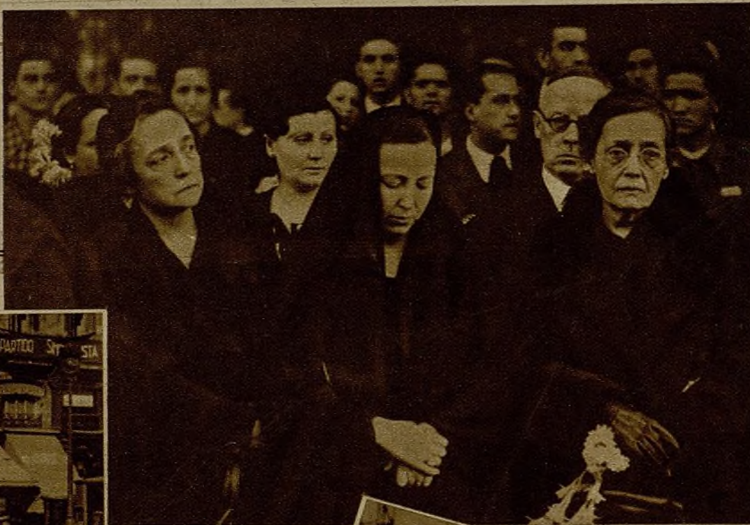
La madre, la esposa y la hermana del heroico comandante Ristori, durante el desfile de la comitiva mortuoria