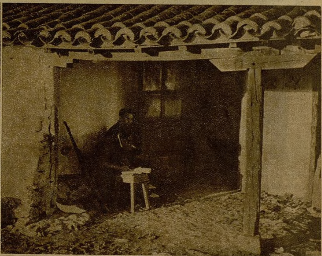
Un control, cerca del frente. Los milicianos de guardia hacen la nota para el Mando del municionamiento recibido y de la distribución de los víveres