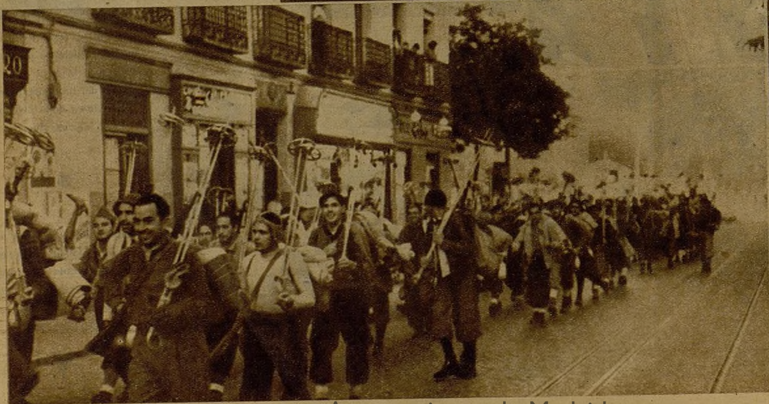
El Batallón Alpino de milicianos madrileños desfilando por las calles de la capital