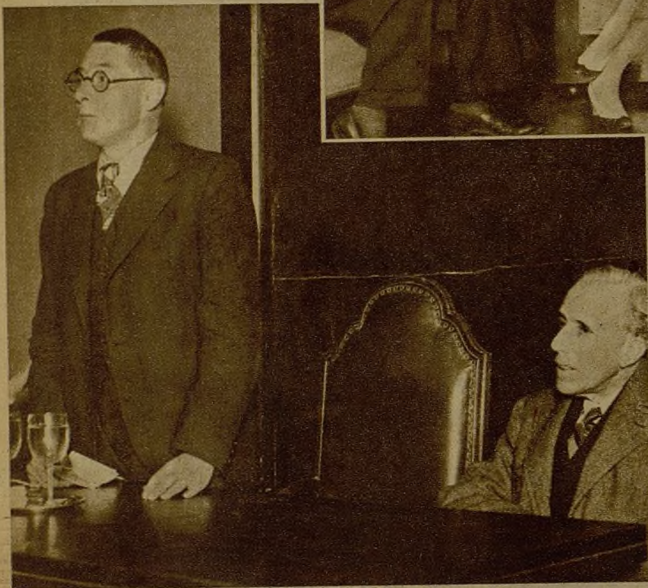
El ilustre profesor de la Sorbona, doctor Henry Wallon, durante la conferencia antifascista que dió en la Universidad sobre el tema "La revolución y la cultura"