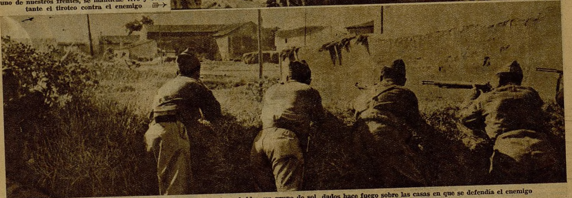
En las inmediaciones de un pueblo que fué tomado a los rebeldes, un grupo de soldados hace fuego sobre las casas en que se defendía el enemigo