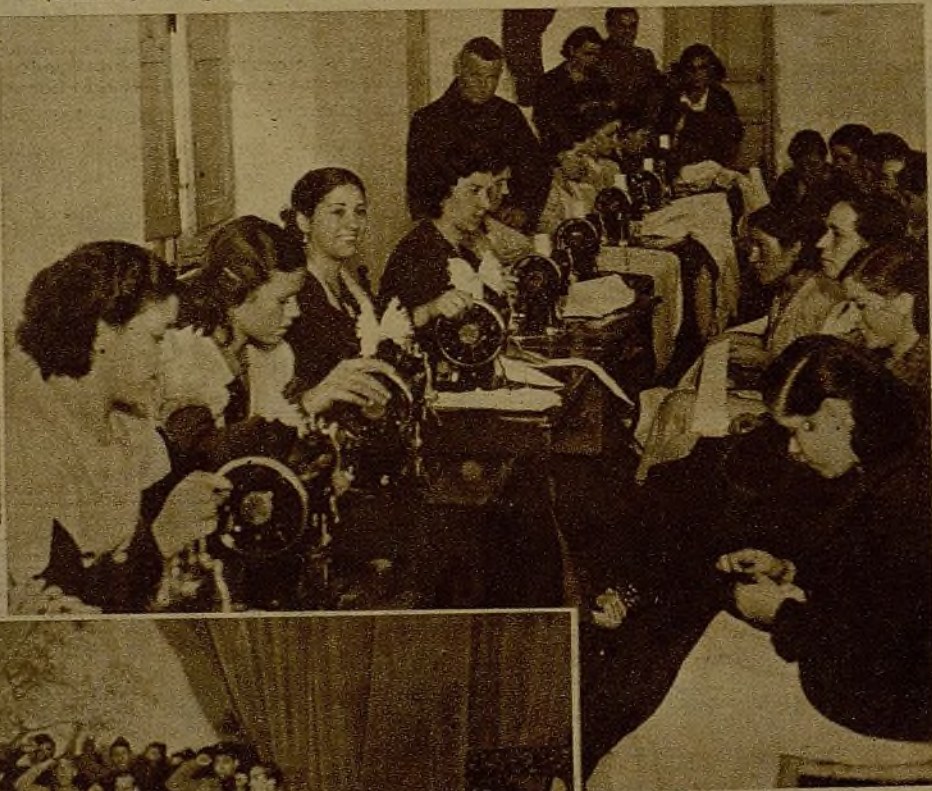
Muchachas de Carabanchel Bajo trabajando al servicio del Comité Local de Abastecimientos, que viene realizando una gran labor de organización ciudadana