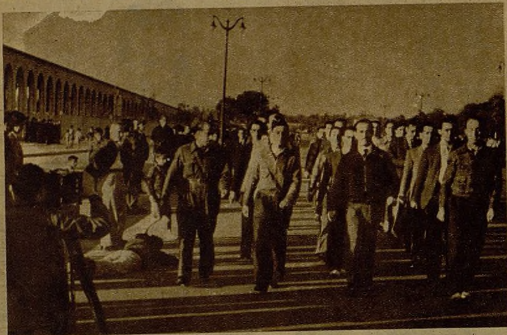
La cámara cinematográfica recoge el momento de la instrucción de los funcionarios de la Enseñanza