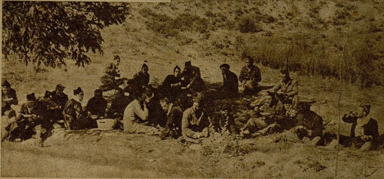
Después de una larga actuación, soldados de la sección motorizada descansan para almorzar en un lugar de las avanzadas