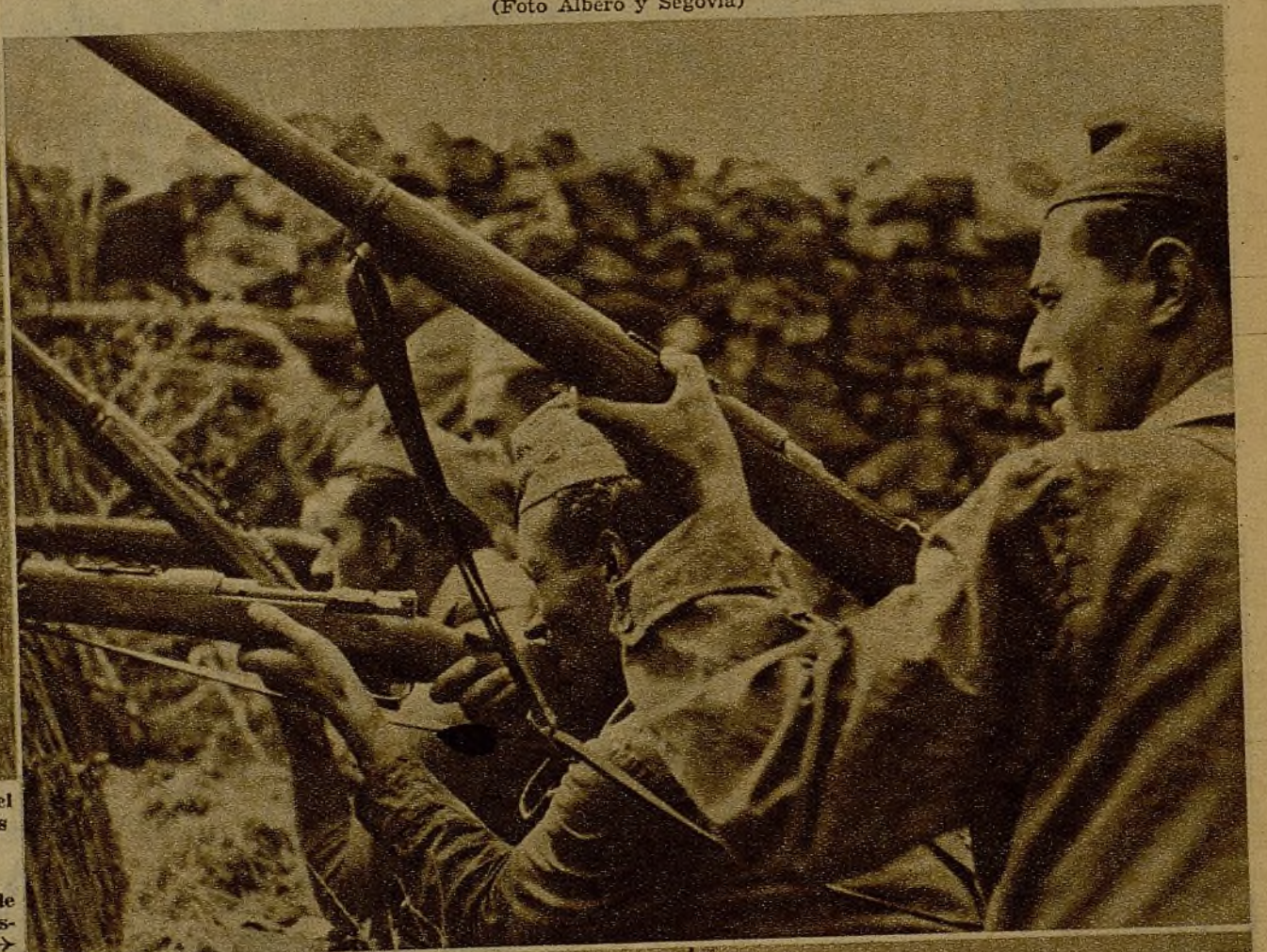
Tras del parapeto, en la línea más avanzada de uno de nuestros frentes, se mantiene vivo y constante el tiroteo contra el enemigo