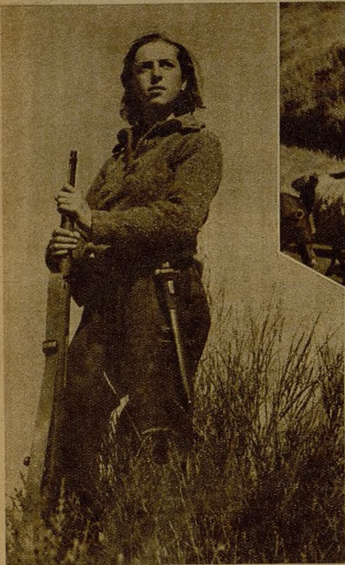
Una valiente miliciana, en su puesto de vigilancia, soporta las horas de quietud, presta a dar la voz de alarma en cuanto advierta algún movimiento sospechoso en las líneas enemigas

(DE NUESTRO REDACTOR EN EL FRENTE, JOSE QUILEZ VICENTE)