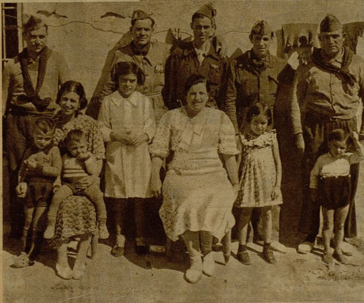
Cinco guardias que realizaron una magnífica defensa en un pueblecito aragonés. Gracias a una estratagema pudieron esperar la llegada de refuerzos