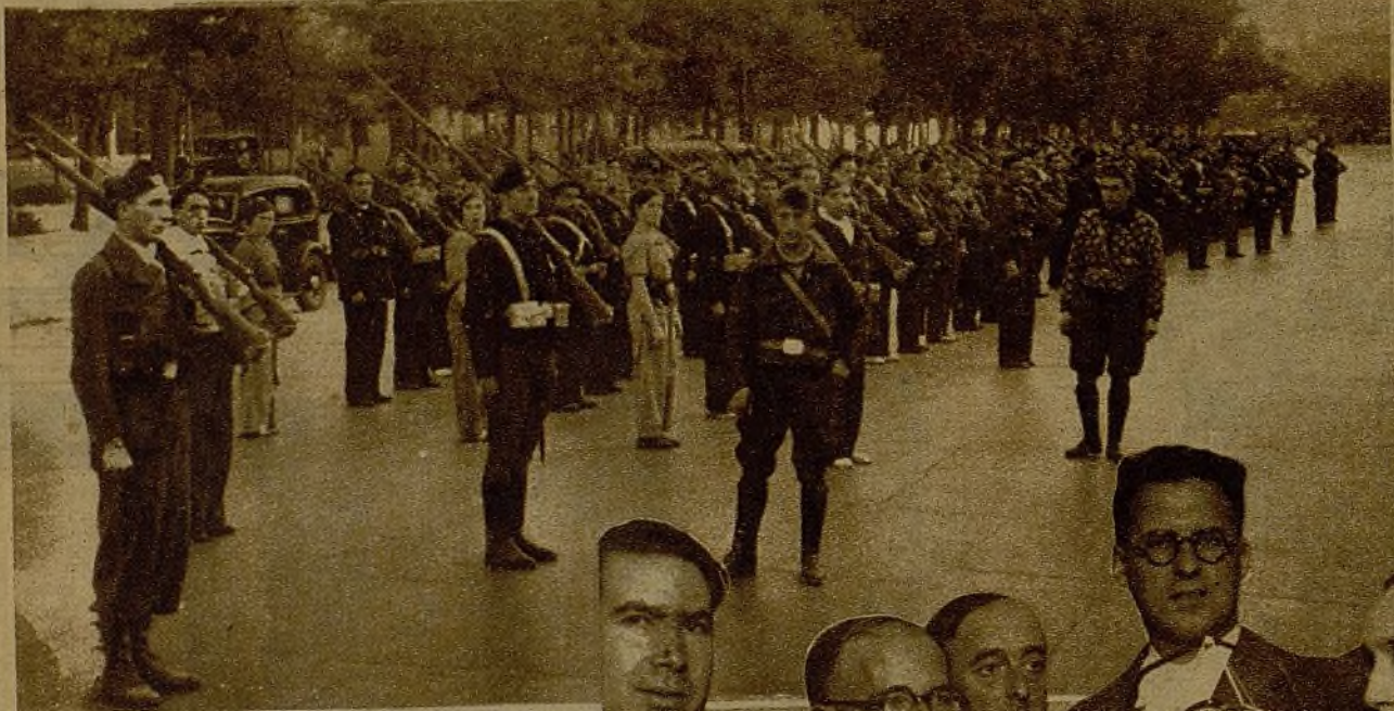
El batallón formado por los individuos pertenecientes al Servicio Municipal de Limpieza espera el momento de ser revistado por los jefes