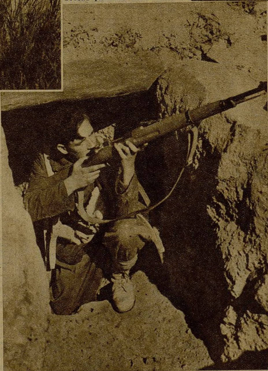
Desde su refugio, este soldado caza a cualquier enemigo que intente destacarse frente a la línea encomendada a su vigilancia