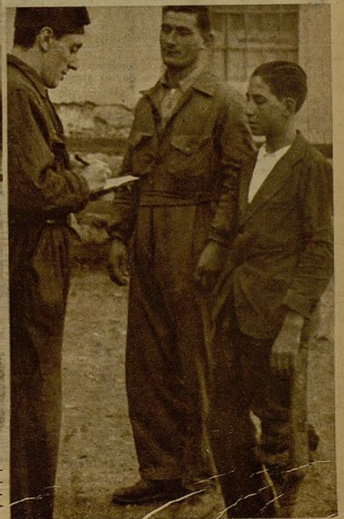
Este cojito y su compañero son dos fugados de Teruel que, después de jornadas fatigosísimas, llegaron a nuestro frente. Ante un jefe de Milicias, periodista combatiente, relatan su odisea