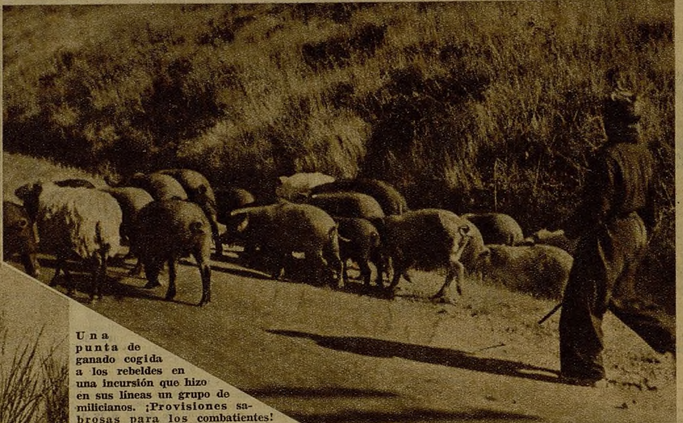
Una punta de ganado cogida a los rebeldes en una incursión que hizo en sus líneas un grupo de milicianos. ¡Provisiones sabrosas para los combatientes!

Los técnicos de la guerra recelan de estas calmas completas en las zonas de fuego. Dicen que son heraldo de grandes batallas y duelos de artillería inacabables. "Después de tanta tranquilidad, torrentes de fuego y metralla sobre los campos", asegura un veterano de nuestras guerras africanas. Es posible que así sea, pero hoy no se oye un tiro. Con el auxilio de los prismáticos contemplamos las avanzadillas enemigas. Mercenarios que leen al sol, moros que lavotean ropa en las charcas inmediatas y las consabidas guardias que vigilan nuestros movimientos. En nuestro campo, parecido panorama... En un descampado varios milicianos andaluces han improvisado una capea con un novillote destinado al estofado de la noche. Hay carreras del morucho tras los lidiadores en agraz, no pocos volteos y, por fin, el sacrificio de la res.