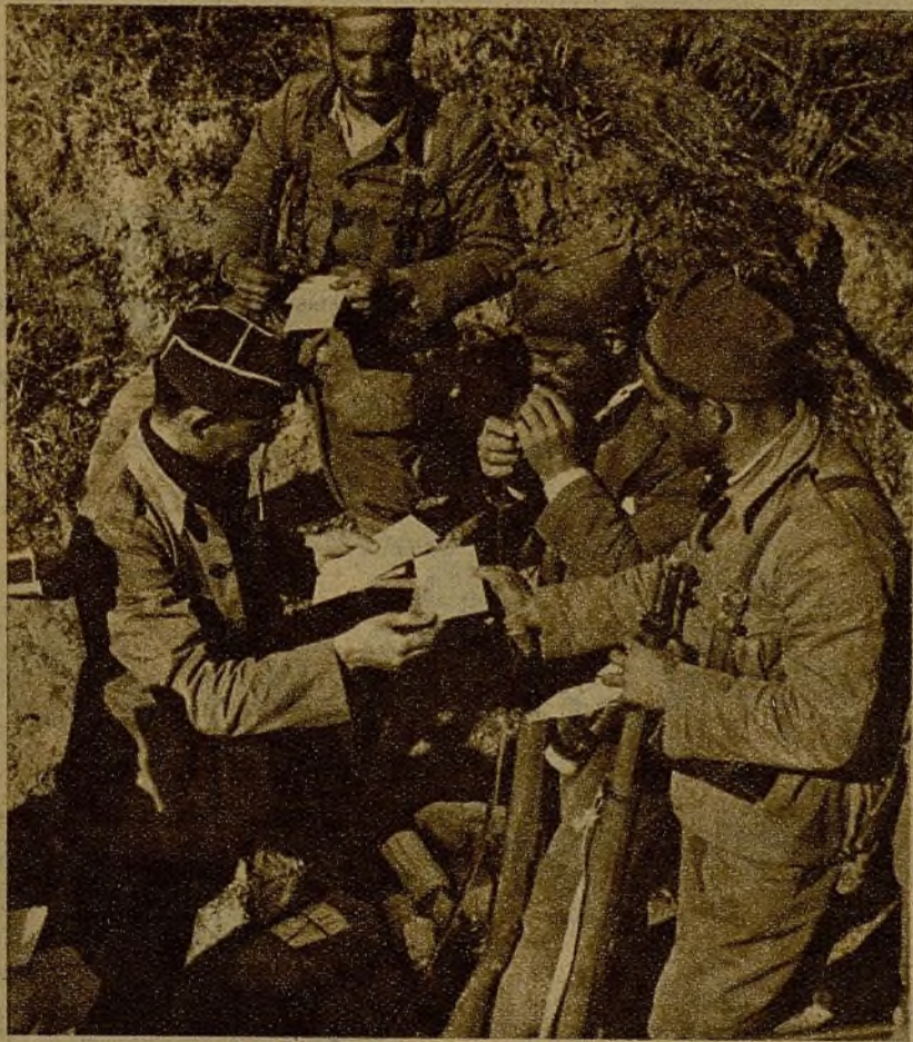
Un griterío precede a la entrada en el campamento del cartero, que trae noticias de los familiares, o del cosario que transporta los esperados encargos. "¡Ya está aquí!", y se lanzan los milicianos en aluvión sobre ellos. Después de la lectura de las misivas hacen sus comentarios y cambian impresiones sobre las respectivas noticias