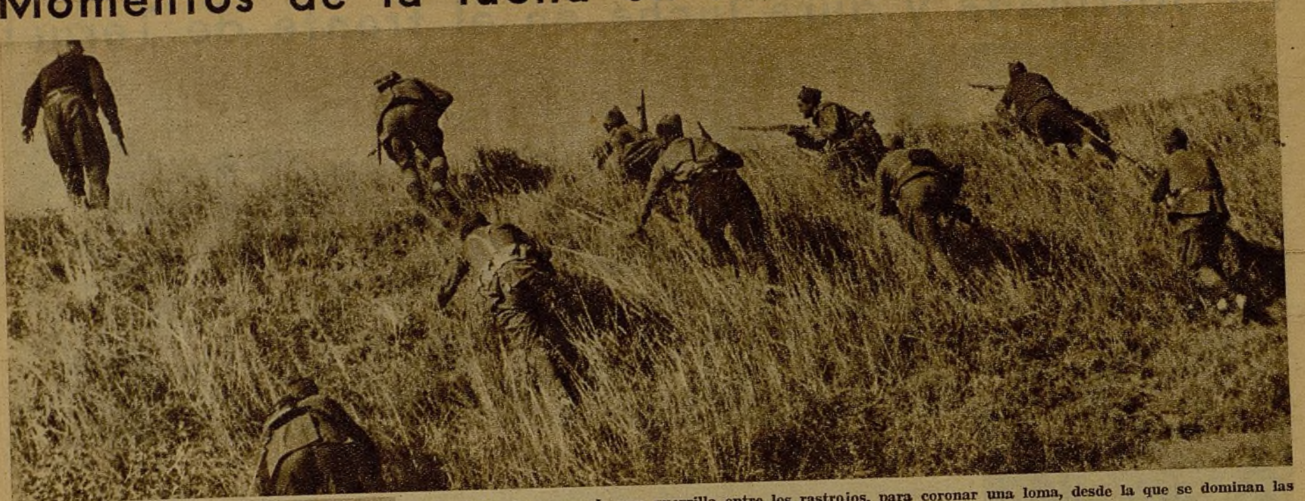
El momento de avance de una guerrilla entre los rastrojos, para coronar una loma, desde la que se dominan las posiciones facciosas