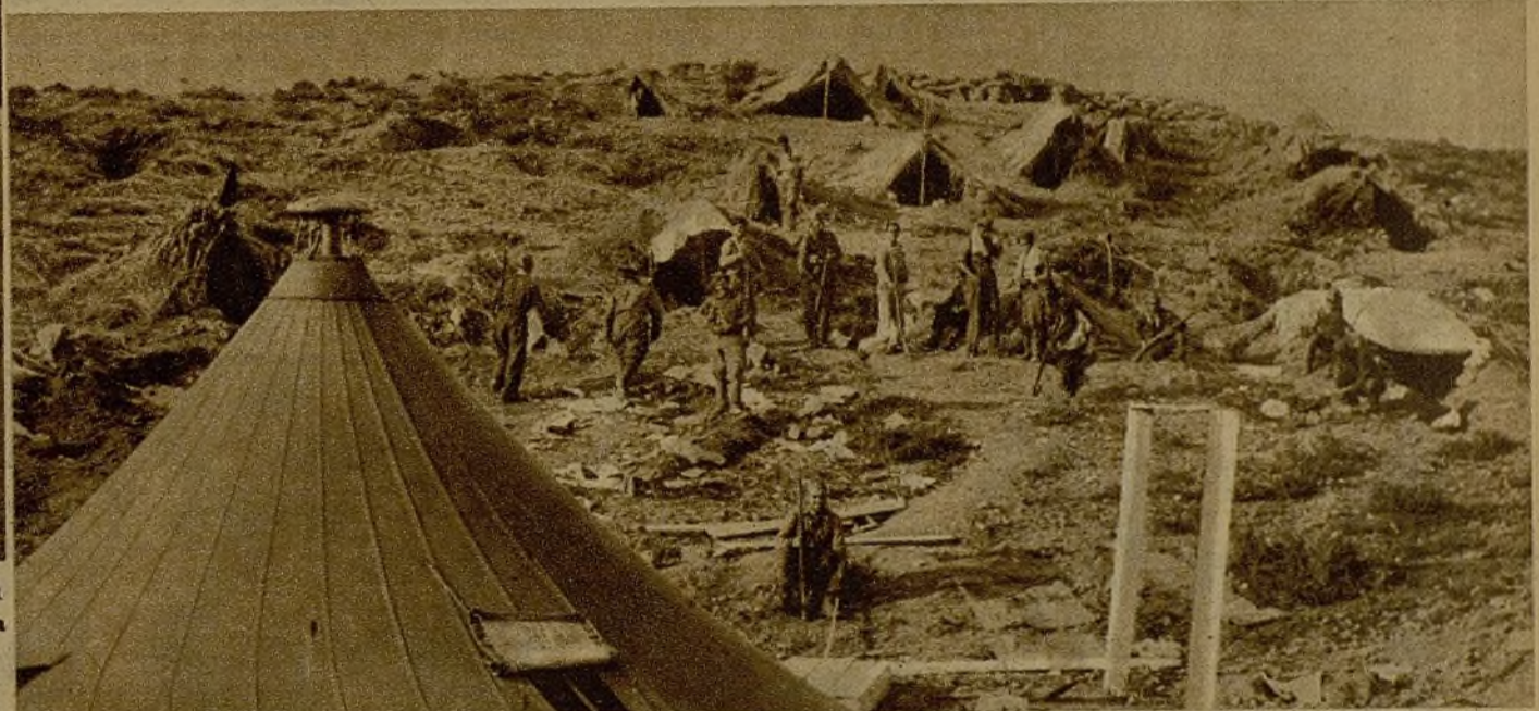
En este campamento irrumpieron los milicianos leales y pusieron en fuga a sus defensores. Hoy duermen nuestros luchadores en sus tiendas