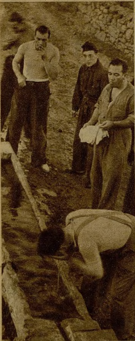
Al apuntar el alba el miliciano hace su "toilet" en este arroyo, sin miedo a la frialdad del agua