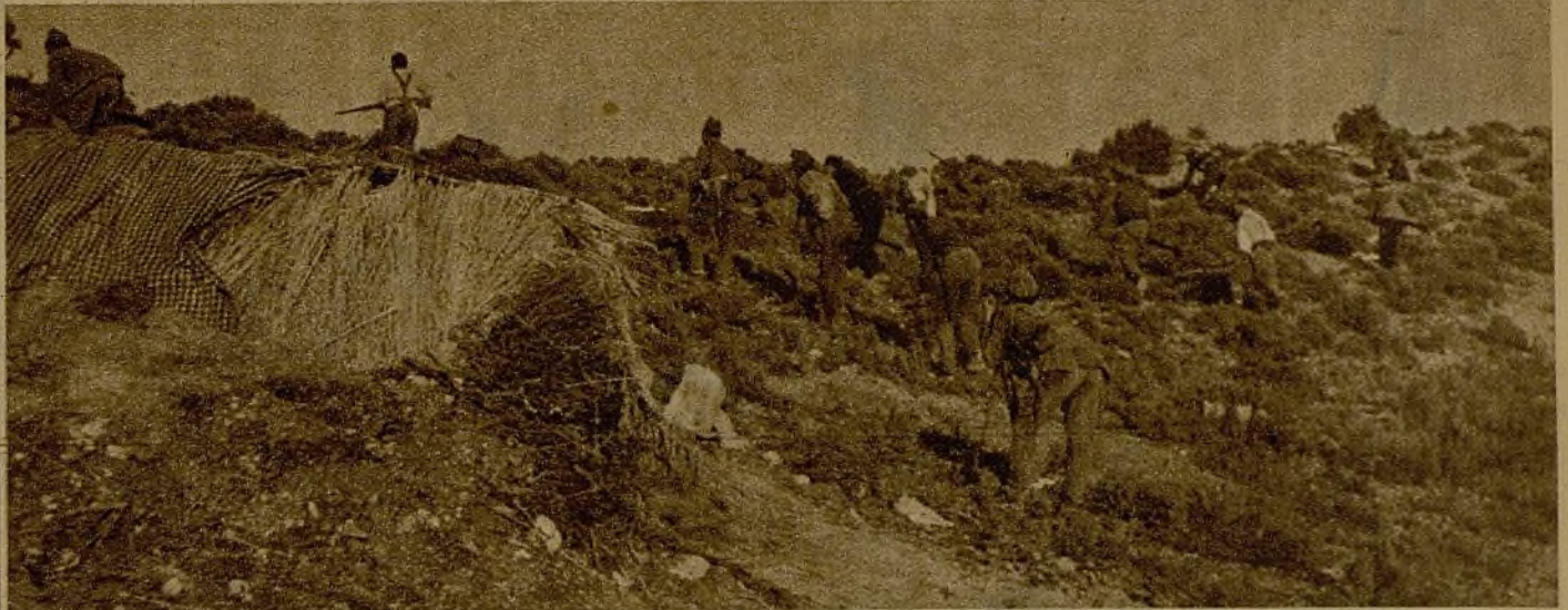
Un grupo de milicianos, en uno de los puntos estratégicos del frente de Aragón, realizan el servicio de descubierta