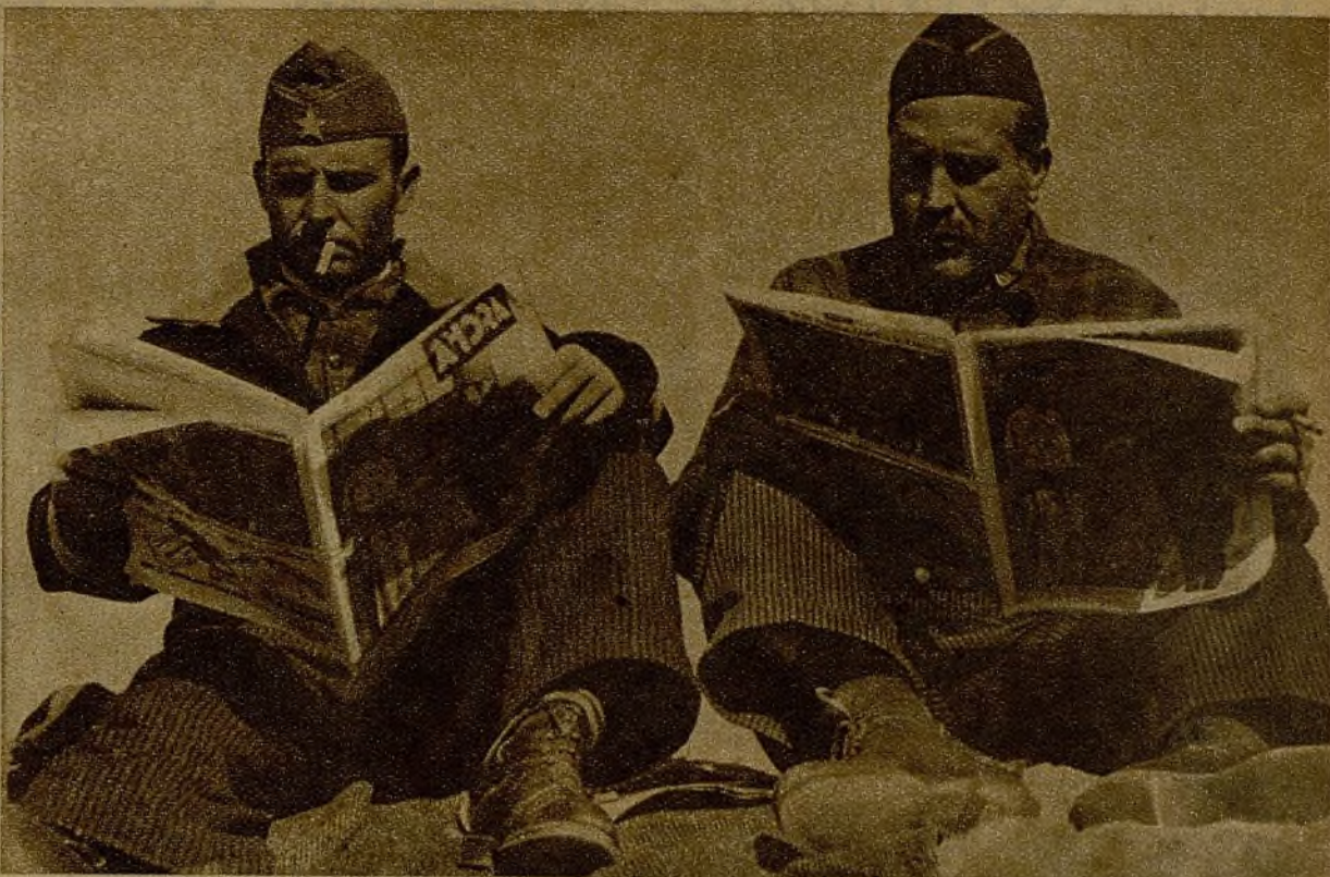
El momento de la llegada del periódico es esperado con ansiedad. AHORA tiene—y no es orgullo nuestro—verdadero privilegio. Los milicianos piden AHORA...