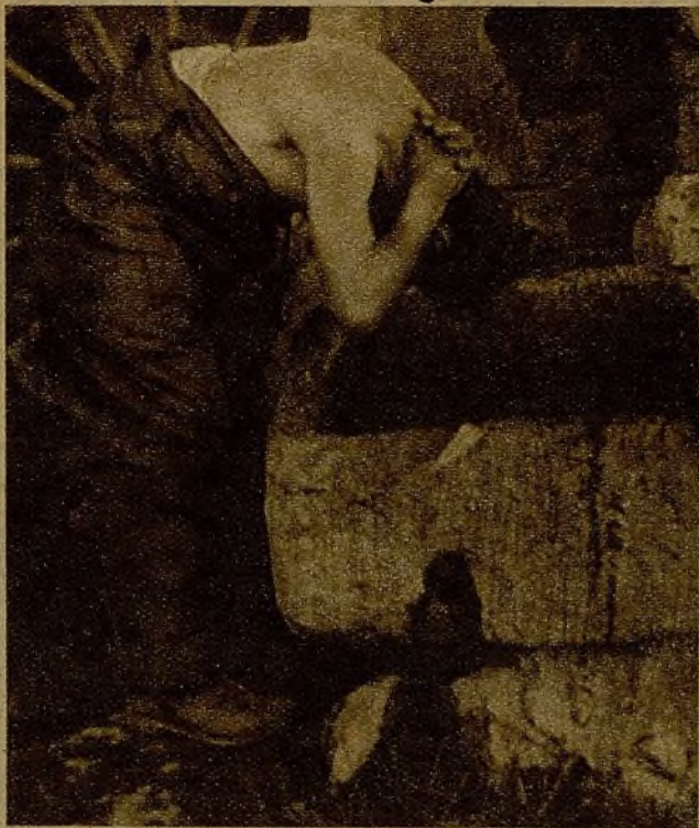
En cualquier parte encuentran los milicianos elementos para el aseo personal. El chorro de una fuente proporciona una benéfica ocasión para refrescarse y eliminar el cansancio