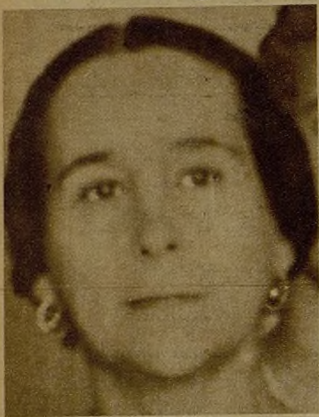
Doña Isabel Oyarzábal de Palencia, nombrada ministro plenipotenciario de España en Estocolmo