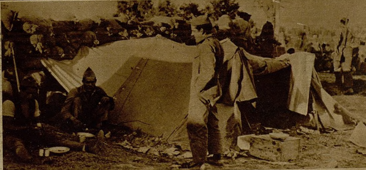
Un alto en la lucha. Los combatientes, siempre animosos, conversan, se dedican a pacíficas actividades y otean el horizonte, en torno a la tienda de campaña

Nuestros compañeros de Consejo hicieron al capitán de las Milicias Gráficas entrega del obsequio que hacemos a estos grupos todos los trabajadores de esta casa, obsequio consistente en unas cajas de botellas para combatir el frío de la Sierra.