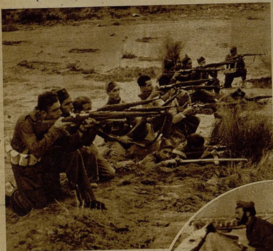
Un grupo de milicianos en la posición conquistada, a pesar del fuerte fuego de la Artillería facciosa, hace descargas cerradas sobre el enemigo, que se retira

(DE NUESTRO REDACTOR EN EL FRENTE JOSE QUILEZ)