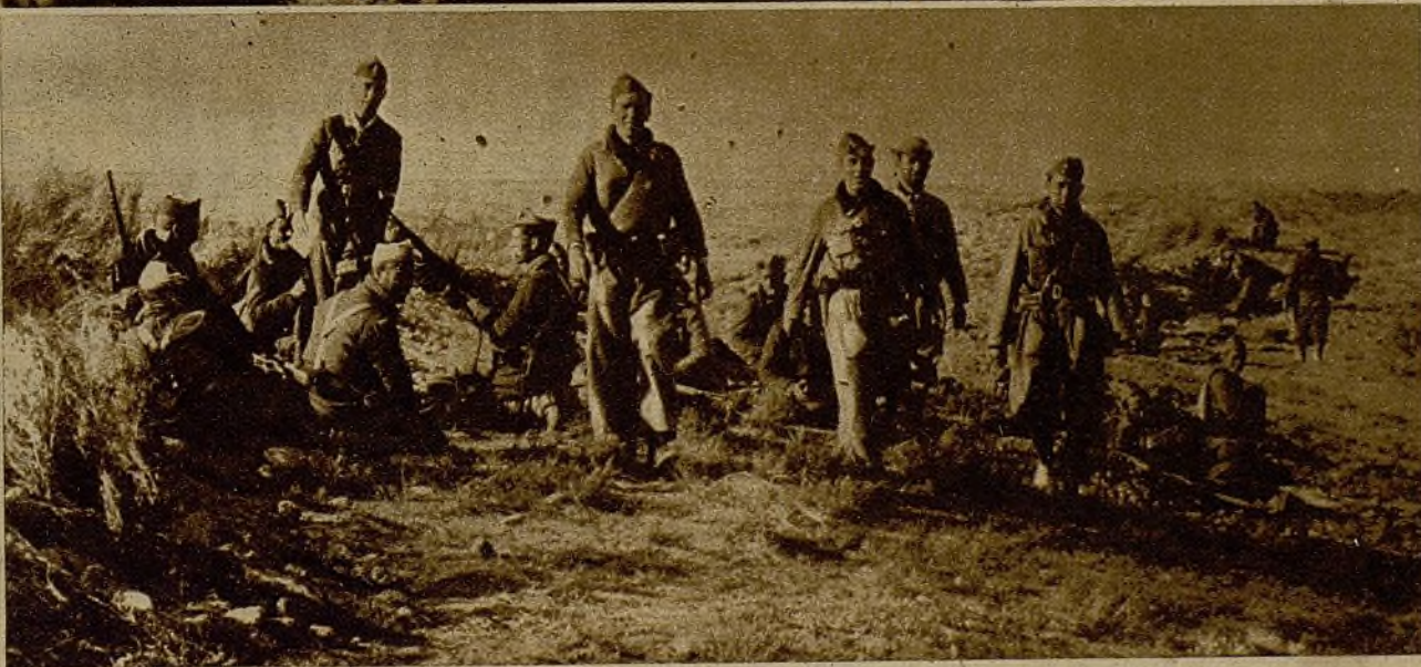
En los rostros de estos milicianos se refleja la satisfacción del triunfo obtenido al ocupar una posición de gran valor estratégico, de la que acaban de desalojar a los facciosos