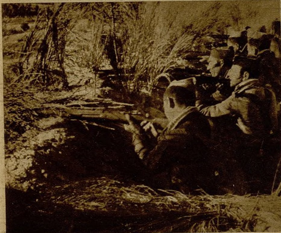
Estos milicianos combaten con absoluta serenidad. Con serenidad que no se quebranta, pese a los audaces intentos del enemigo

camarada respetable miró al cielo. —¿Pasan muchas veces?—preguntó. —Alguna que otra—le contestó un oficial.