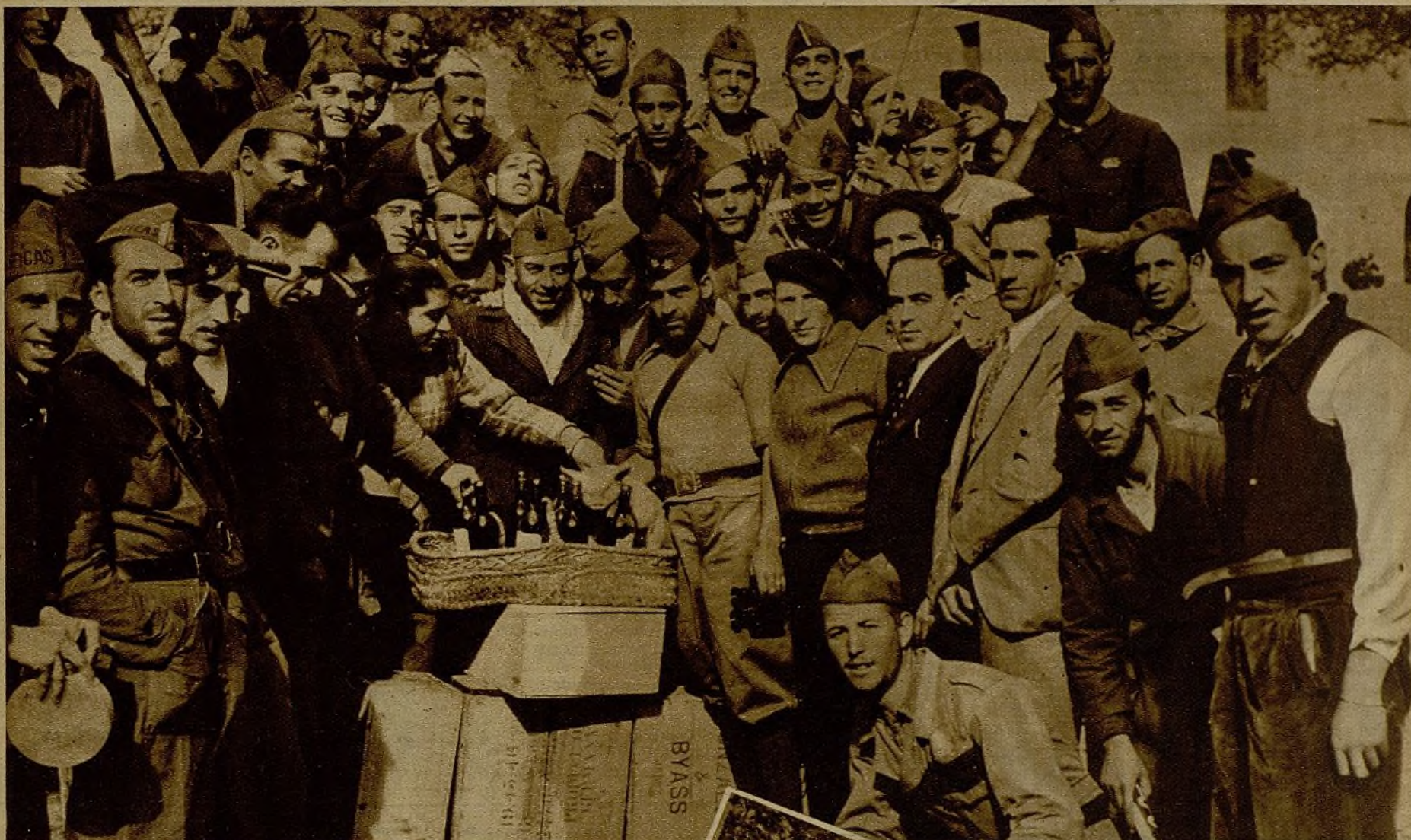
El Consejo Obrero de AHORA se trasladó el domingo a uno de los frentes de la Sierra, con objeto de obsequiar a los valientes milicianos de Artes Gráficas con cajas de vino y ejemplares de nuestro periódico.