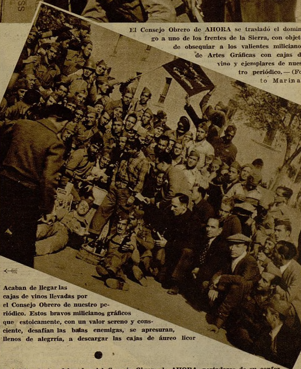
Acaban de llegar las cajas de vinos llevadas por el Consejo Obrero de nuestro periódico. Estos bravos milicianos gráficos que estóicamente, con un valor sereno y consciente, desafían las balas enemigas, se apresuran, llenos de alegría, a descargar las cajas de áureo licor