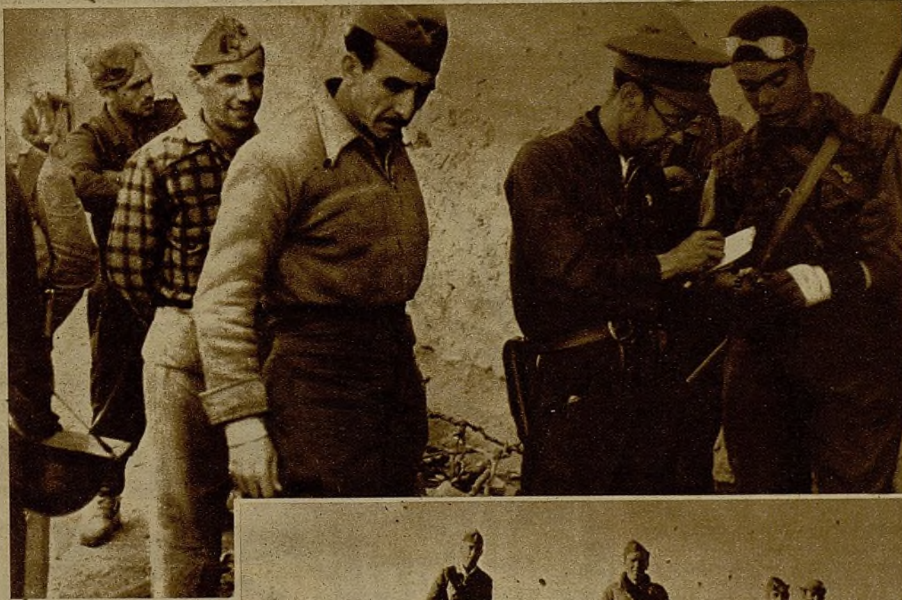
Estos defensores de la legalidad republicana frente a los desmanes facciosos se disponen a regresar a Madrid para disfrutar unos días de merecido descanso, honrosamente ganado. El jefe de las fuerzas extiende a los permisionarios el correspondiente salvoconducto