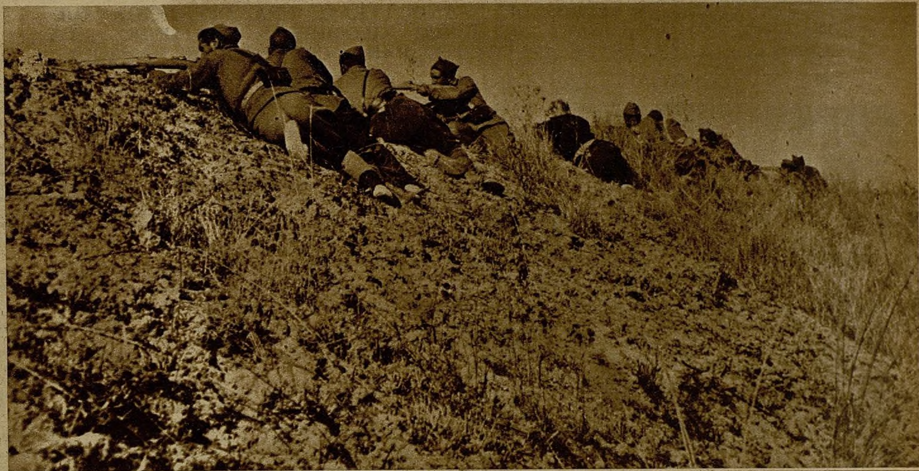
Desde esta loma, admirable posición estratégica, los heroicos soldados de la República baten con insistente fuego de fusil a las hordas fascistas