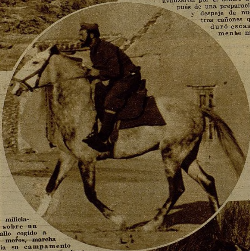
Un miliciano, sobre un caballo cogido a los moros, marcha hacia su campamento

Al amanecer, con tiempo claro y temperatura de primavera, comenzaron las sorpresas en el campo. Nutridos contingentes de Carabineros y guardias nacionales republicanos iniciaron un ataque en el sector de la izquierda con gran aparato de fusilería y ametralladoras. El enemigo comenzó a inquietarse y a contestar con violento fuego de cañón. Casi a la misma hora, guardias de Asalto que formaban dos columnas apoyadas en sus flancos por grupos de Milicias, avanzaron por el centro después de una preparación y despeje de nuestros cañones que duró escasamente me-