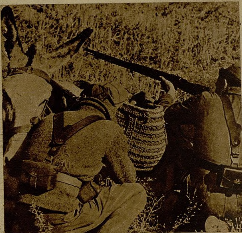
Unos acemileros, atacados por una avanzadilla enemiga, ponen al horriquillo en punto de sacrificio...

Dadas estas características de organización y disciplina que va tomando nuestro ejército no caben en él complacencias