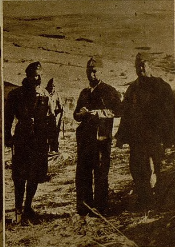
El jefe del esforzado batallón de Riotinto contempla, en unión de otros bravos combatientes, las líneas enemigas