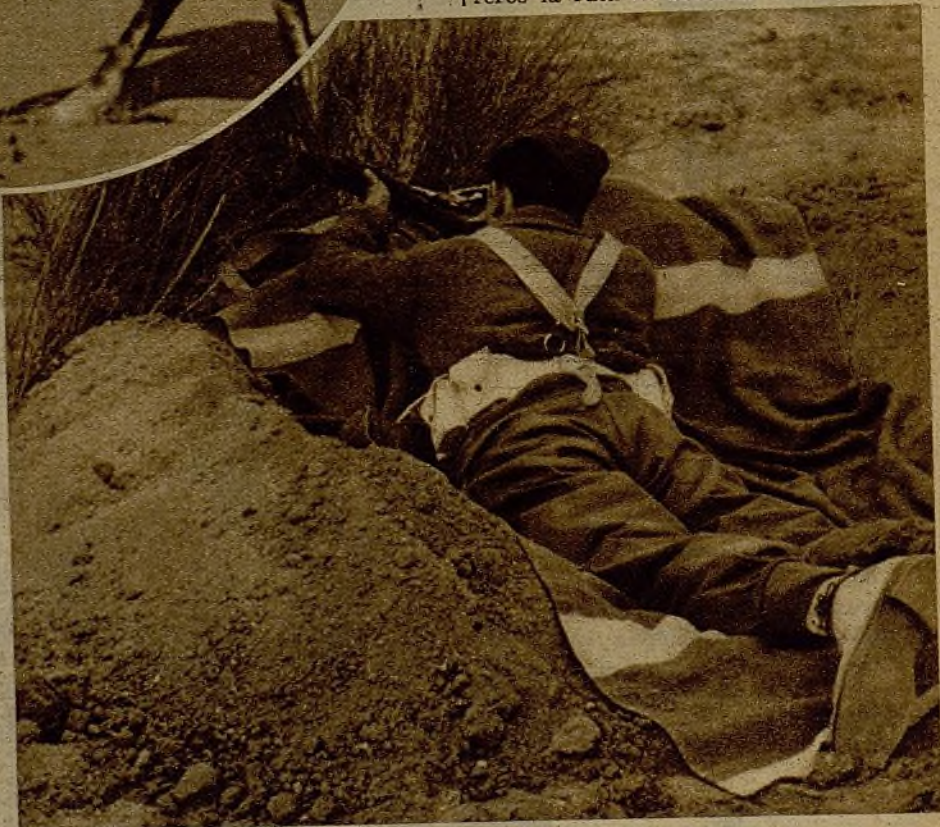
Bajo cualquier amparo accidental o preparado nuestros milicianos hacen puntería sobre las líneas rebeldes

La maniobra de hoy no es decisiva para alejar el peligro de Madrid. Hay que luchar más, muchísimo más. Hay que poner todo el entusiasmo y todo el fervor. El que con un fusil en la mano sepa y quiera defender la República, sepa que han de ser muchos los combates como el de hoy para aplastar al fascismo y cerrar para siempre a sus manadas de aventureros la ruta de Madrid.