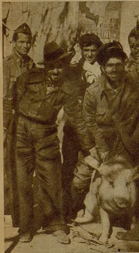
Milicianos con un cerdo que encontraron en una casa de Seseña, después de la dispersión de los fascistas.

No sabemos qué pensará el mando faccioso, ni qué cuentas se hacen los lobos que rondan con las fauces abiertas las cercanías de Madrid. Ayer fué un kilómetro de avance y hoy tres y pico. Poco a poco, avanzan nuestras columnas y buscan emplazamientos más lejanos, hacia la Extremadura, nuestras baterías y nidos de ametralladoras. Sin cesar cam-