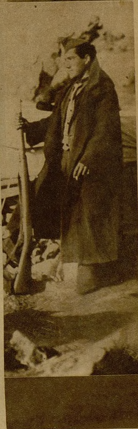
Un miliciano en un parapeto de las montañas de Araya, a 2.000 metros sobre el nivel del mar

y tiene a sus órdenes más de un millar de hombres, que en toda la campaña no han sentido una vacilación ni han dejado que el odioso fascista avance ni un palmo más de terreno.