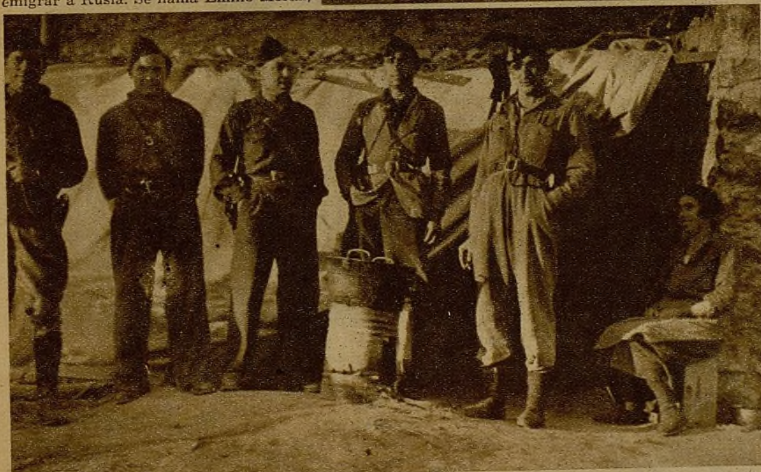
Un comandante y varios capitanes del frente de Pola de Gordón