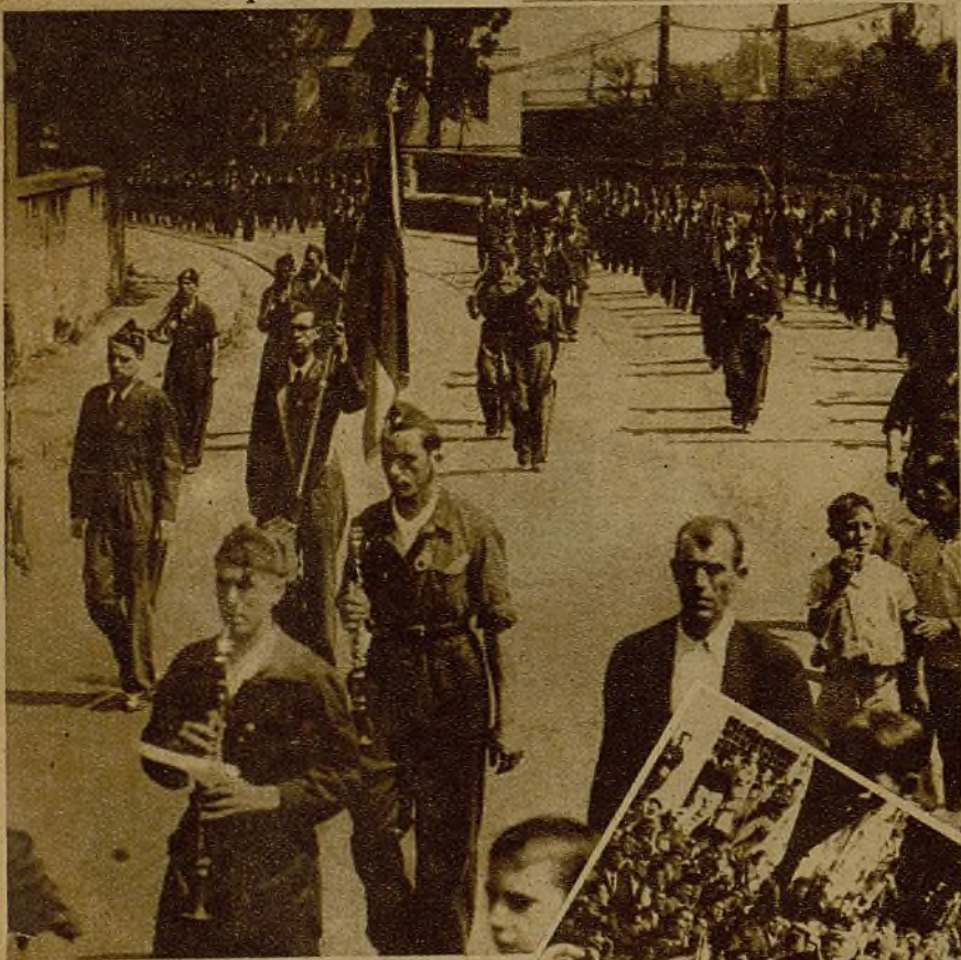
Después de la entrega de su nueva bandera a las Milicias de la Universidad de Deusto, los soldados populares desfilan por las calles de Bilbao