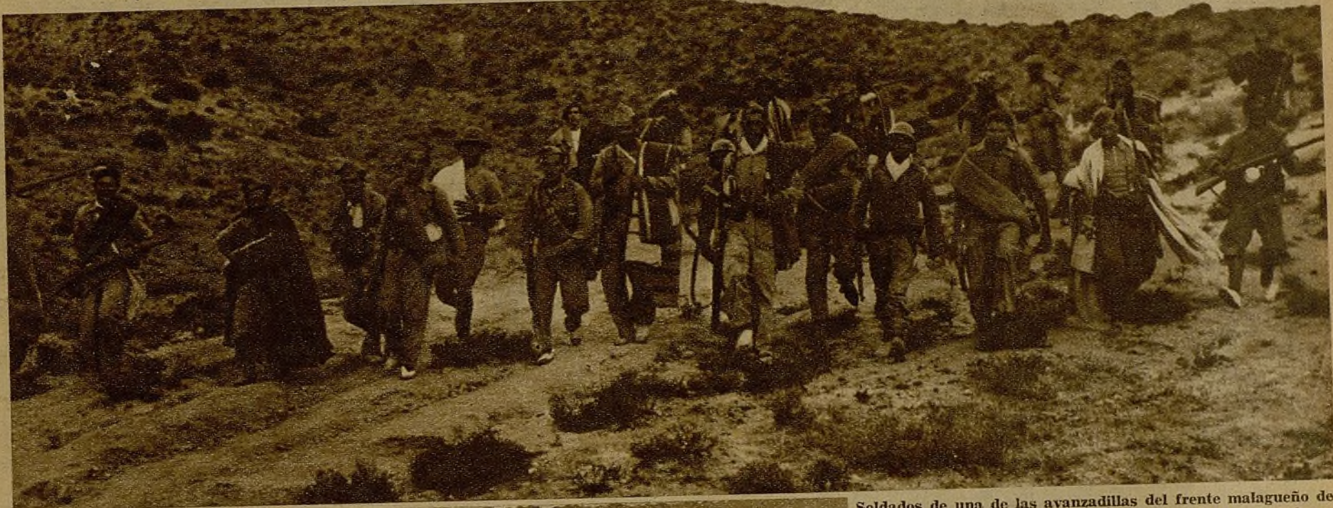
Soldados de una de las avanzadillas del frente malagueño de El Chorro, donde nuestras fuerzas han mantenido inquebrantablemente su resistencia contra las acometidas fascistas, retirándose a su base después del relevo

(PRIMERAS FOTOS RECIBIDAS DE LA LUCHA EN AQUEL SECTOR)