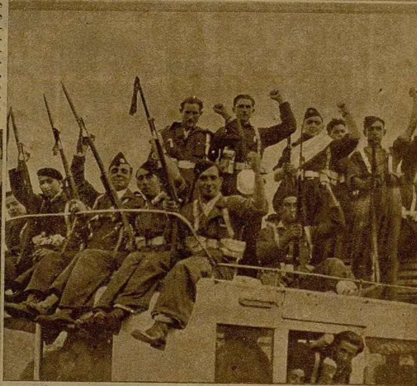
Milicianos vascos, momentos antes de partir para el frente, muestran su entusiasmo y vitorean a la República