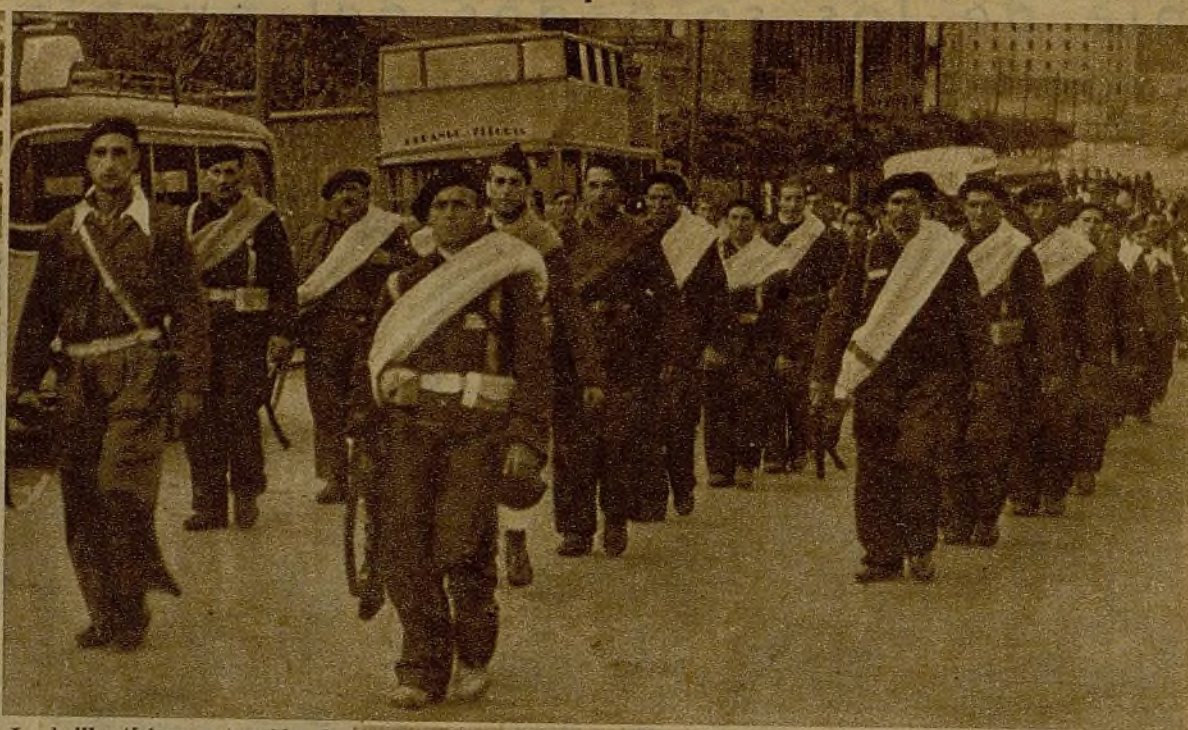
La brillantísima actuación de las columnas enviadas desde Vasconia a los frentes asturianos ha tenido decisiva influencia en la marcha de la campaña en aquel sector, colaborando a la magna empresa, que con los mineros tienen ya casi lograda, de la reconquista de Asturias. El desfile de una de las Milicias