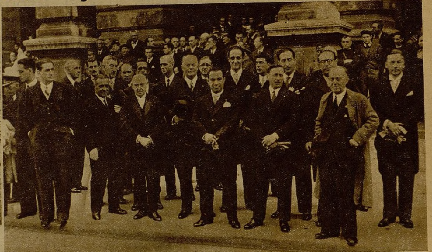
El Cuerpo Consular acreditado en Bilbao presenciando desde la puerta del edificio del Gobierno vasco el paso de los milicianos