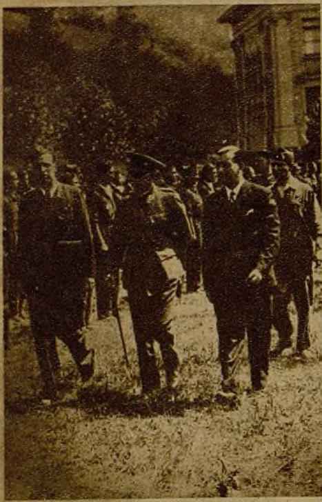
En Bilbao ha tenido lugar la entrega de una bandera a las Milicias universitarias. Las autoridades revistando a las tropas

En medio de vibrante entusiasmo, y con asistencia de una gran muchedumbre, han tenido lugar en Bilbao brillantes desfiles militares