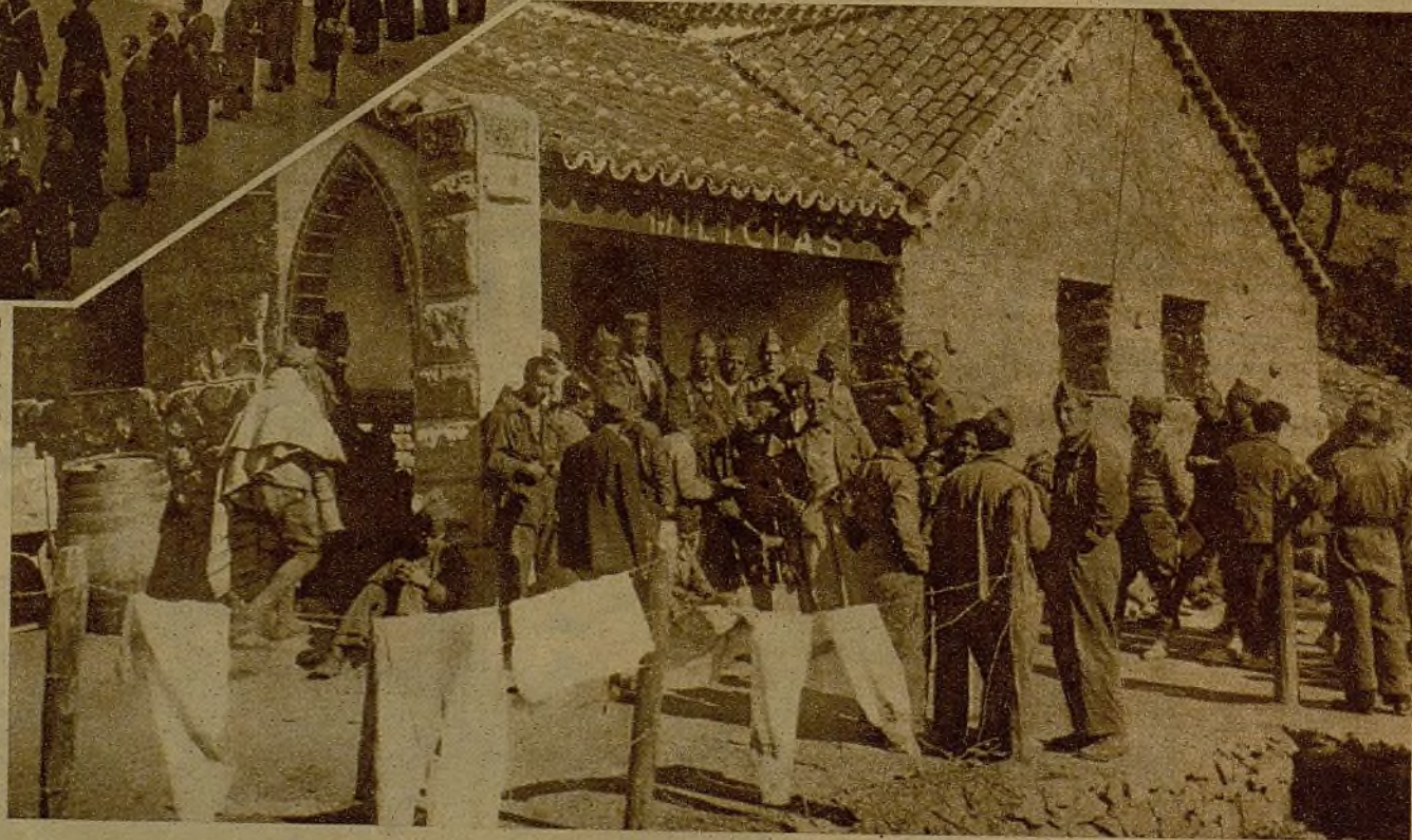
Un grupo de milicianos en descanso a la puerta de la casa de un pueblecito típico, donde han establecido su cuartel