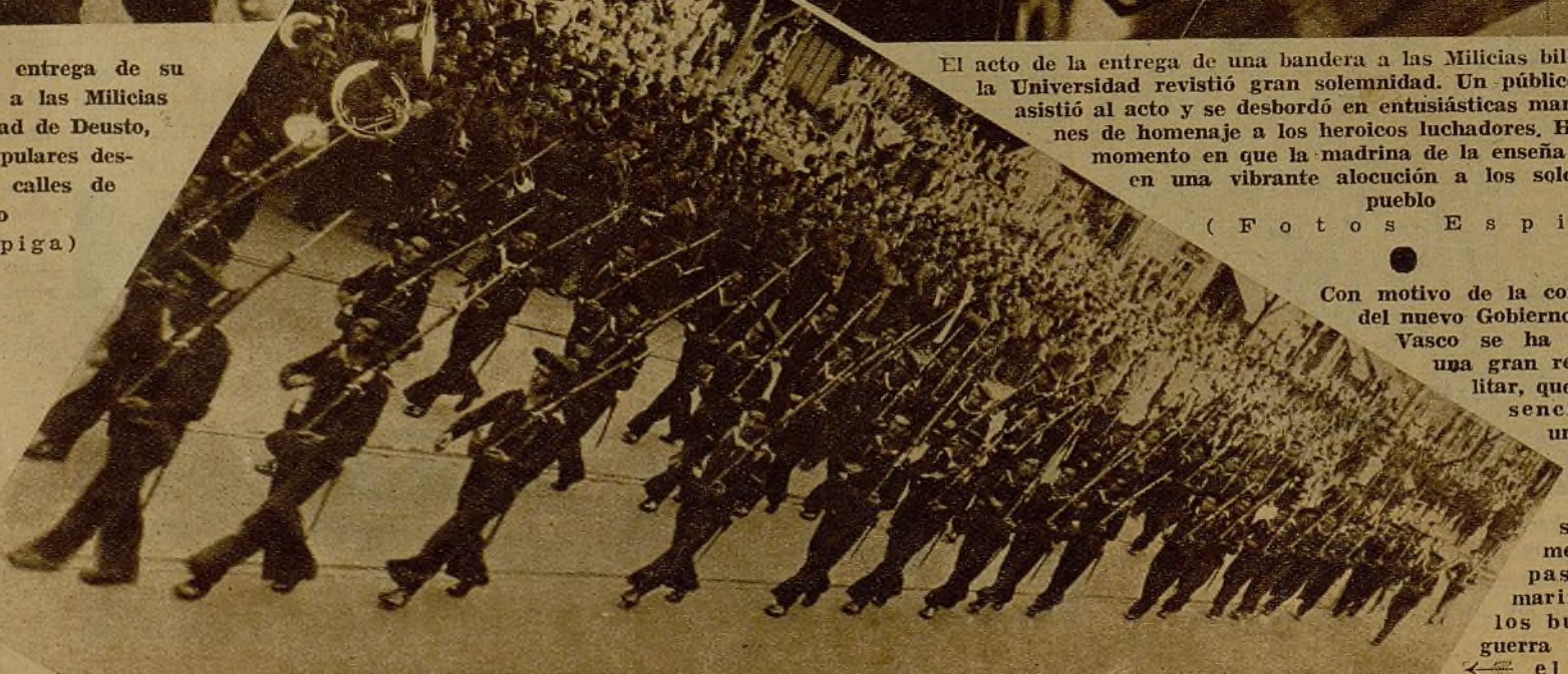
Con motivo de la constitución del nuevo Gobierno del País Vasco se ha celebrado una gran revista militar, que fué presenciada por una inconstable multitud. Véase el momento del paso de la marinería de los buques de guerra surtos en el puerto