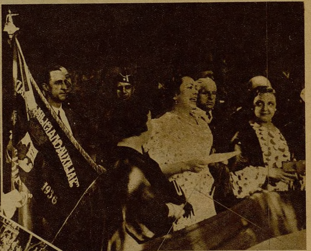
El acto de la entrega de una bandera a las Milicias bilbaínas de la Universidad revistió gran solemnidad. Un público enorme asistió al acto y se desbordó en entusiásticas manifestaciones de homenaje a los heroicos luchadores. He aquí el momento en que la madrina de la enseña se dirige en una vibrante alocución a los soldados del pueblo