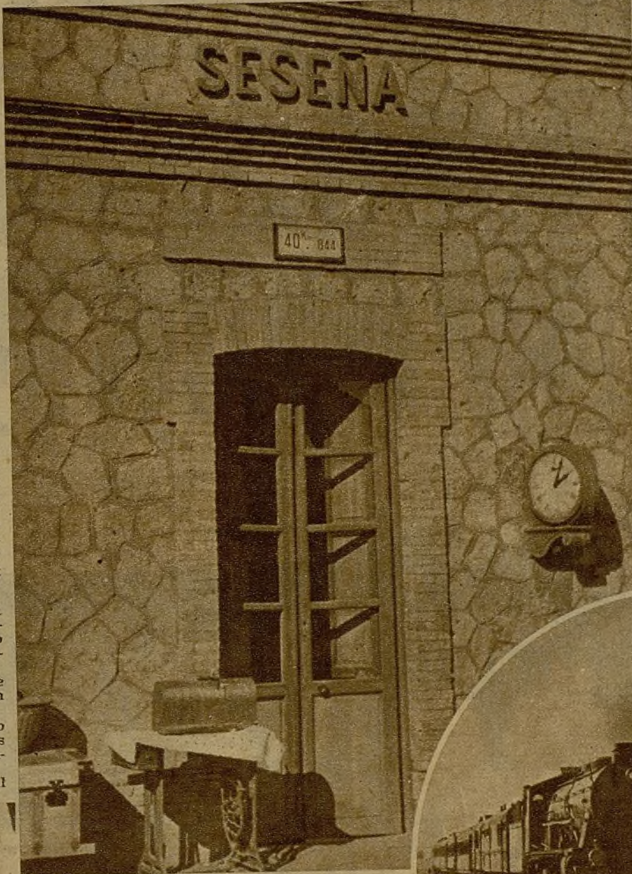
Seseña ha sido tomado por nuestras tropas en un arrollador ataque, en el que han intervenido modernísimos elementos de combate. He aquí la estación del pueblo reconquistado

alto mando, y con él pudimos presenciar de qué manera tan admirable y perfecta desenvolvieron sus movimientos nuestras columnas.