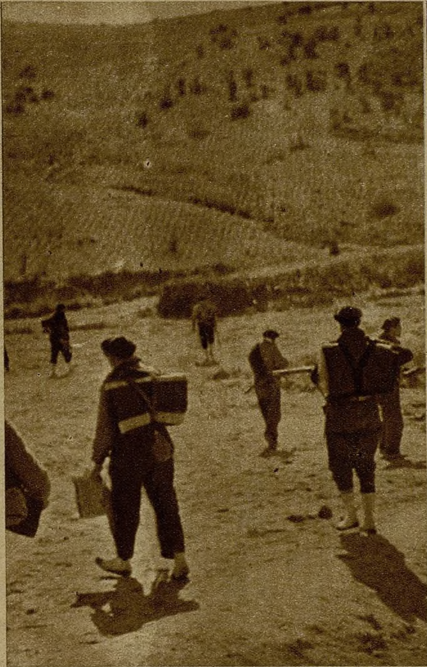
Milicianos patrullando por uno de los puntos de avanzada en el sector del Centro, a la hora de la descubierta