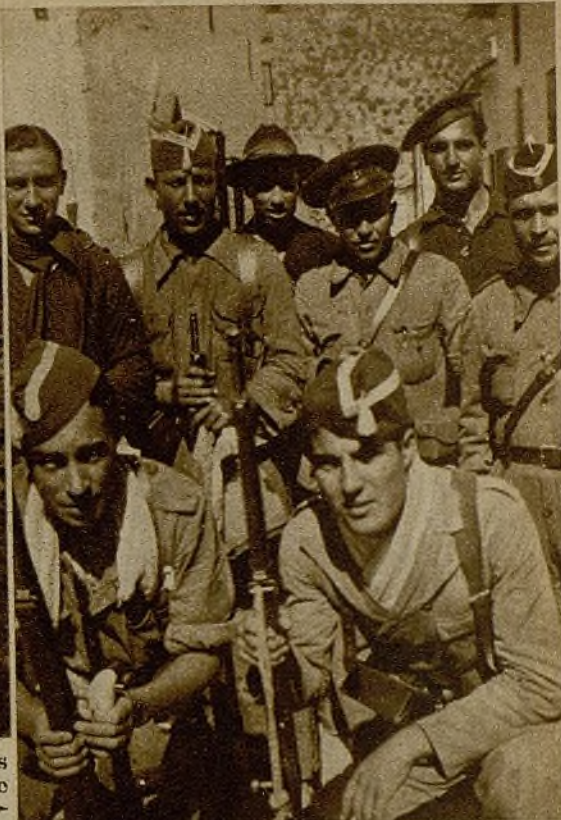
Soldados que se han distinguido notablemente en las operaciones realizadas en los últimos días en el frente de Iznalloz