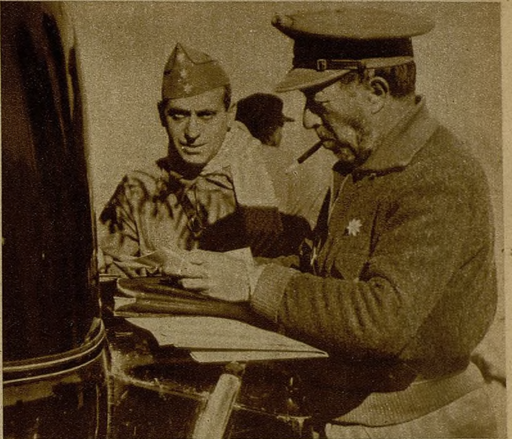
Uno de los comandantes de nuestras fuerzas en la línea del Tajo, examinando sobre el plano el terreno de operaciones