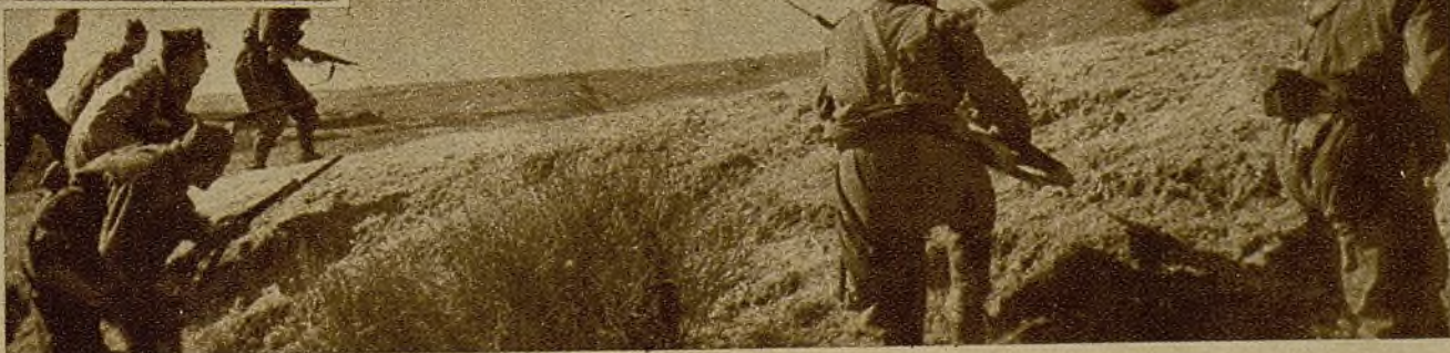
Soldados de la Guardia Nacional Republicana avanzan con la bayoneta calada para posesionarse de unas lomas, en las que los facciosos habían opuesto obstinada resistencia