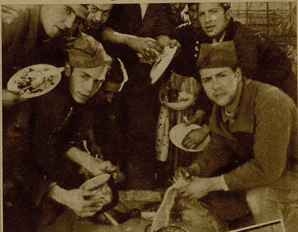
Tras de satisfacer el apetito, los alumnos han de trabajar un poco. El fregado, que dejará limpios platos y cacerolas para la comida de la tarde