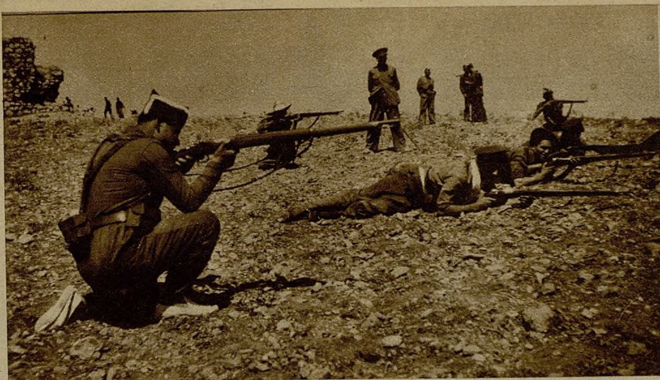
Después de uno de los avances, situados ya en las posiciones que horas antes había ocupado el enemigo, los soldados de una sección hacen fuego contra los facciosos