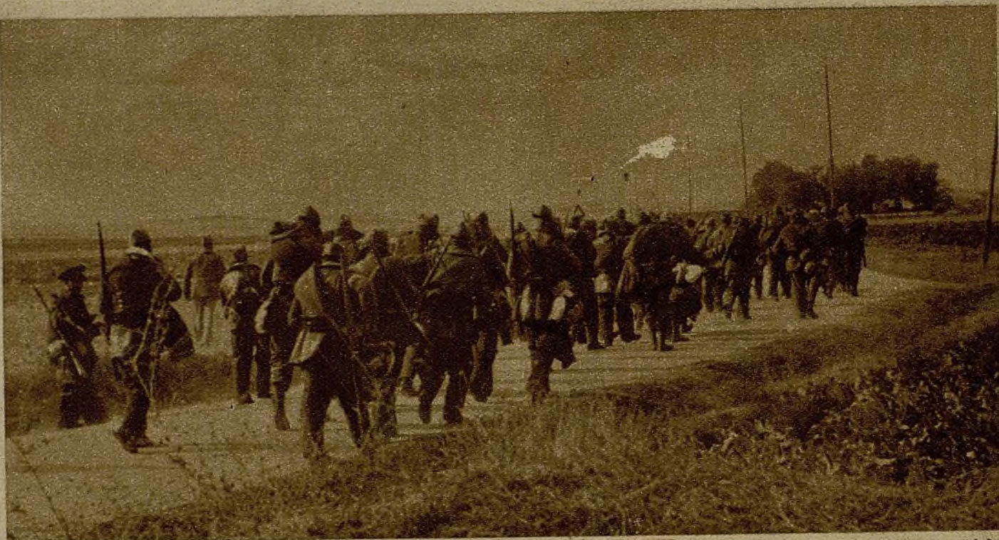
Tropas dirigiéndose a las nuevas posiciones tomadas al enemigo en el sector del Centro

Esta mañana hemos vuelto a atacar. Se cubrieron las grietas del frente—poder de improvisación nos sobra, eso sí—y volvimos al empuje iniciado como si nada hubiese sucedido. Realmente, nada sucedió. Ocorre tan sólo que no hemos sabido educar nuestra moral para una guerra larga y dura, como todas las guerras