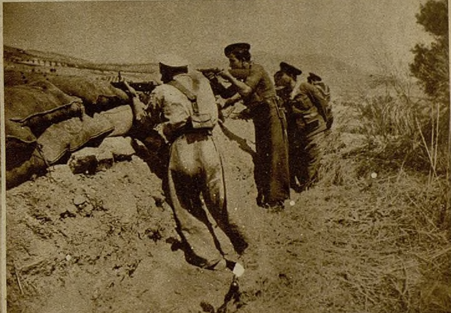
Todos los esfuerzos de los facciosos por vencer la resistencia de nuestros milicianos, que pelean con singular arrojo en el frente granadino, se estrellan sistemáticamente ante nuestra moral y nuestro empuje. Los defensores de una trinchera hostigan al enemigo, en retirada