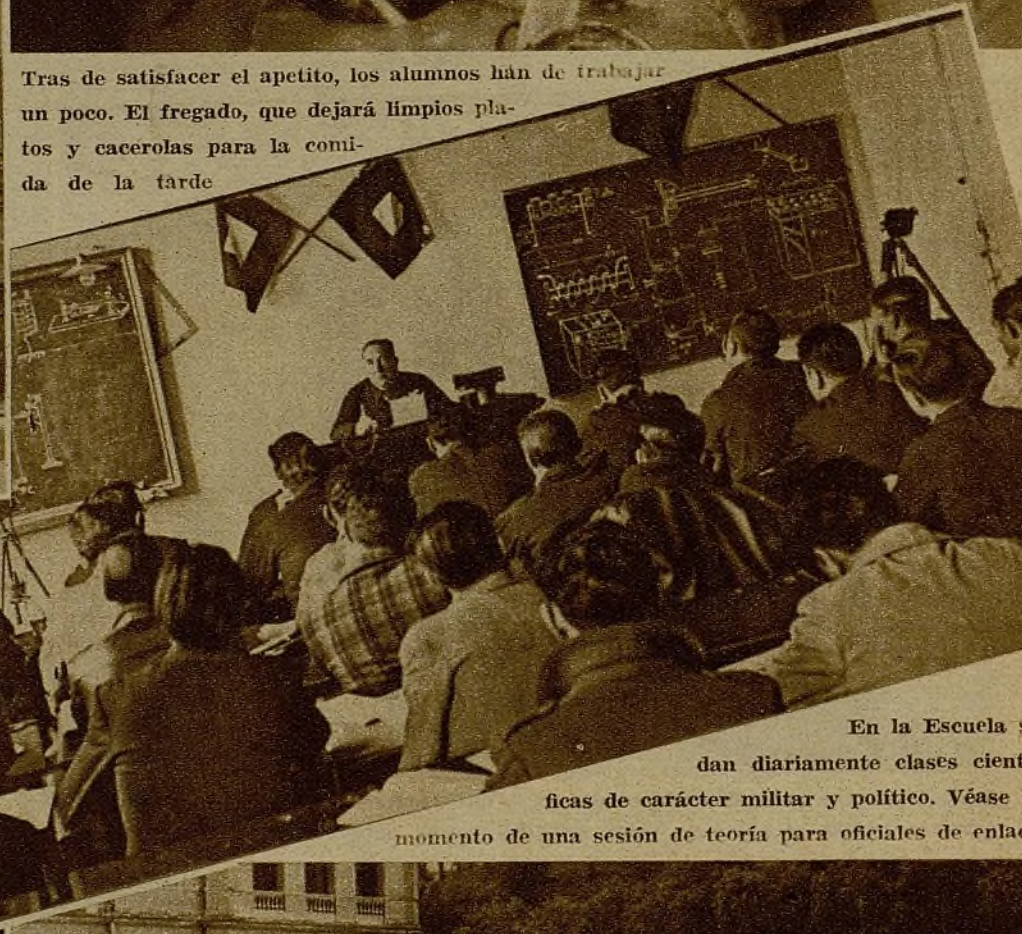
En la Escuela se dan diariamente clases científicas de carácter militar y político. Véase el momento de una sesión de teoría para oficiales de enlace