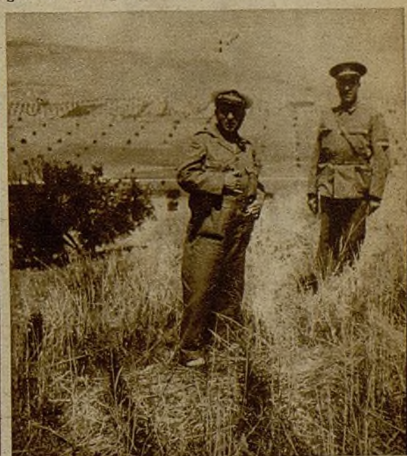
Los jefes de una compañía que opera en el sector granadino, presenciando el curso de las operaciones