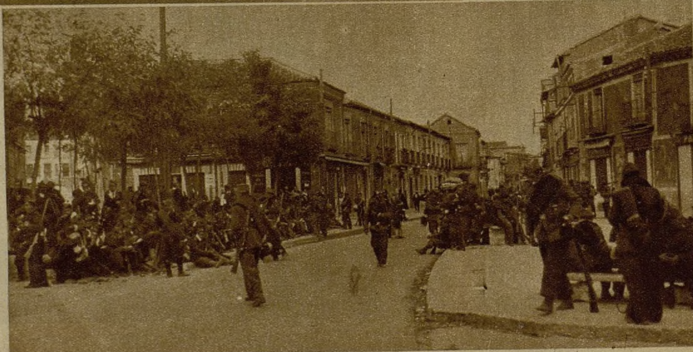
Soldados que regresan del frente, en un alto de la marcha, a la llegada a uno de los pueblos del tránsito

En la orden general se les dijo que los elementos no eran nada si fallaba el hombre. Ténganlo presente los milicianos si en realidad quieren aparecer dignos de su clasificación de luchadores de van-