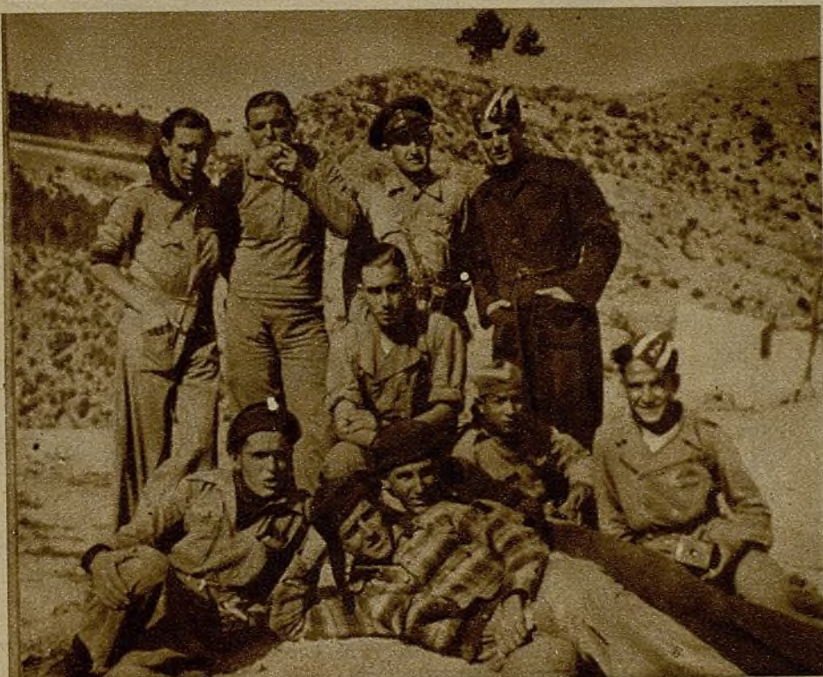
Después de una mañana accidentada, en la que hubieron de emplear su valeroso esfuerzo contra el enemigo, estos soldados posan, satisfechos, ante el objetivo