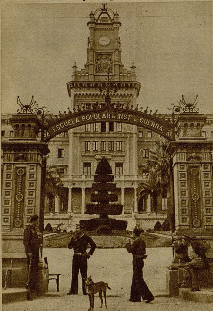
Desde hace unas semanas funciona con toda actividad la Escuela Militar de Barcelona, donde los hombres de la retaguardia se preparan para la lucha. El edificio, que antes estuvo empleado como Colegio de sacerdotes