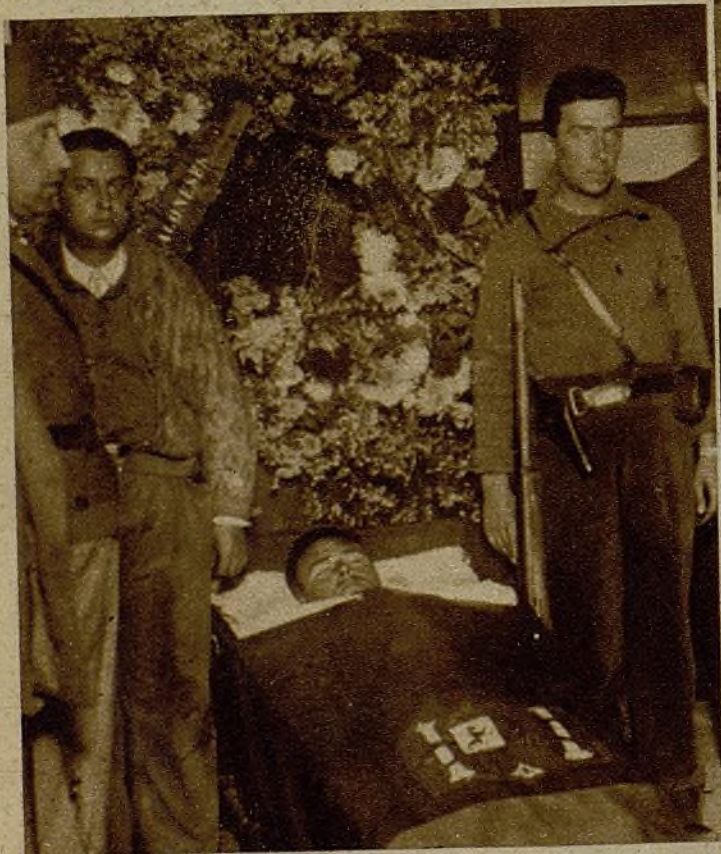
El cadáver del heroico capitán de las Milicias Aragonesas, víctima del fuego fascista en uno de los últimos combates, en la cámara ardiente instalada en el cuartel general de aquella organización

Jóvenes trabajadoras de los talleres de la Casa de Aragón, con ramos de flores para rendir el último tributo al capitán de las Milicias de aquella región, caído en el sector de Si- guenza