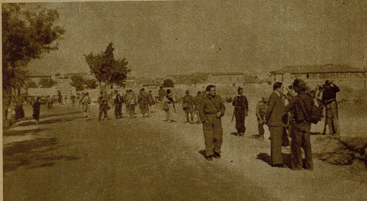
Soldados llegados del frente de combate, en las calles de uno de los pueblos de la retaguardia

y, tal vez más que ninguna, sujeta a alternativas de toda índole.