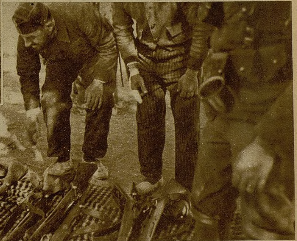
Varios milicianos eligiendo armas entre las cogidas al enemigo en uno de los últimos combates y que los facciosos abandonaron sobre el campo en su precipitada huida