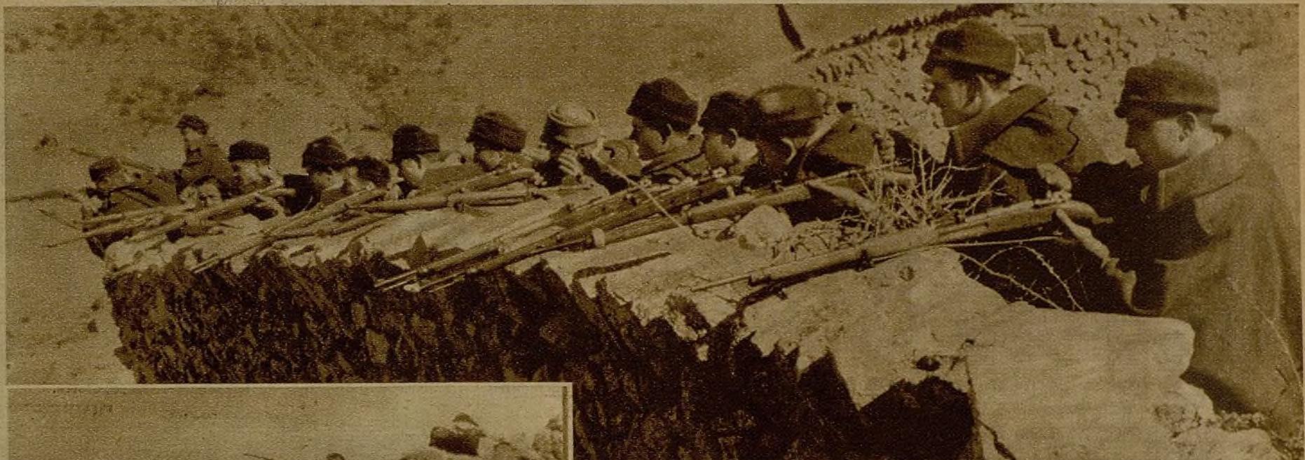
Resguardados en sus parapetos, estos soldados del Ejército popular hacen descargas certeras, protegiendo un avance envolvente contra las posiciones rebeldes

Nuestros soldados, en la Sierra, siguen dando un admirable ejemplo de resistencia y contienen bravamente a los rebeldes