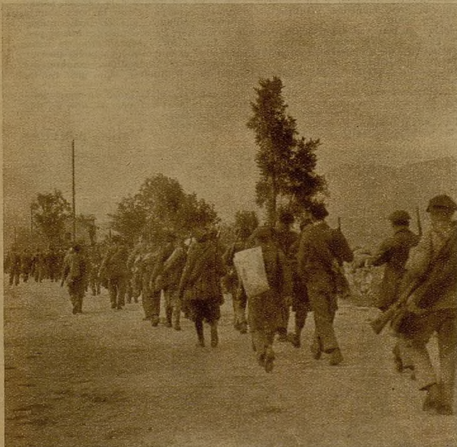
Columnas de milicianos, por la carretera de San Esteban de la Cruz, en marcha hacia Oviedo

ron tras heroica resistencia, hace justamente un mes. Y allí quedaron detenidos, siendo inútiles todos sus esfuerzos para avanzar un palmo más de terreno. Extendieron el frente, intentaron filtrarse por diversos sectores. Pero los brillantes estrategias del sable a rastras olvidaban, sin duda, que al presentar una línea de fuego que llegó a medir hasta ocho kilómetros su acción se debilitaba en todo el frente y en ningún sitio podían desarrollar una acción enérgica.