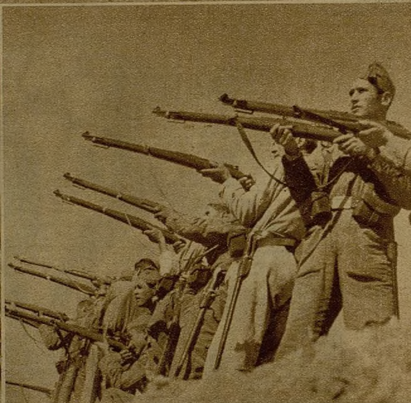
La actitud serena ante el peligro es indicio seguro de la victoria. Firmes en sus puestos de combate, son los milicianos una bella promesa de triunfo

Fijos los ojos, atenta la puntería, convencidos de que el lugar que ocupan debe ser defendido a toda costa, estos defensores de la causa popular se aprietan en la trinchera para concentrar su afán ofensivo