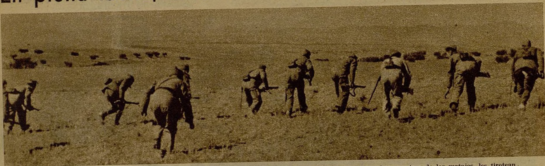
Ante el terreno descubierto que hay que tomar a pecho libre, las guerrillas se lanzan contra los emboscados que, tras de los matojos, les tirotean.