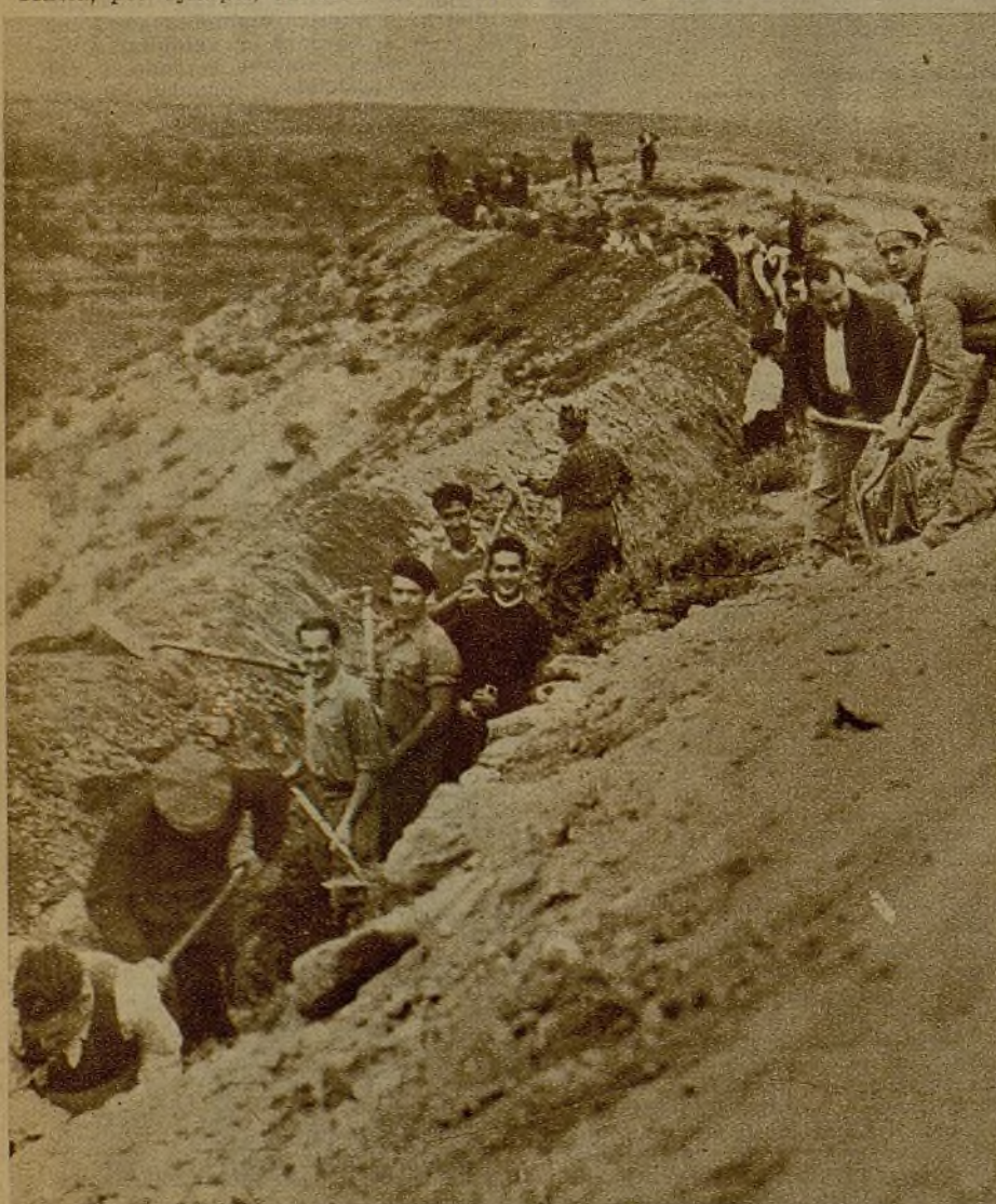
Nuestros obreros voluntarios trabajan afanosamente, en todas las horas que su labor diaria les deja libres, en la construcción de trincheras

La pala y el pico son también armas de combate. Nuestros hombres de la retaguardia garantizan la defensa de la ciudad