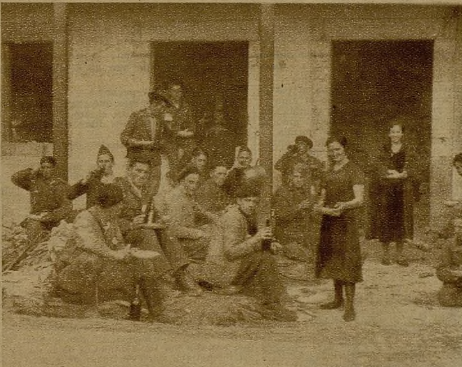
En uno de los barrios de Oviedo, que ya nuestra ofensiva ha puesto a cubierto del fuego de los facciosos, los soldados almuerzan, en completo ambiente de normalidad

Además del buen espíritu y de la acometividad en el ataque de las Milicias asturianas, contamos, para vencer, con la torpeza estratégica del enemigo. Para romper el cerco de Oviedo los traidores organizaron hasta cinco columnas, de las que ya he hablado en otras informaciones, que avanzaron por Galicia y León con el ánimo de acudir a las desesperadas llamadas de Aranda. Comenzaron este avance en los primeros días de agosto y únicamente las de Galicia lograron aproximarse a su objetivo. Tardaron más de dos meses y medio y, sin exageraciones, puedo atestiguar, porque lo he visto, que les costó muchas más vidas, en total, que el número de componentes de la columna. Pero esto no importa a la canalla fascista. Ellos movilizan quintas y hacen levallas para luego llevar a los hombres a combatir bajo la amenaza de unos cuantos dinamiteros que llevan siempre a retaguardia para terminar con los infelices que se niegan a tirar contra sus hermanos. Así, reponiendo las bajas a centenares, llegaron hasta Grado, que toma-