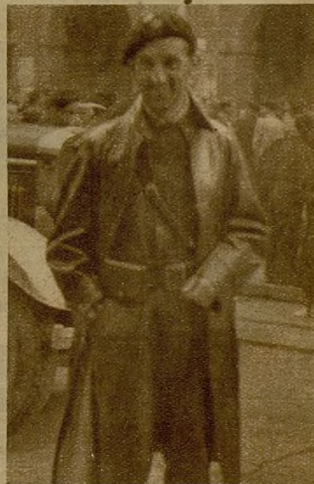
Uno de los jefes de las columnas que operan en Oviedo y que ha destacado su labor en el cuadro heroico de los luchadores