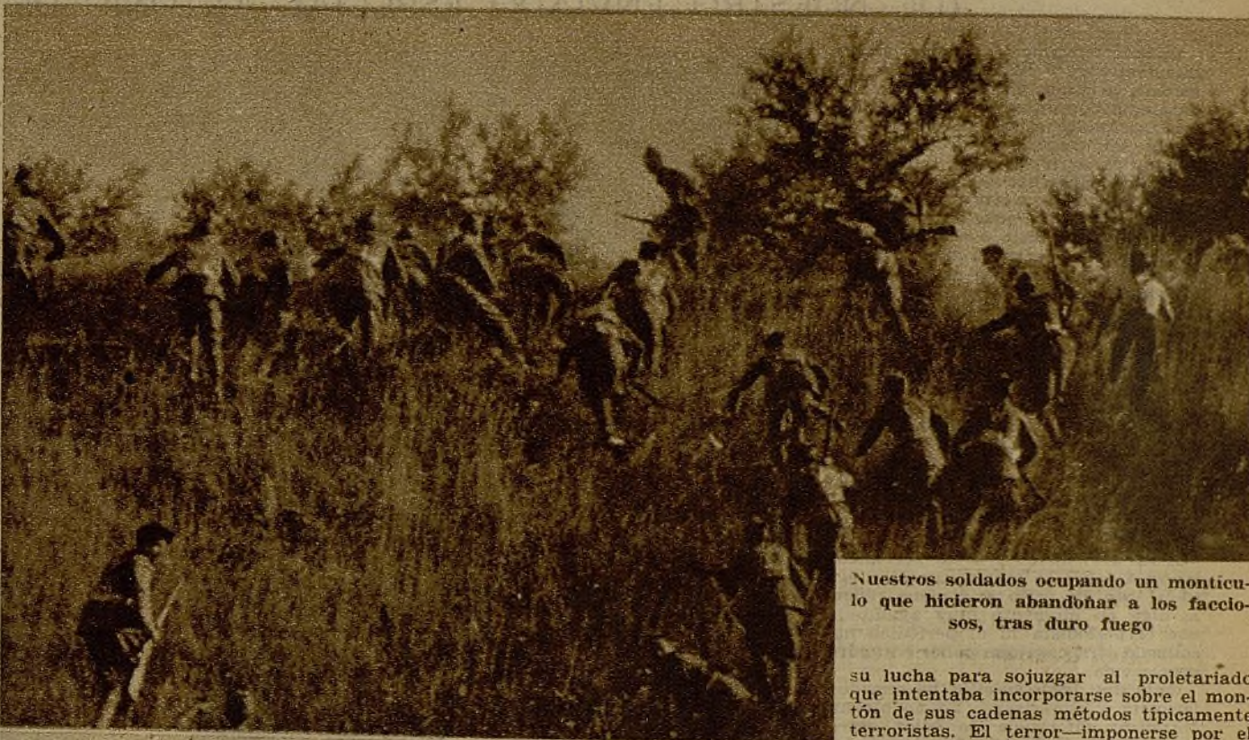
Nuestros soldados ocupando un montículo que hicieron abandonar a los facciosos, tras duro fuego

Protegidos por la cerca de una finca, los milicianos del batallón Numancia hacen fuego contra el enemigo