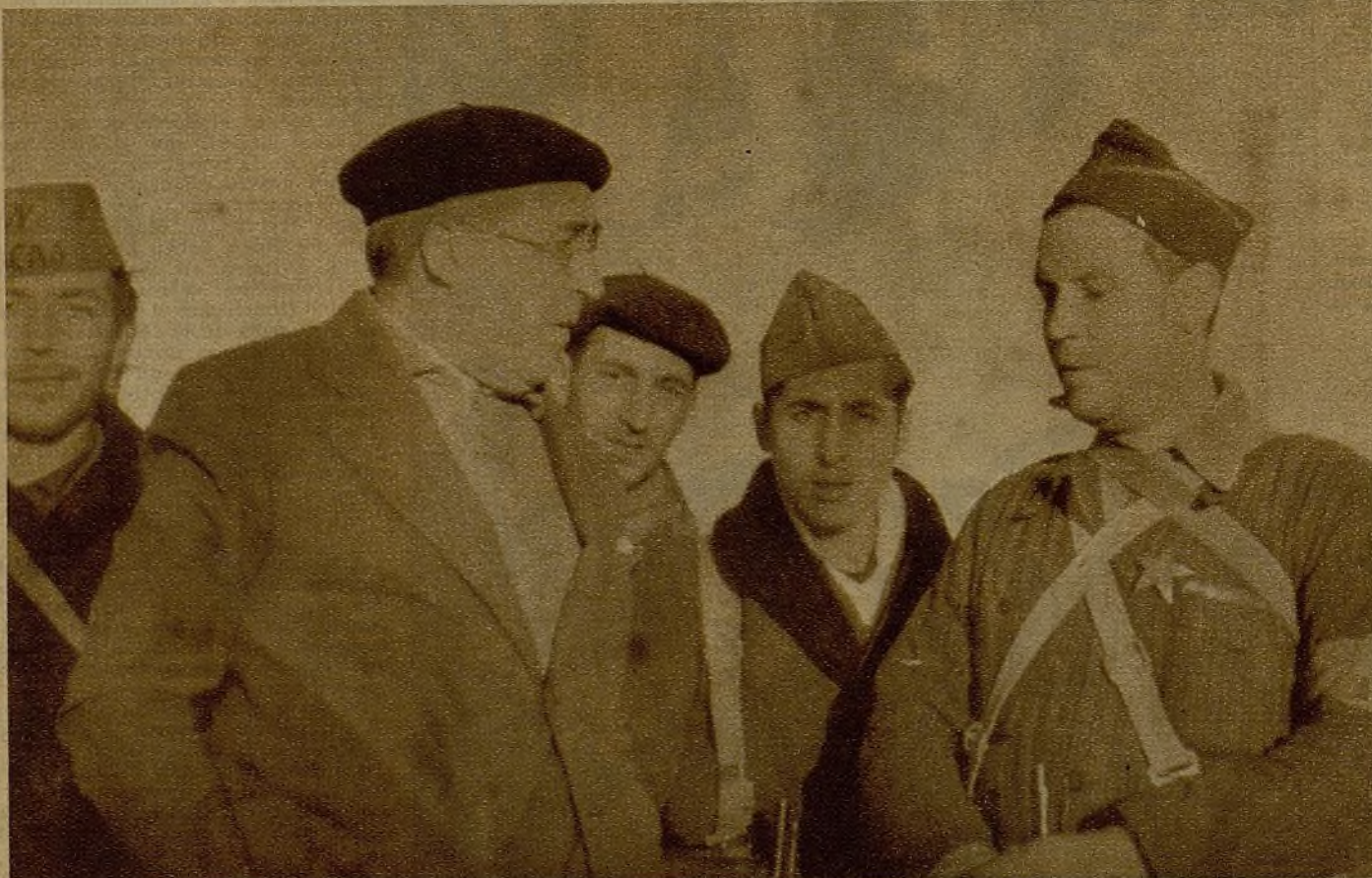
Varios compañeros de AHORA y "Estampa", luchadores en las Milicias Gráficas, hablan con Villa en las líneas de avanzada

Y reparé una vez más que el "Capitán Temerario" es un periodista que del periodismo vive únicamente.