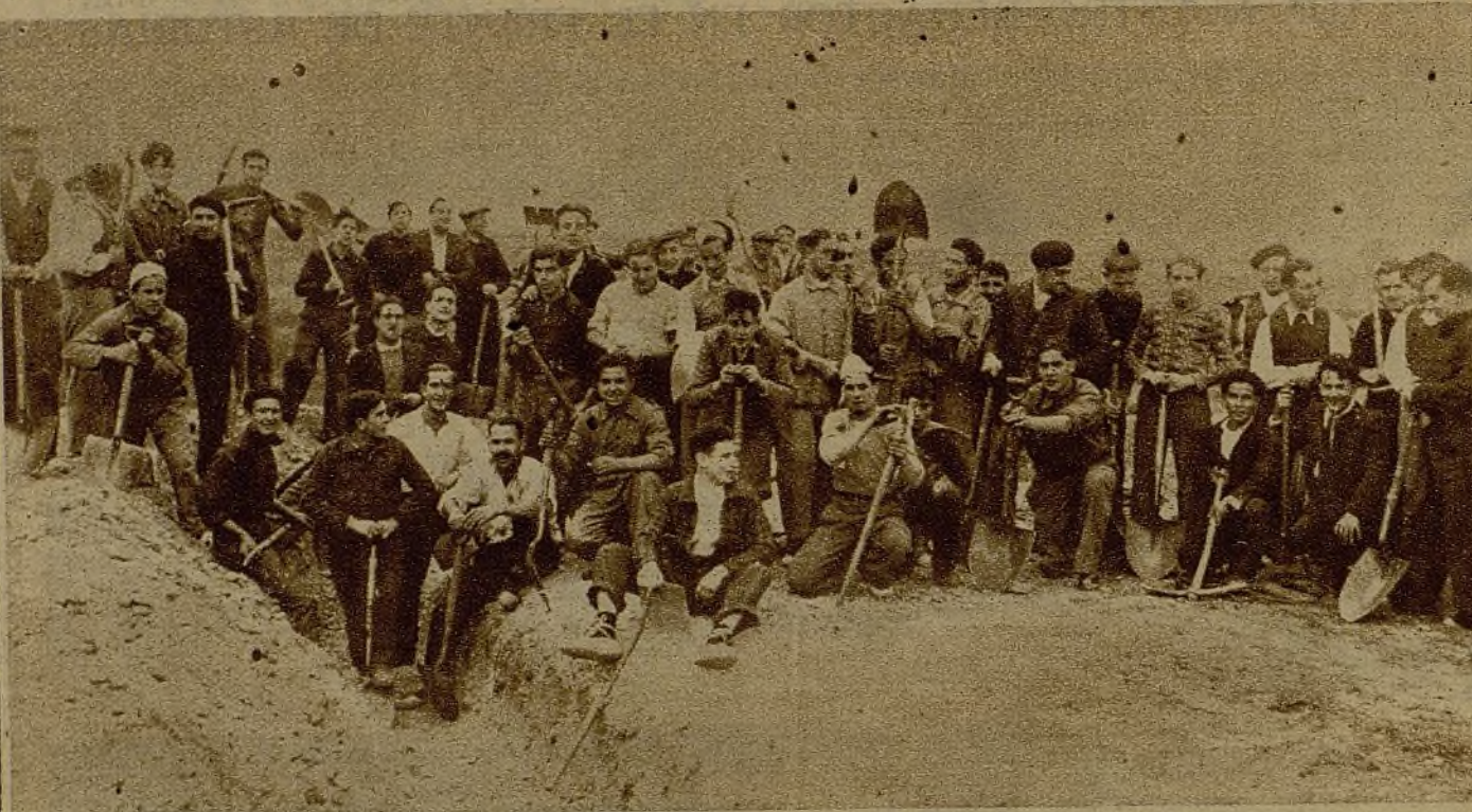
Un grupo de voluntarios colaboradores en la lucha, que después de su faena del día, ponen su afán en construir refugios para los compañeros que han de defender Madrid

ticuatro años que se dedicaba al pastoreo. Por su trabajo cotidiano el amo le pagaba un duro al mes y la comida; en cambio, él tenía que pagarle al amo el alquiler de la choza en que dormía, y este alquiler era de quince duros anuales. Es decir, que al cabo del año el mozo aún le debía al amo quince pesetas. Para pagar esta "deuda" trenzaba esparto y hacía cuerdas.