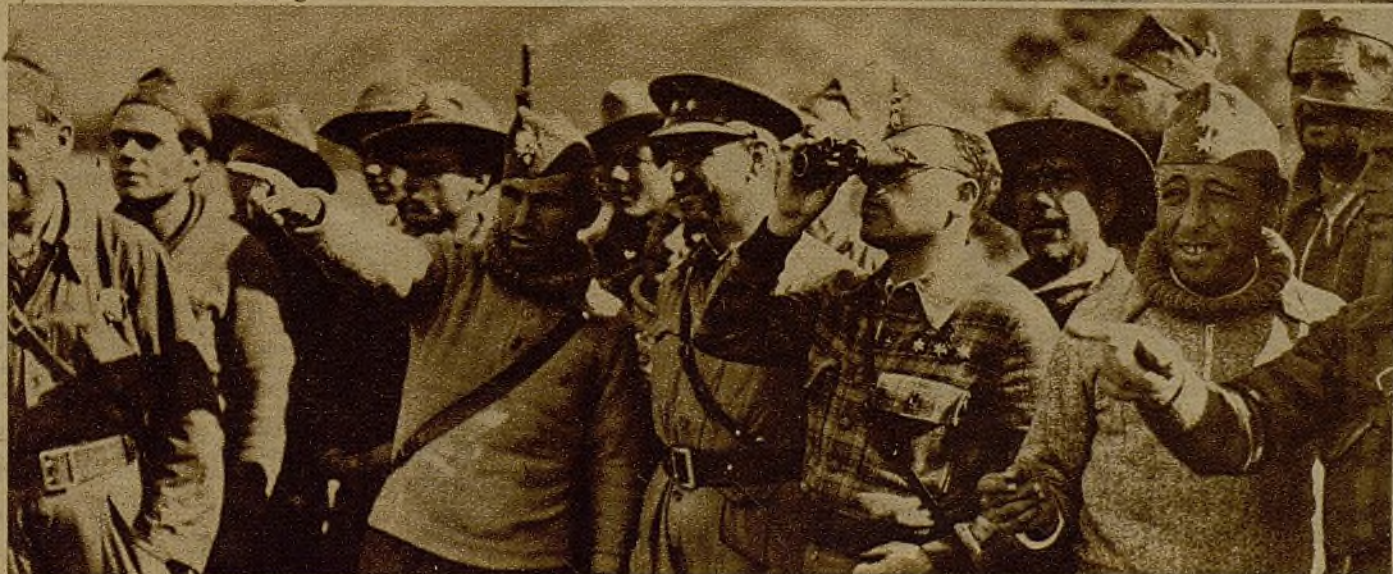
Jefes y oficiales de Milicias presenciando el desarrollo de un combate en las inmediaciones de las avanzadillas

Sólo cabe añadir una frase: Para que este esfuerzo nos traiga en alto la victoria son precisas tres cosas que hemos de forjarlas y cumplirlas todos: organización, serenidad y disciplina.