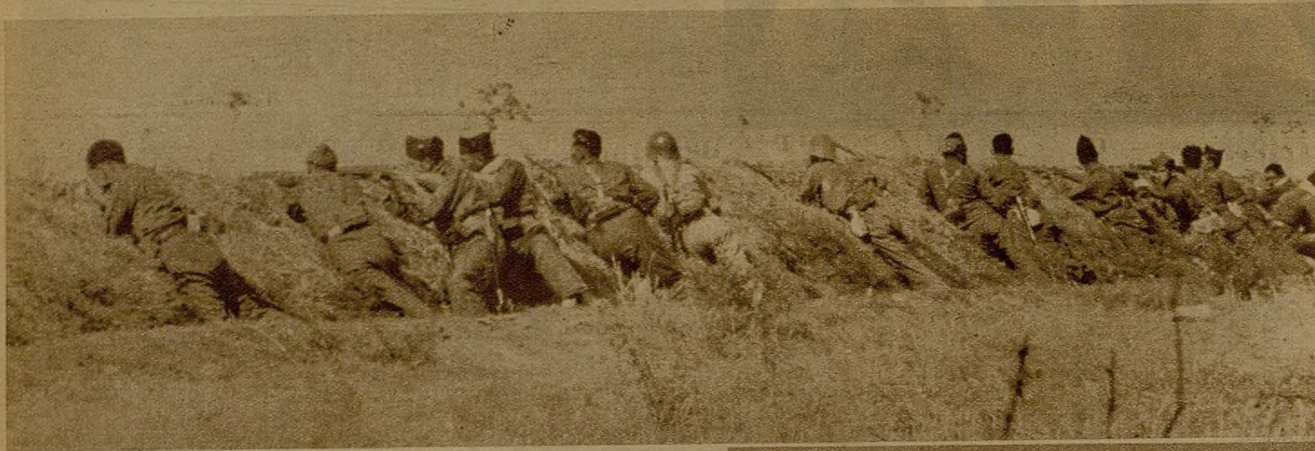
Protegidos por la trinchera, vigilan los milicianos el campo enemigo, atentos siempre a cualquier movimiento de los rebeldes