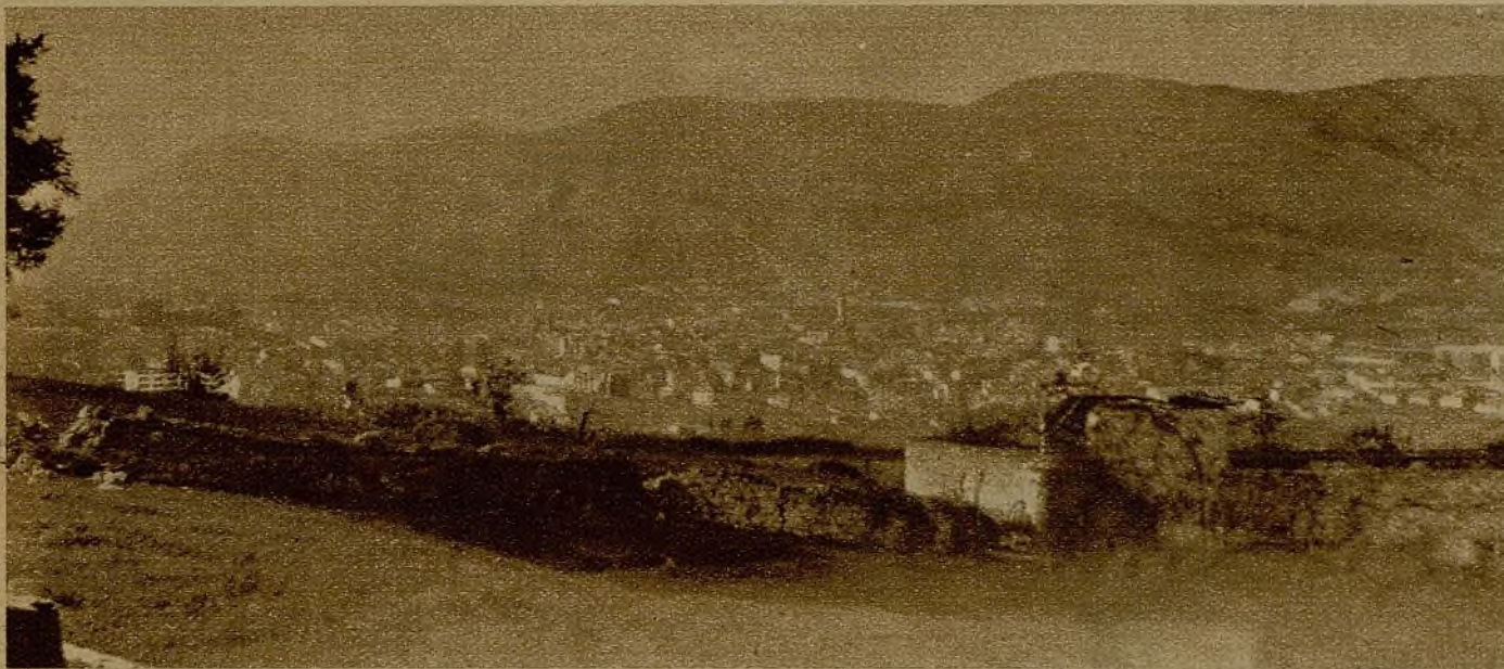
Una vista de la ciudad de Oviedo desde uno de los fuertes establecidos en las cercanías. Al fondo, la formidable posición del Naranco, que constituye la amenaza inminente sobre la capital asturiana

(DE NUESTRO REDACTOR EN EL FRENTE DE ASTURIAS ANTONIO SOTO)