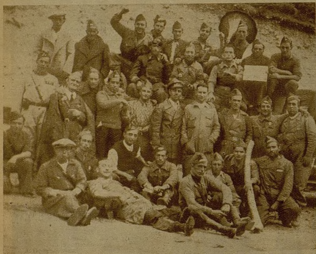
Conductores de los tanques del Ayuntamiento que suministran agua a la línea de fuego