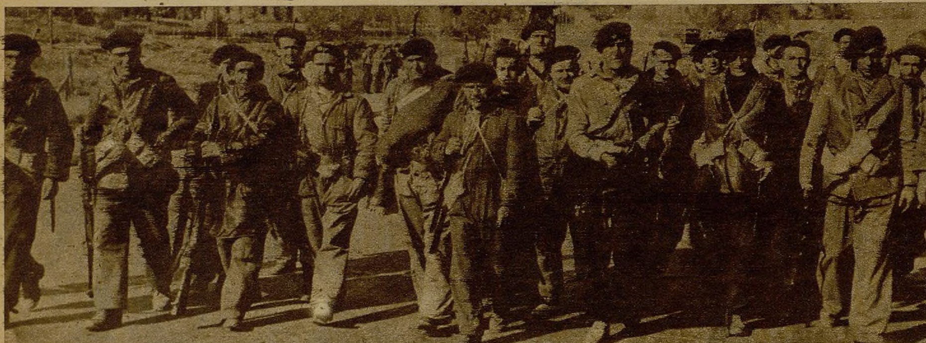
Un grupo de combatientes que forman parte de la columna Internacional, preparados para marchar al lugar indicado por el Mando