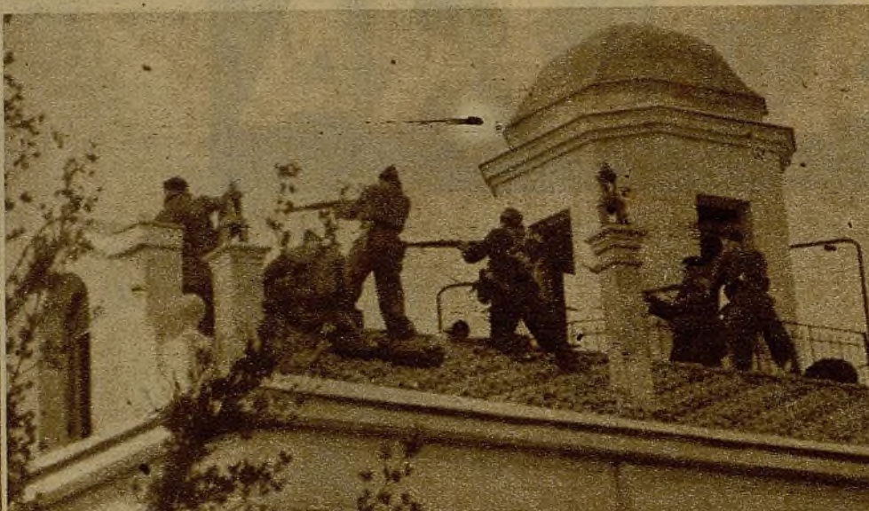
Desde el tejado de un edificio, los milicianos localizan a unos "pacos" fascistas y disparan certeramente sobre ellos