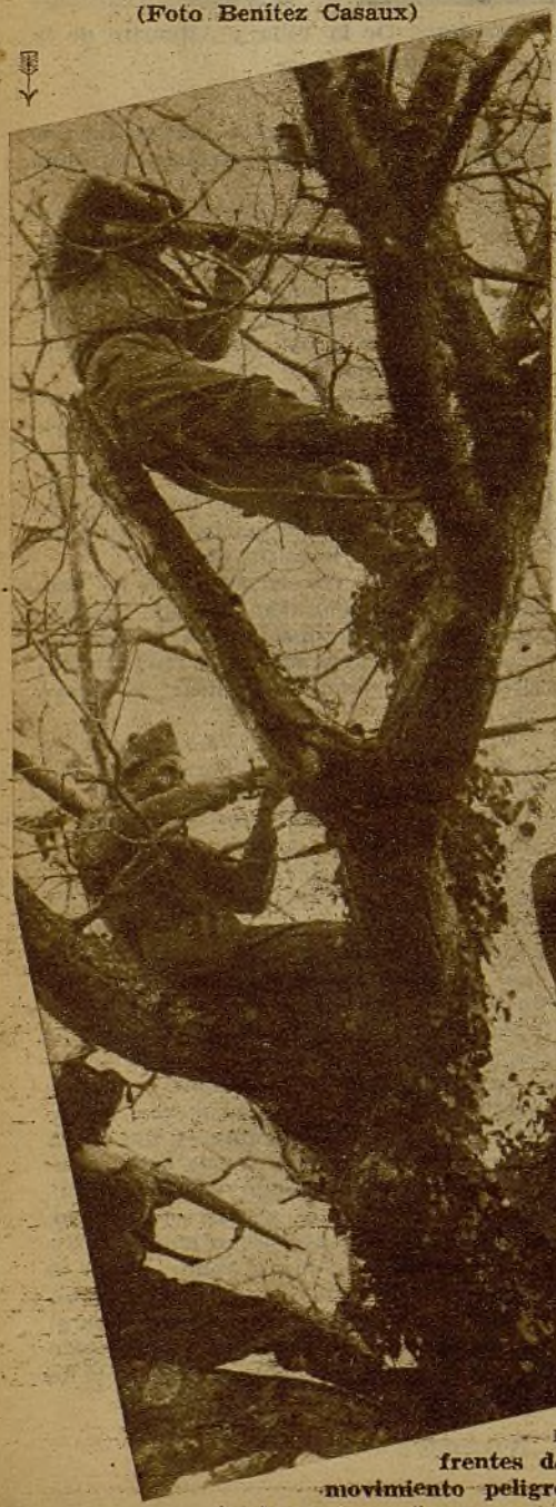
Cada árbol, en el frente madrileño, es un nido de fusilería que está preparado para una ventajosa defensa