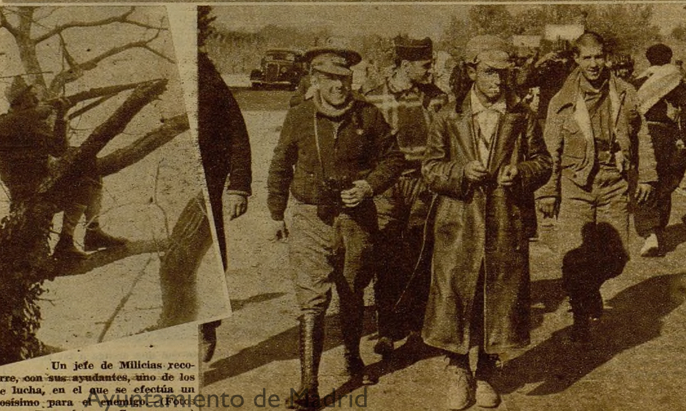
Un jefe de Milicias recorre, con sus ayudantes, uno de los frentes de lucha, en el que se efectúa un movimiento peligrosísimo para el enemigo.