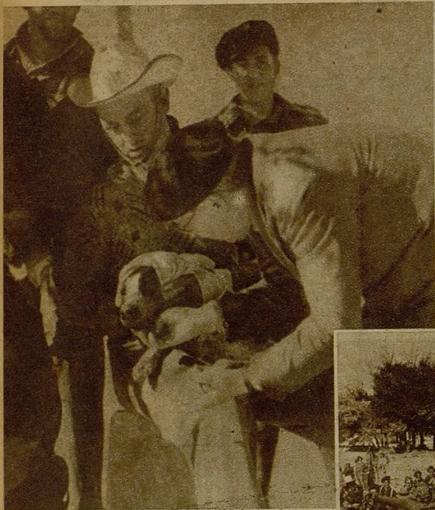
A las avanzadillas del sector Centro llegó moribundo este perro, que llevaba en el cuello una cinta a guisa de collar, en la que iba escrito un saludo a los comunistas que pelean por la República