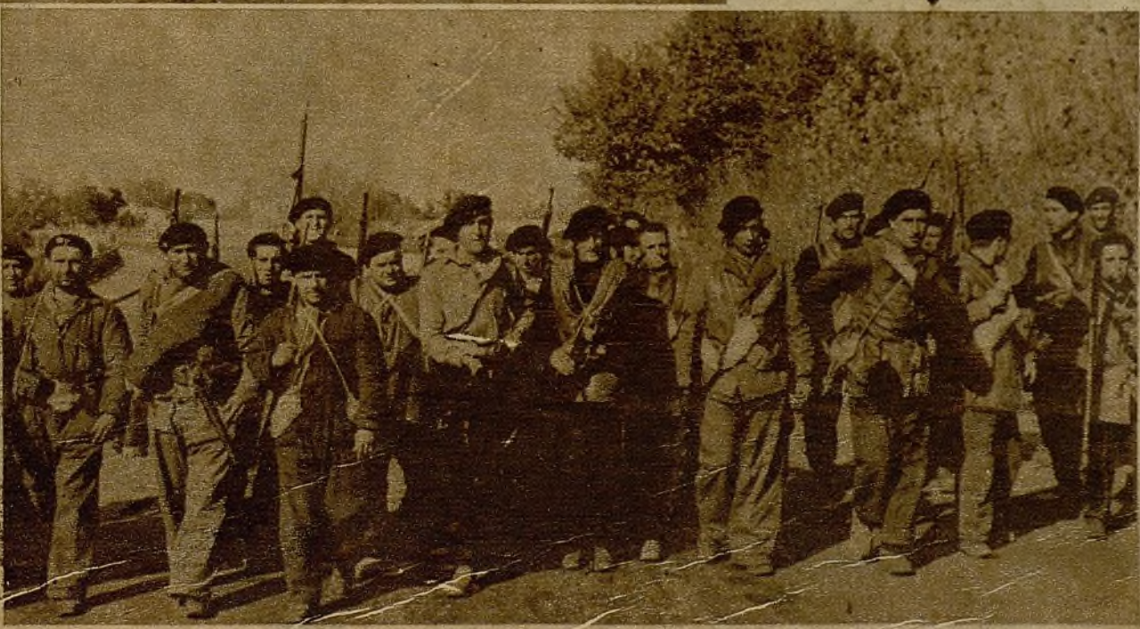
Un grupo del batallón Internacional, formado por numerosos simpatizantes con la causa española, de diversos países, y que ya se ha batido con magnífico denuedo