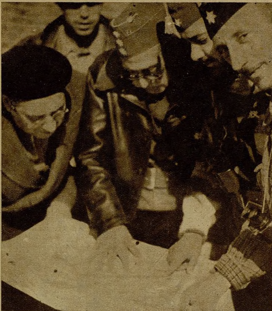
Ha habido que cambiar la situación de las fuerzas, después de realizado el avance, y el Mando estudia los lugares donde se deben hacer los emplazamientos y defensas