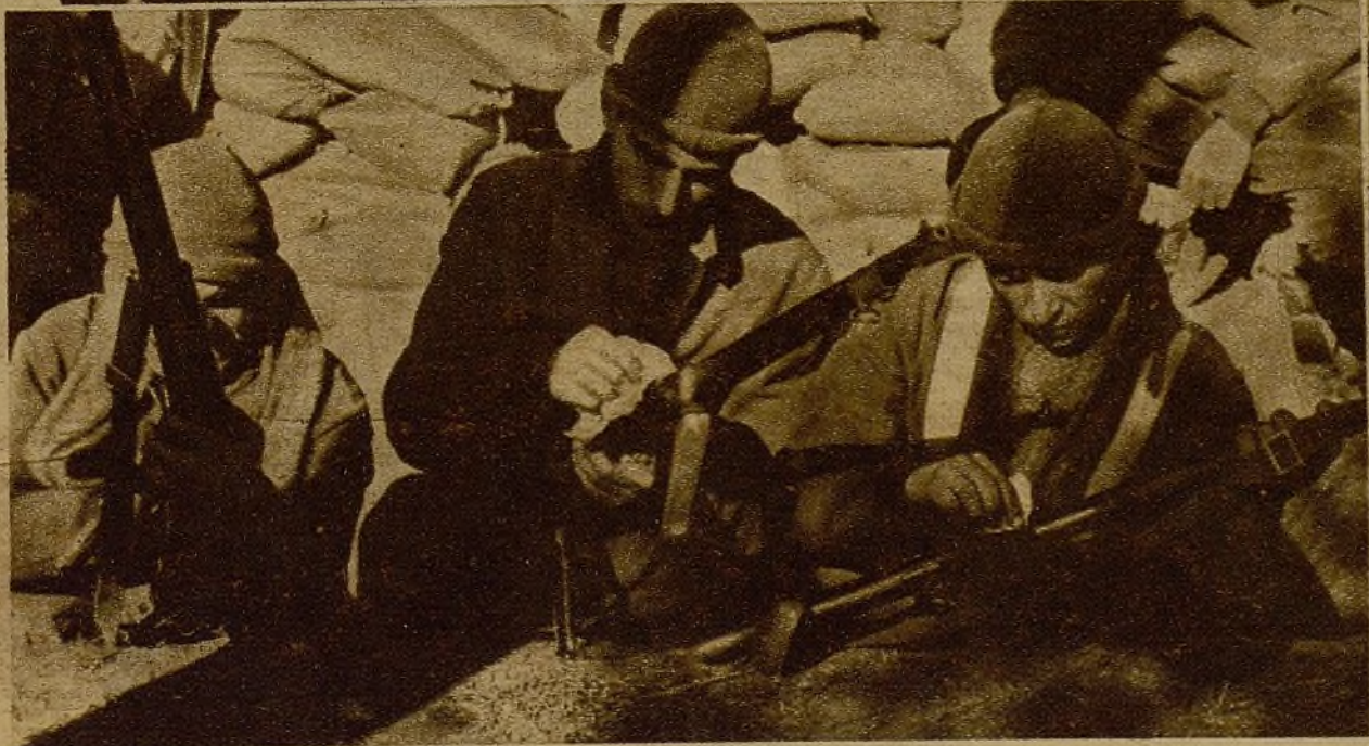
En los momentos de tregua los milicianos se ocupan metódicamente en el engrase y cuidado del fusil, su mejor amigo, su defensor ante el peligro