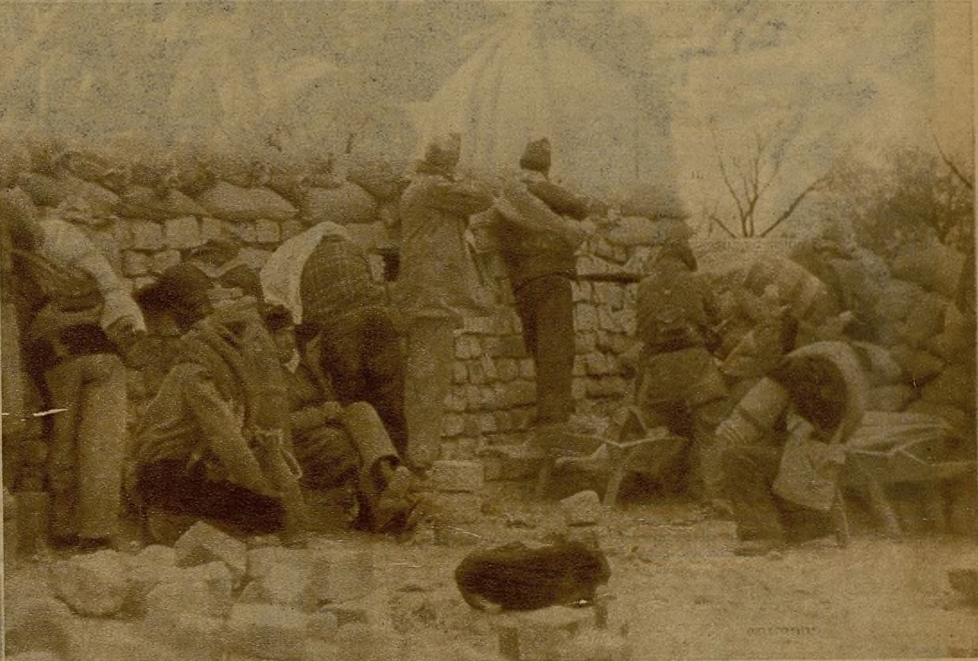
Unas veces contestando al fuego enemigo, otras en calma, a veces "mitad y mitad"; ésta es la vida en los parapetos de primera línea

—Esto tiene otra fisonomía. Me llena de orgullo el poderlo decir. La moral de nuestras Milicias sigue tensa y espléndida. Llevamos con hoy diez días de constante y violentísima pelea. Los hombres