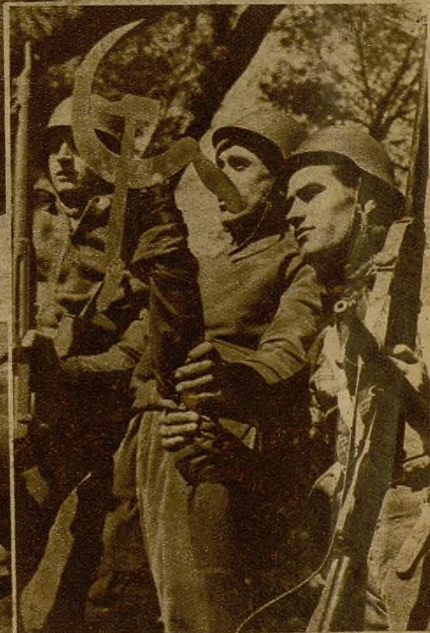
Estos soldados, que han tomado parte en la conquista de una trinchera, de la que desalojaron a los facciosos en valeroso embate, ostentan en el lugar de la lucha el emblema comunista