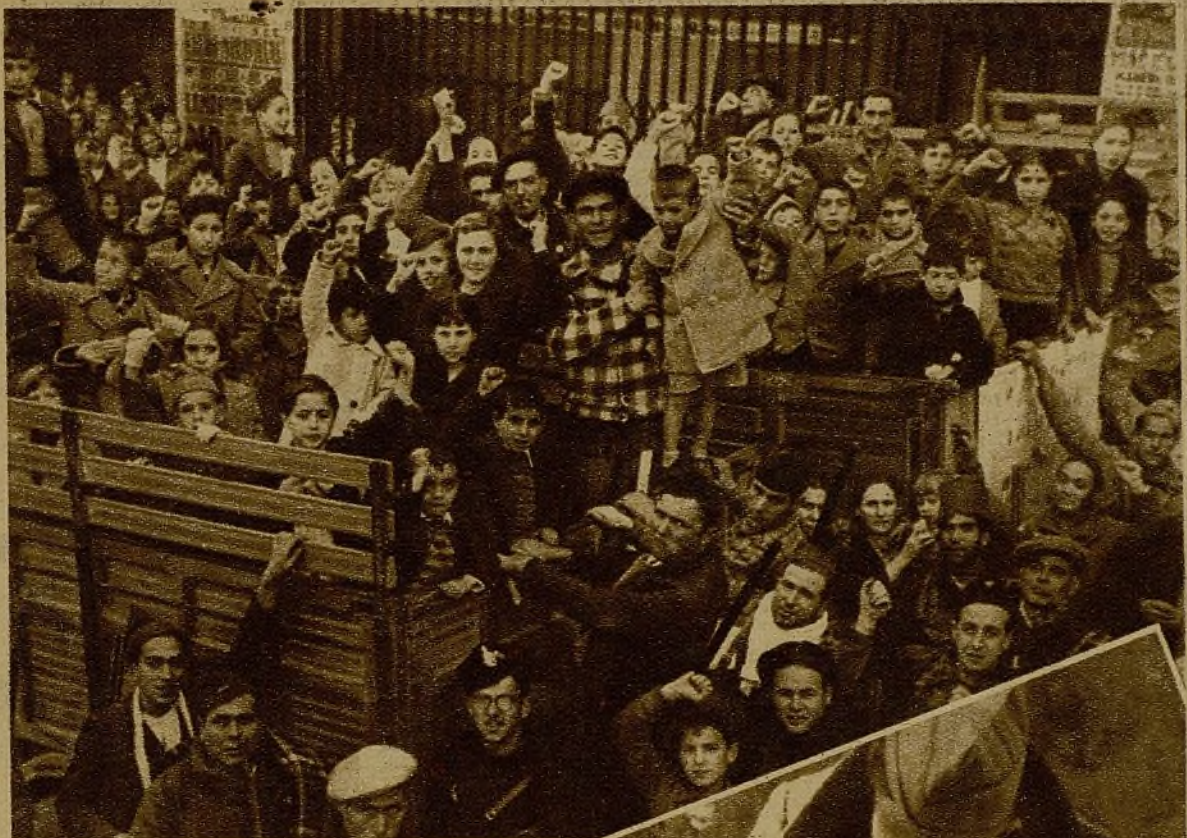
Una colonia infantil madrileña, organizada por la Casa de Valencia, que ha marchado para instalarse en la capital levantina, momentos antes de la salida