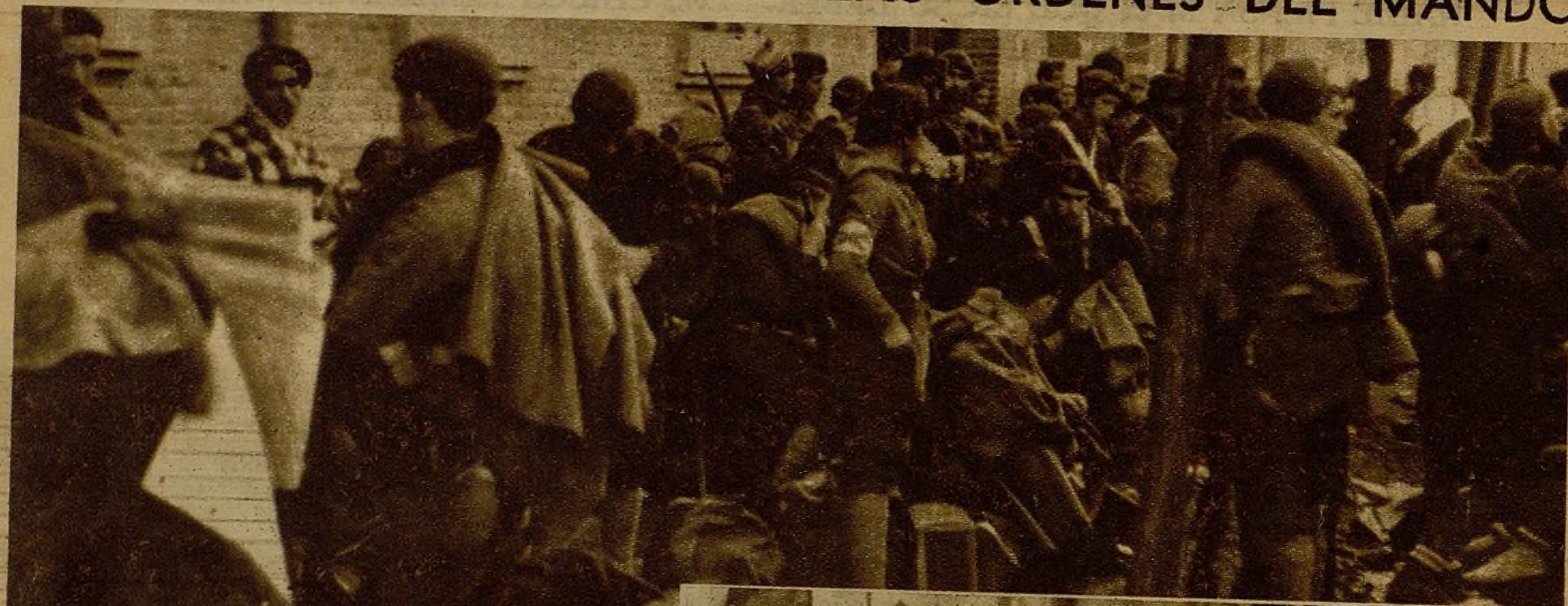
Concentrados en la línea de retaguardia, prestos a emprender la marcha apenas el Mando transmita su orden, los soldados, completamente pertrechados, están alerta...