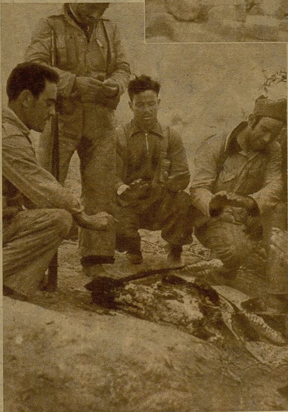
Durante la hora del amanecer, los soldados de las avanzadillas se calientan en primitivas fogatas

no se apartan de sus sitios. Nadie se acuerda de los afectos que tiene en la retaguardia. ¿Quiere usted creer que no se ha solicitado por nadie ni un solo permiso de veinticuatro horas?