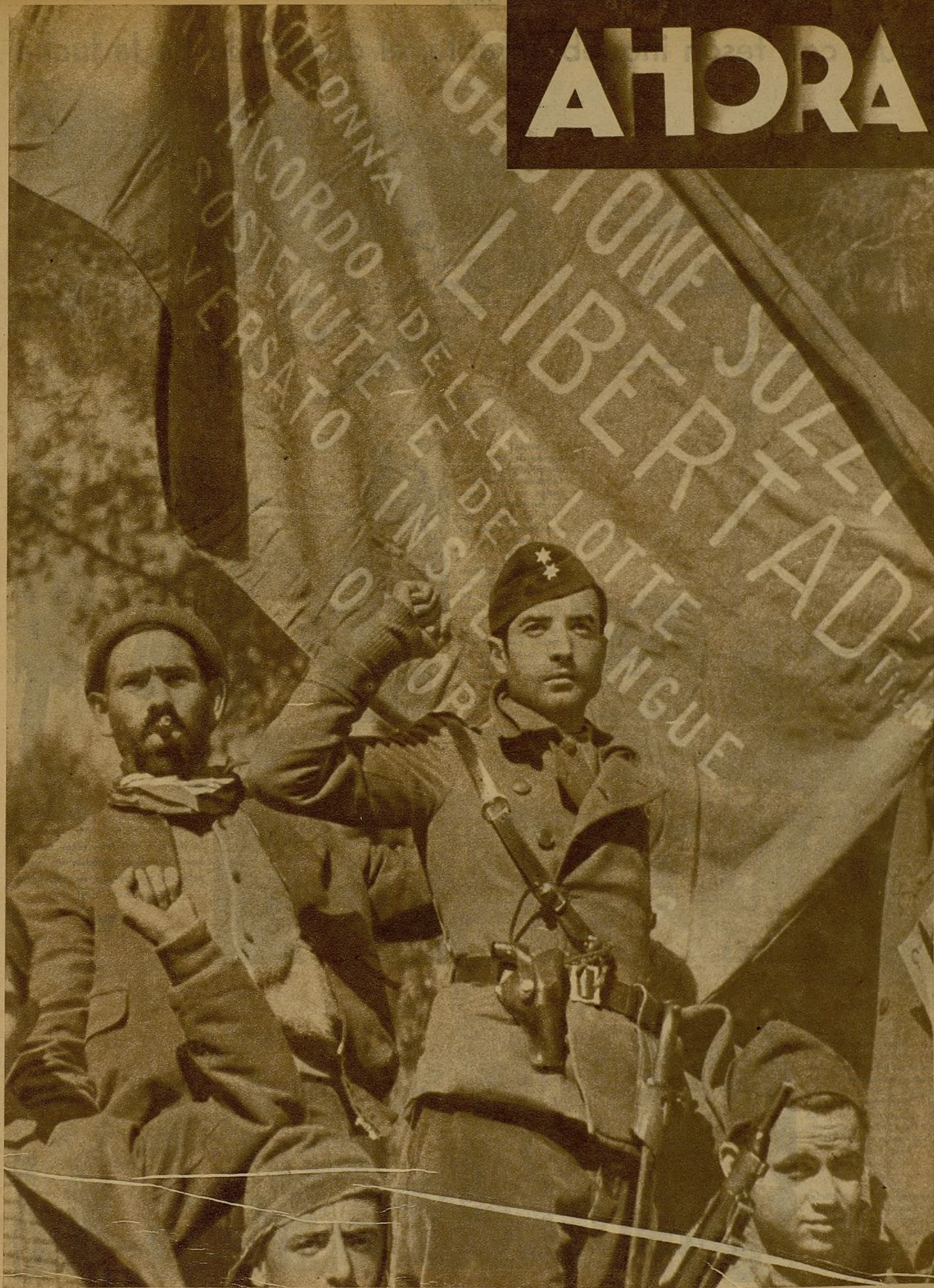
LA COLABORACION DE LOS HOMBRES LIBERALES DE OTROS PAISES EN LA LUCHA POR LA CAUSA DE LA LIBERTAD.—Con heroico afán, en generosa suma a la lucha, numerosos hombres de diversos países se adscriben a nuestras columnas para participar valerosamente en la guerra contra el fascismo. He aquí la bandera de uno de estos nutridos grupos, que ya actúa en las líneas de combate.