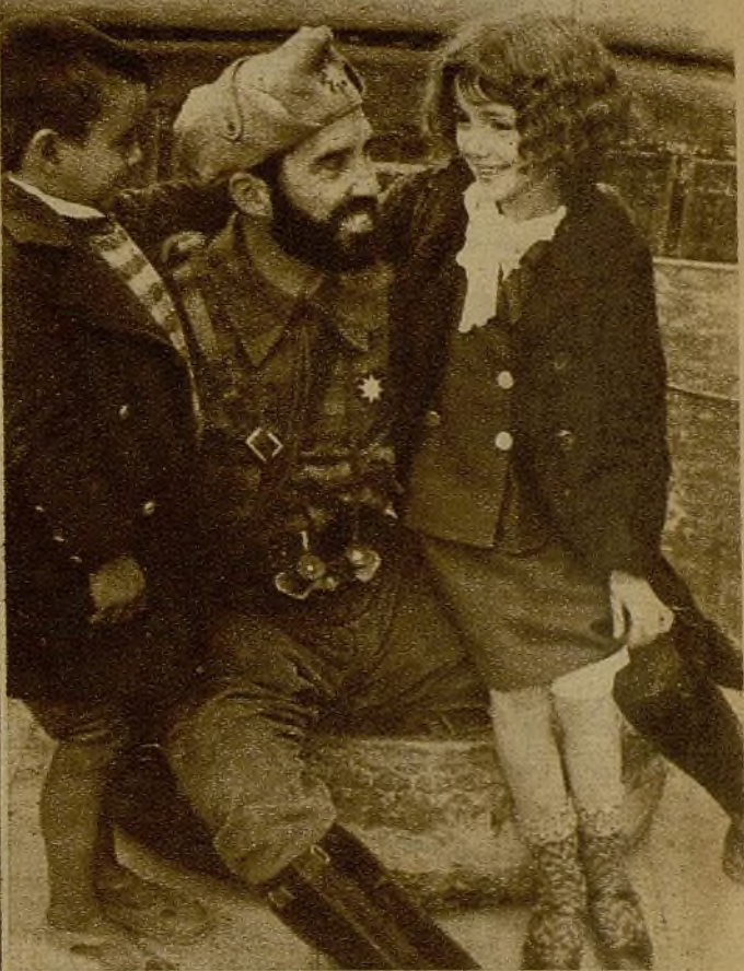
Un comandante de las Milicias valencianas despierta a estos dos pequeños madrileños que, formando parte de una caravana de cuatrocientos, marcha a la capital de Levante