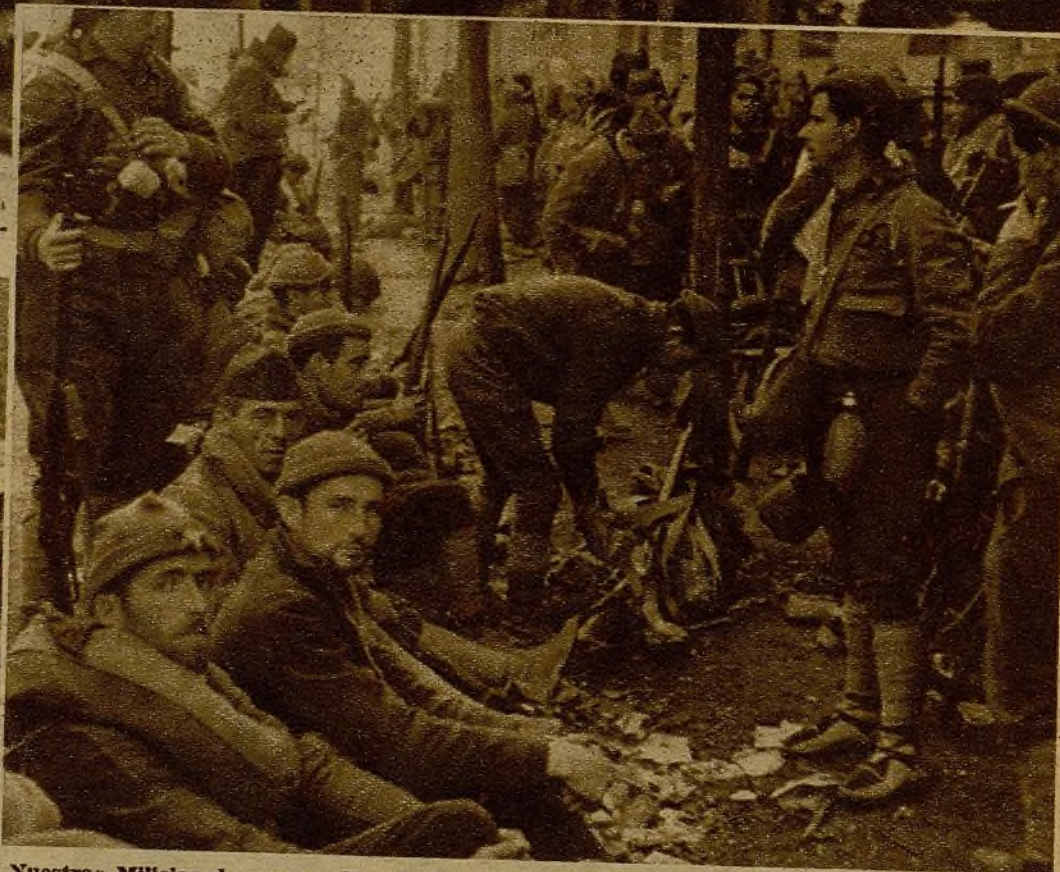
Nuestras Milicias de vanguardia sostienen bravamente la lucha con el enemigo y le sujetan férreamente. Estas tropas, en las líneas traseras, están dispuestas para reforzar la línea en el momento en que estimen necesario