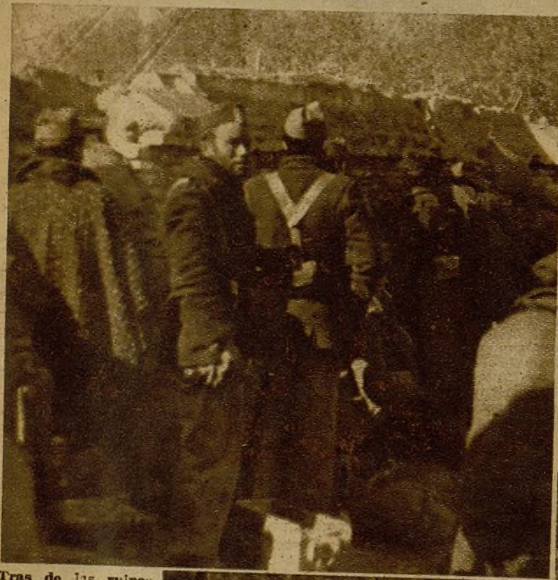
Tras de las ruinas de una tapia, que ofrece sólido parapeto, se agrupan los soldados, atentos al instante en que hayan de iniciar el tiroteo