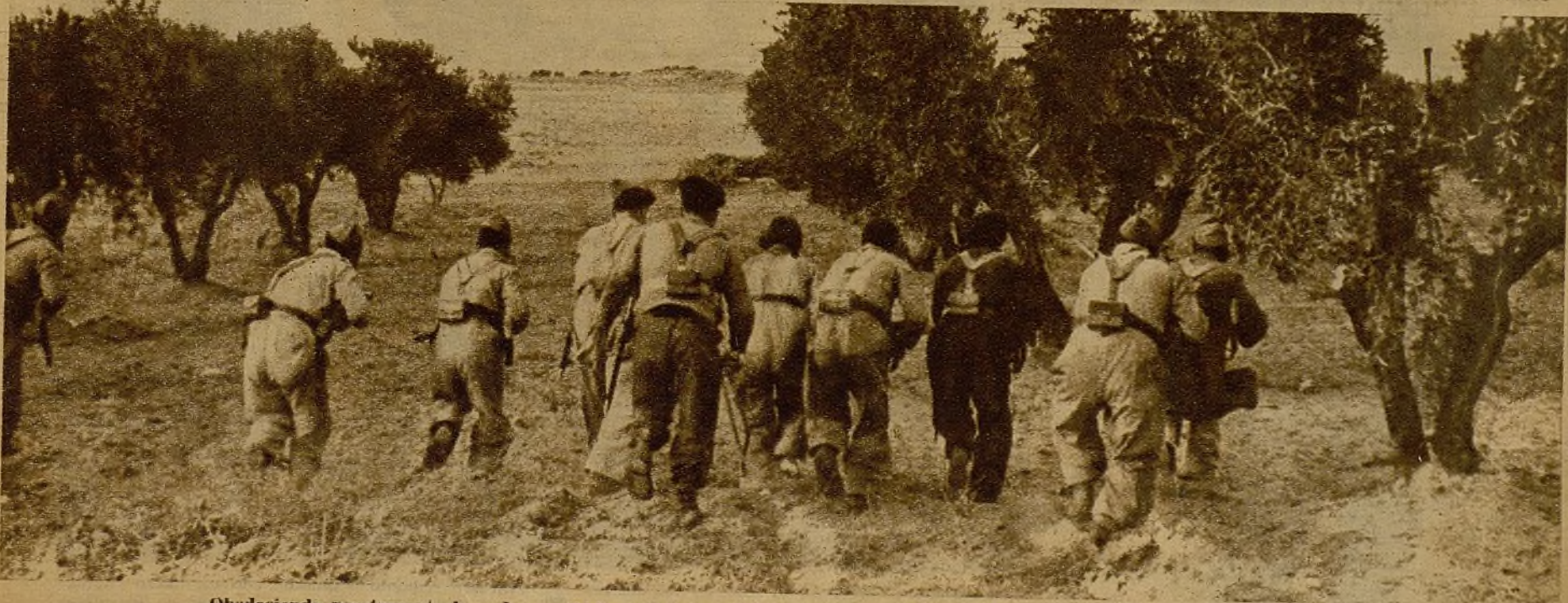
Obedeciendo prestamente la orden recibida, y bajo la protección de los árboles, esta patrulla de la primera línea avanza