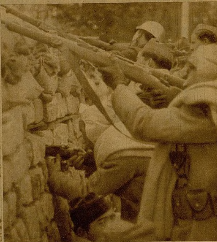
Tras los sacos terreros, con incansable tenacidad, nuestros milicianos mantienen inalterablemente sus posiciones