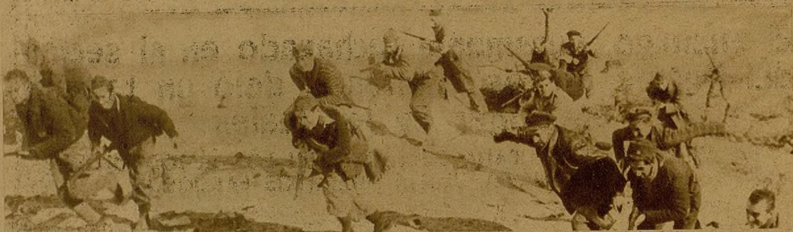
Allí donde el enemigo esperaba una rápida victoria no ha tenido más remedio que replegarse ante el empuje de nuestros milicianos. Estos, obedeciendo las órdenes del Mando, han abandonado sus parapetos y resguardos para lanzarse al ataque

(DE NUESTRO ENVIADO ESPECIAL ANTONIO DE LA VILLA)