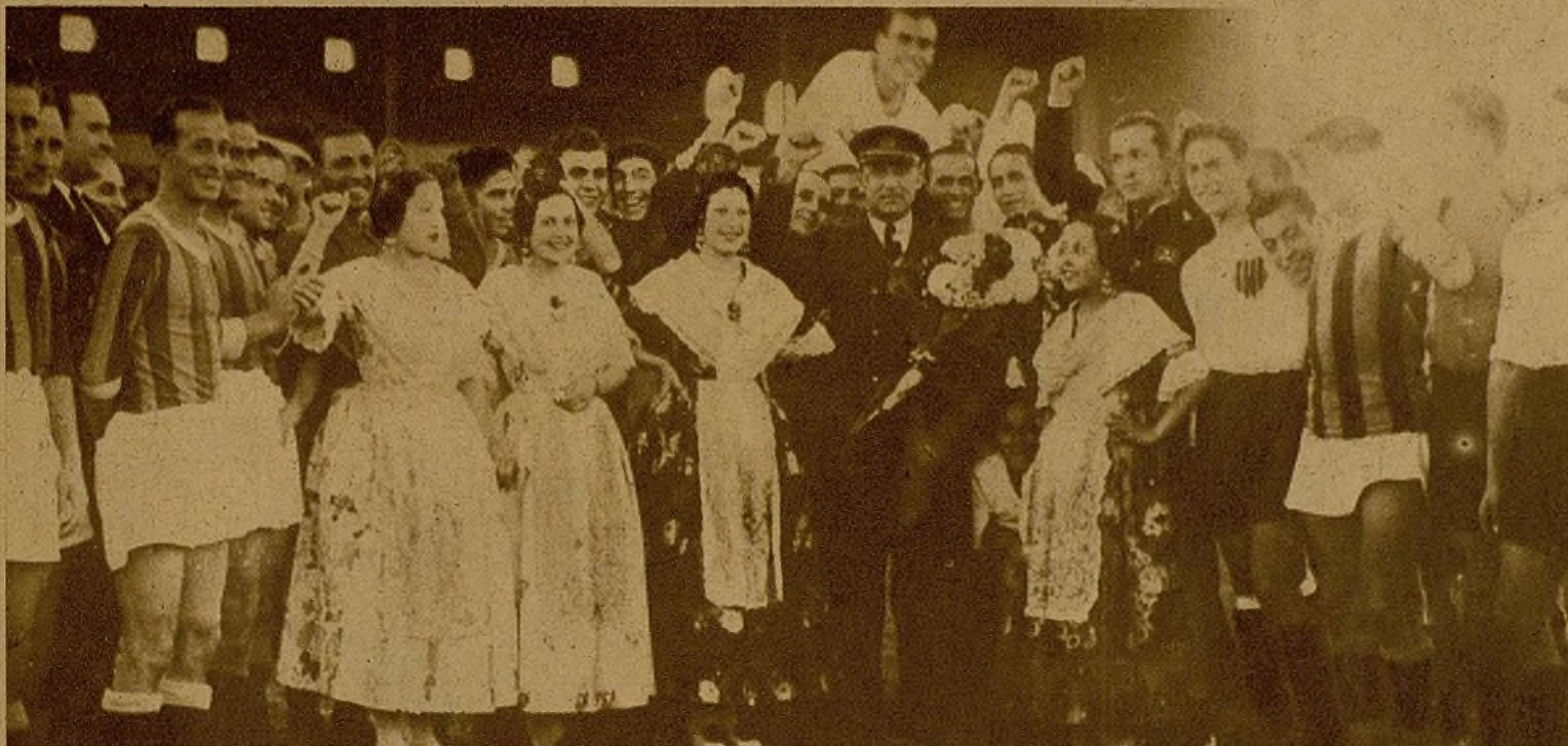
El capitán del buque ruso llegado a Valencia con alimentos y ropas para los hijos de los luchadores españoles, rodeado de bellas jóvenes, ataviadas con el típico traje valenciano, y de los jugadores que actuaron en un partido de fútbol en homenaje a los marinos soviéticos, en el campo de Mestalla