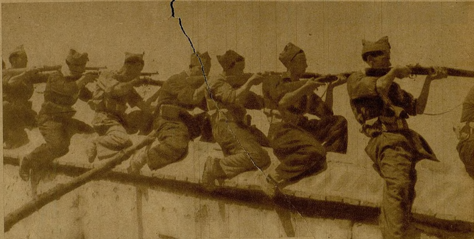
A horcajadas sobre la tapia, sosteniendo un nutridísimo tiroteo, un grupo de soldados se expone a ser blanco propicio del enemigo, con tal de dominarle con su fuego