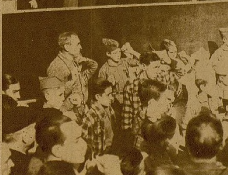
Momento de ser descubierta la placa que da el nombre de "Plaça de la Generalitat Catalana" a una de las principales de Valencia