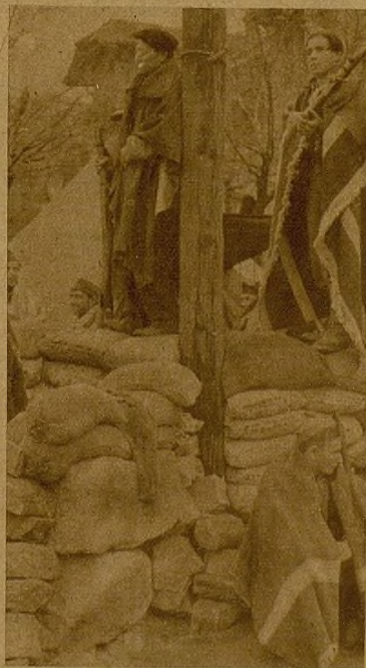
Sobre la barricada, una vez logrado que el enemigo se replegara, los milicianos vigilan los movimientos de las concentraciones facciosas

efectivos se hallan diezmados. Alguien que más. No pensemos en voz alta y confiemos en el factor tiempo, que es el peor enemigo que tienen los que tratan de destruir y arruinar para siempre a España.