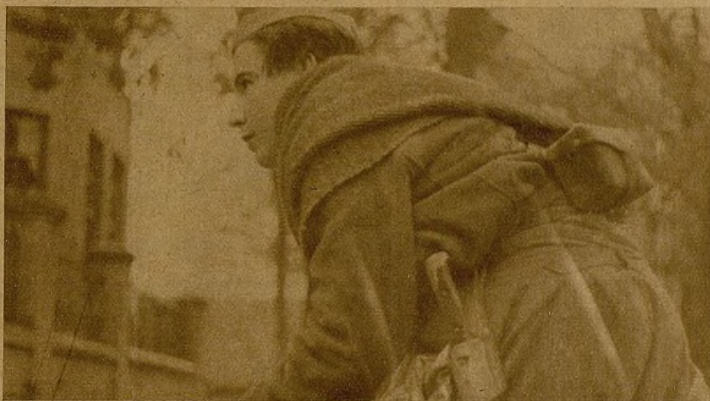
Precediendo a otros compañeros, con la lógica cautela, dada la proximidad de los facciosos, este miliciano avanza para colocarse en un lugar estratégico

Por la carretera de los Carabancheles ayer se ocuparon dos puntos que dominan lugares estratégicos que, desde hace varias horas, batían nuestros cañones, sin dar punto de reposo al adversario. El jefe del sector nos mostraba ayer su gran satisfacción por los progresos que durante la jornada había realizado su gente. La resistencia enemiga es dura, tenaz—sabe lo que en estos instantes se juega—, pero sus tropas de choque están destrozadas por las violentas jornadas que han tenido que librar frente a la mansa corriente del humilde Manzanares, y sus efectivos muy diezmados. Alguien que tiene motivos para conocer casi al detalle las pérdidas de los fascistas en los diez días que lleva combatiendo a la vista de los arrabales de la capital, hacía ayer ascender a más de tres mil quinientos los muertos, a seiscientos y pico los prisioneros y una cifra muy crecida los heridos. Esto por lo que respecta a lo que ante nuestros ojos tenemos destrozadas por las violentas jornadas que ha tenido que librar frente a la mansa corriente del humilde Manzanares, y sus