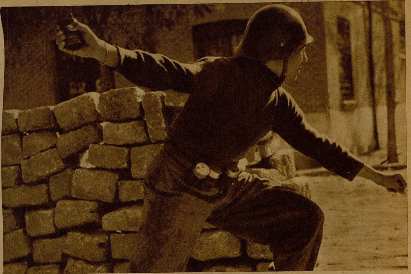
El parapeto constituye para el bravo luchador la representación de su hogar. Lo defiende con invencible empeño, y su simbólica imagen le presta nuevos alientos para proseguir la lucha hasta el final