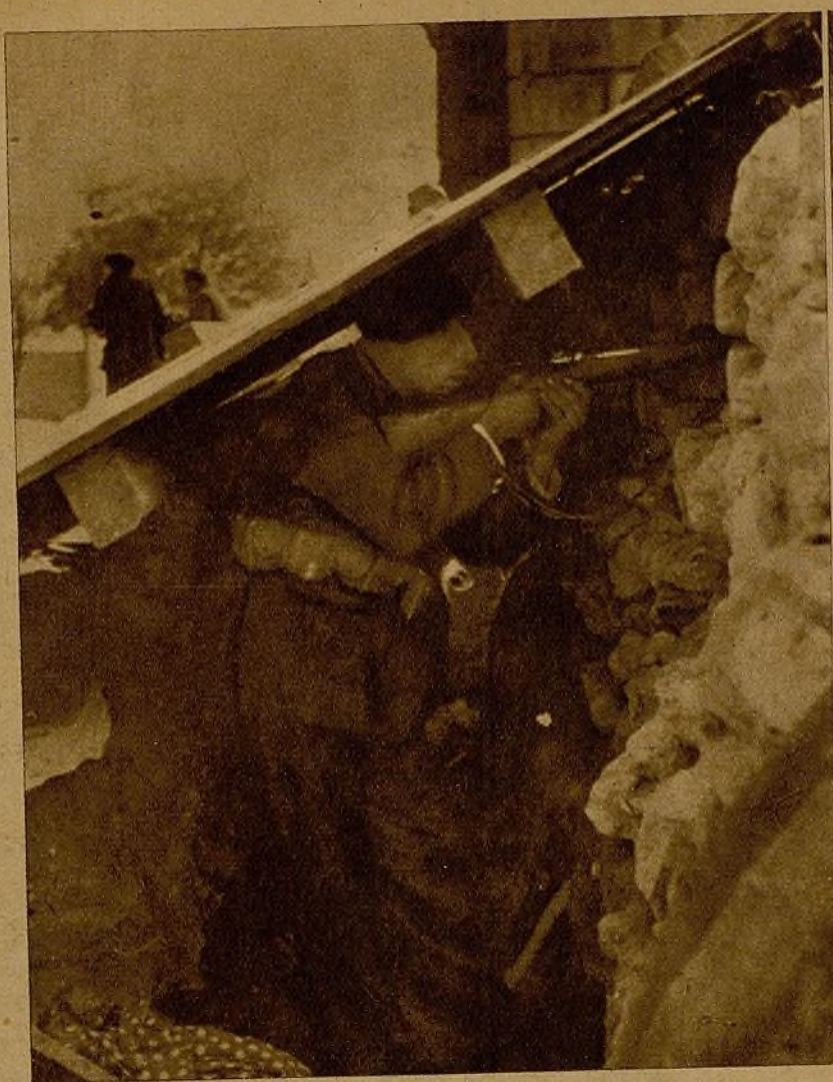
Un excelente puesto de vigilancia, donde el miliciano que lo defiende, perfectamente parapetado, sostiene ventajosamente la lucha