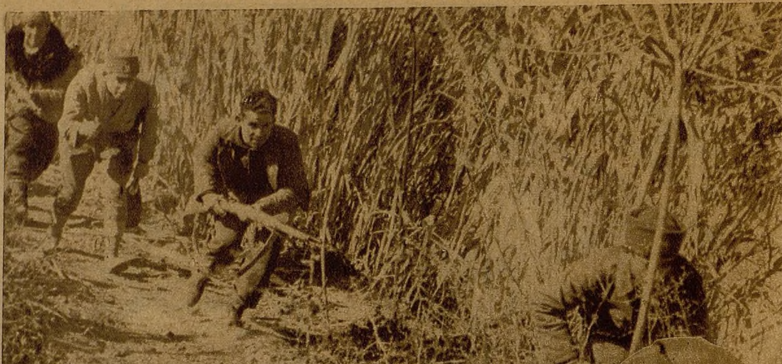
Los ca- ñaverales cons- tituyen una exce- lente protección para la guerrilla en avance. En este mo- mento su marcha está perfectamente amparada. Momentos después, a pecho descu- bierto, impetuosamente, se lanzarán los milicianos al ataque por sorpresa