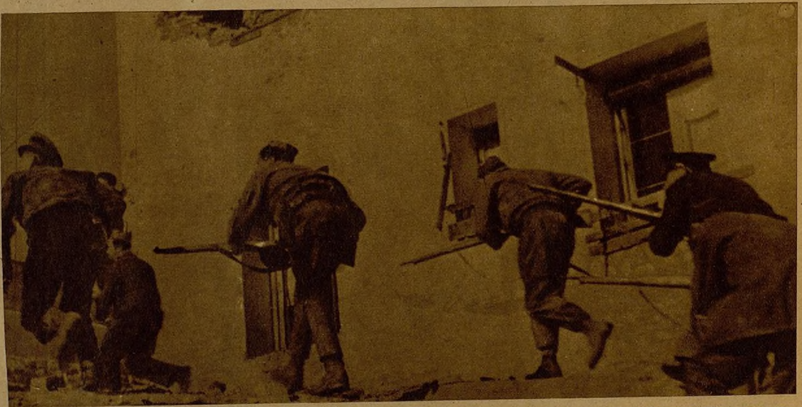
Al amparo de la pared, casi derruida, que de momento les protege, los milicianos avanzan hasta divisar el campo libre, para emprender rápida carrera hacia la posición encimada, que les hará dominar las líneas facciosas