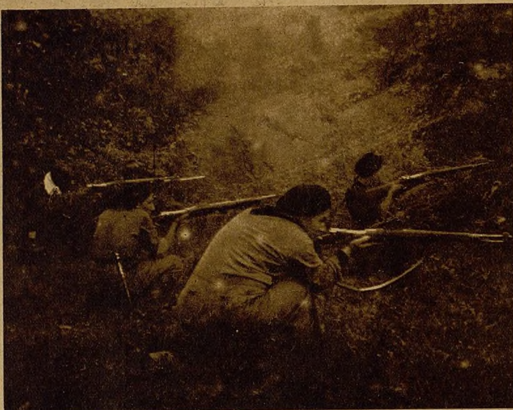
Milicianos de Asturias repeliendo un ataque, con vigorosidad y ánimo, en el frente de Cayés

Tampoco eran muchos más los que en un ataque desenfrenado obligaron a desalojar en los primeros días de agosto el cuartel de Lugones donde se defendían más de cien guardias civiles.