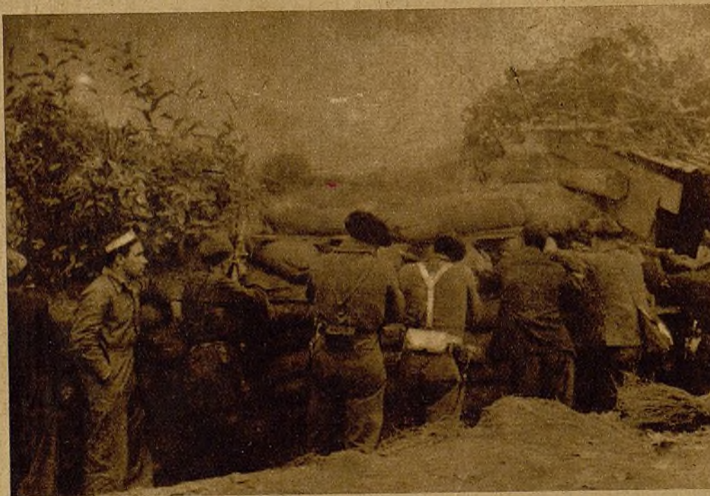
Con un magnífico espíritu, seguros de la victoria, ya en las proximidades más inmediatas de Oviedo, nuestros fusileros realizan certeramente su cometido

Con todos estos datos que nadie me ha contado, puesto que los he vivido, pretendo demostrar que únicamente es posible que estos magníficos guerrilleros asturianos venzan, encomendándoles ofensivas que con el armamento copioso y perfecto de que disponemos se verán siempre coronadas por el mejor éxito. Si la mejor cualidad de un buen jefe ha de ser el conocimiento de la gente que a sus órdenes pelea, quien mande a los asturianos ha de saber que las que aquí se formen no pueden ser, por el peculiar carácter de sus componentes, unas Milicias aptas para esperar la llegada del enemigo pacientemente, sino fuerzas dispuestas para vencer.