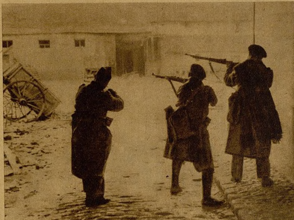
Después de una intensa acción, en la que el enemigo hubo de huir ante nuestro fuego, estos soldados ahuyentan con sus tiros a los últimos fugitivos

(DE NUESTRO REDACTOR JOSE QUILEZ VICENTE)