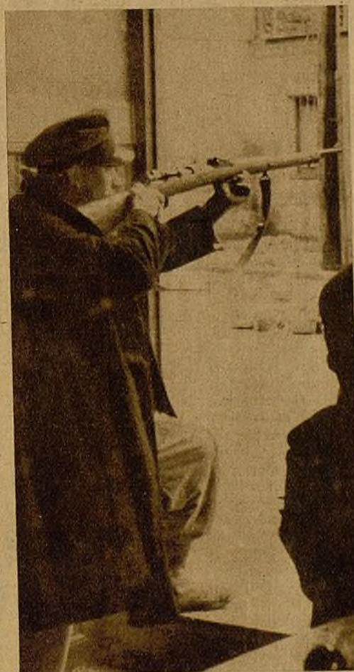
Ante el portal de una casa donde habían hecho refugio los facciosos, nuestros soldados aseguran su entrada poniendo en fuga al foco resistente

No ha dejado el heroico militar ni un minuto de descanso a los rebeldes. Ayer, después de la presencia de las brujas y los dragones, lanzó sus efectivos carretera adelante, y como un huracán de fuego y hierro, enfervorecidos los hombres en un santo renunciamento a todo, llegaron a cerca de cuatro kilómetros de sus bases, adueñándose de magníficas posiciones y emplazamientos, de víveres, armas y municiones. Se lograron todos los objetivos que se habían anunciado. Cuando al filo de las doce los fascistas quisieron reaccionar, la maniobra estaba rematada y remachada. Aquellas posiciones que vergonzosamente habían abandonado, las ocupan hombres dispuestos a dejarse la vida antes que retroceder un paso. No intentaron un ataque a fondo. Las ametralladoras y los cañones comenzaron a barrer las ligeras concentraciones preparadas y aún se les hizo retroceder un kilómetro más. Un día que, sin despejar el peligro que sobre Madrid gravita aún, es altamente confortador y trae entre esta bendita llovizna aires de esperanza para los que en la República y la Democracia hemos puesto todos nuestros amores.